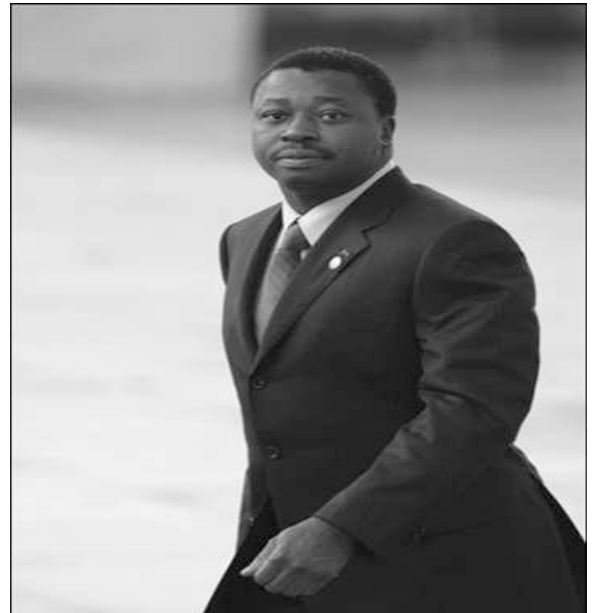
lement grâce à la rénovation des du Togo (CEET).

La croissance importante observée au niveau des cultures vivrières s'explique par la mise en œuvre de la stratégie de relance de la production agricole assortie d'un plan d'action triennal d'urgence initié par le gouvernement en vue de lutter contre la vie chère et de renouer avec la croissance économique. Elle s'est traduite par la mise à disposition de 30 000 tonnes d'engrais (2009-2010) contre 8000 tonnes au titre de la campagne 2008-2009, et par la révision à la baisse du prix des intrants qui passe de 12 500 F CFA le sac de 50 kg en 2008-2009 à 11 500 F CFA en 2009-2010. Il faut noter une augmentation continue des superficies emblavées de céréales et de tubercules ces 4 dernières années. Cependant, la prévision de l'année 2010 repose sur l'hypothèse d'une légère progression de la production vivrière malgré l'intensification des mesures de soutien du gouvernement aux paysans, notamment la distribution d'engrais. Cette moins bonne performance s'expliquerait par une pluviométrie capricieuse au cours du deuxième trimestre 2010 qui a surtout affecté le maïs. En ce qui concerne le coton, il était envisagé une augmentation modérée de la production compte tenu des réformes opérées dans cette filière avec le démarrage des activités de la Nouvelle Société Cotonnière du Togo (NSCT). La production du café et du cacao s'améliore éga-