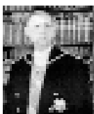
Charles de Gaulle