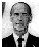
Valéry Giscard d'Estaing