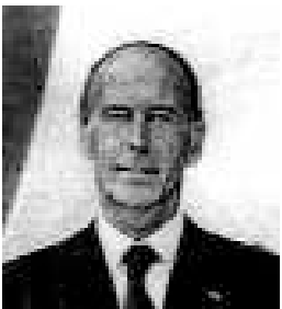
Valéry Giscard d'Estaing

Robert BOURGI à révéler ce que tout le monde sait. " Pour mettre fin au côté caché de la Françafrique",