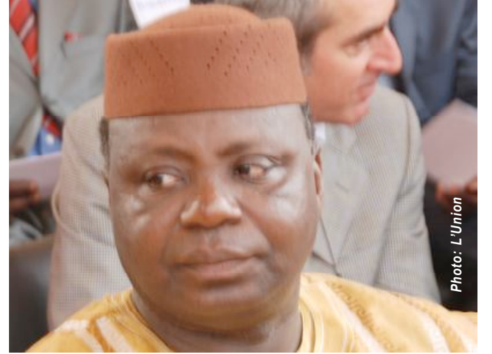
Batiene Kpabré-Silly, Ministre du Tourisme

des atouts non négligeables, les uns liés à la nature (relief, faune, flore, littoral) et les autres à l'histoire et à la culture (monuments, musées, artisanat, musique, folklore). L'expérience acquise en matière de développement et de gestion touristique dans les années 80