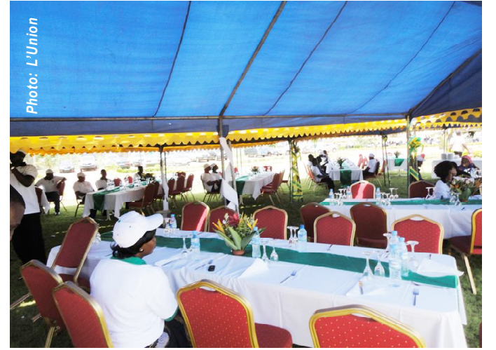
Les agents de la DGI