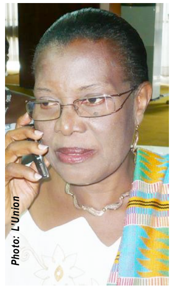
Olivia Amédjogbé-Kouévi, Ministre de la Promotion de la Femme

Aujourd'hui, on veut poser un autre pas. Des bruits sonores venant du cabinet de la ministre Olivia Amédjogbé-Kouévi de la Promotion de la Femme indiquent qu'un avant-projet de loi est presque prêt pour l'accès aux mandats électoraux, aux fonctions électives et aux nominations au sein des organes et institutions de l'Etat et dans l'administration publique. C'est un vœu cher des organisations féminines. Le texte autorise une représentation équitable minimale pour chacun des deux sexes, à raison d'un tiers (1/3) dans les différents domaines visés. Il dit par exemple que lorsque le scrutin de liste se déroule dans plus d'une circonscription électorale, les têtes de liste doivent avoir une représentativité minimale par sexe de 1/3 du nombre total des listes présentées par tout parti politique, regroupement de partis politiques ou d'indépendants. Quand le scrutin a lieu dans une circonscription électorale unique, les deux sexes s'alternent sur la liste présentée. A défaut, l'écart entre deux candidats de sexe différent ne peut être supérieur à deux. En aucun cas,