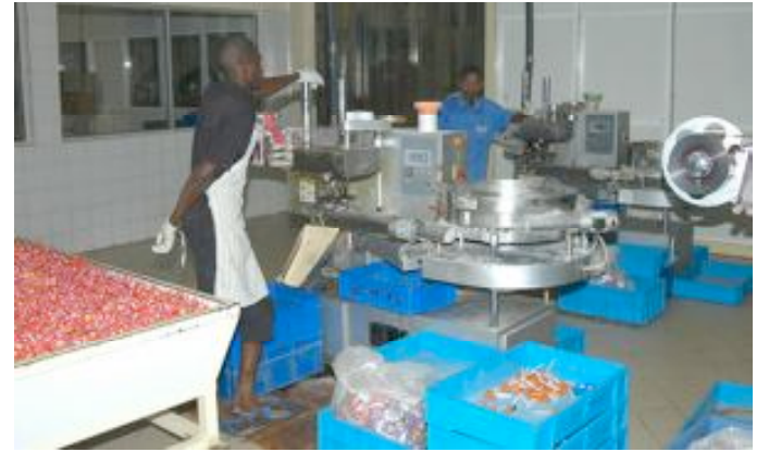
Une unité industrielle

Le secteur est caractérisé par un niveau d'industrialisation encore embryonnaire et faiblement intégré au reste de l'économie. Sa contribution à l'emploi est modeste. Le tissu industriel togolais est assez clairsemé, composé d'une dizaine de grandes entreprises, d'une centaine d'industries de taille moyenne et d'un nombre relativement important de très petites unités industrielles. L'industrie togolaise est confrontée à des contraintes de plusieurs ordres, notamment le climat des affaires peu propice à l'attraction des investissements, la lourde fiscalité, l'étroitesse du marché intérieur, les difficultés d'accès au financement, la forte concurrence des produits