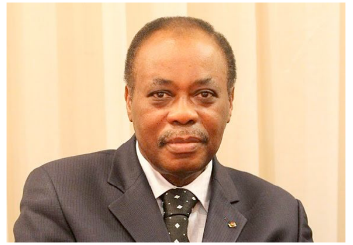
M. Edem Kodjo

Et aujourd'hui, elle fait appel au fédéralisme, idée qui s'oppose au confédéralisme qui n'a réellement pas d'histoire dans le monde. Concept assez complexe, le fédéralisme suppose ici le regroupement ou l'association d'Etats qui se seront engagés à accorder à l'Etat central des