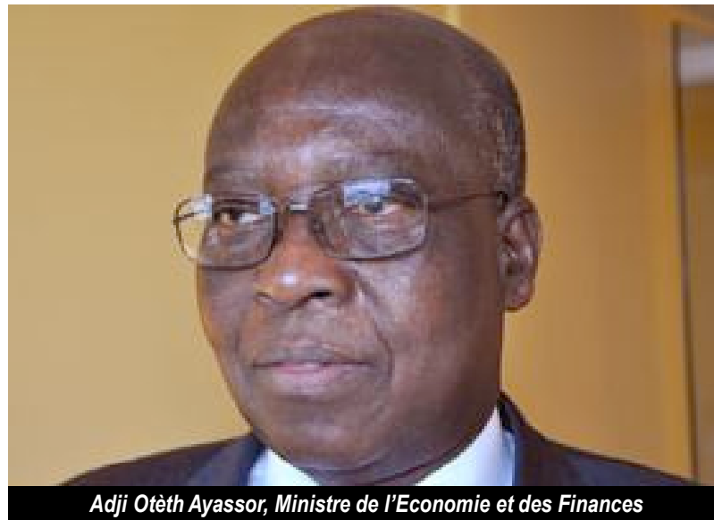
Adji Otèth Ayassor, Ministre de l'Economie et des Finances

P.5 FOOTBALL/CAN 2013 Ahoomey-Zunu: "Les problèmes de primes des Eperviers seront réglés avant la compétition"