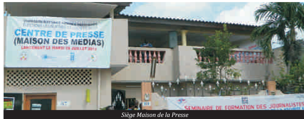
Siège Maison de la Presse

Désormais les professionnels de médias pourront se vanter de s'être doté d'un centre de presse pour couvrir les législatives de cette année. En effet le centre de presse législatives 2013 inauguré ce Mardi n'est situé autre part qu'au sein de la maison de presse. Un geste particulier de la CENI entendons par là Commission Electorale Nationale Indépendante et du HCDH Togo. C'est au total 10 ordinateurs, 7 imprimantes, 5 scanners et une photocopieuse qui ont été offert comme don de matériel. Le directeur de la maison de la presse ainsi que le secrétaire de l'UJIT n'ont pas manqué tous deux de remercier la CENI et les autres partenaires pour avoir prêté une oreille attentive aux demandes des journalistes pour l'appui matériel et la mise en place de ce centre de presse législatives 2013 : gage de volonté à doter