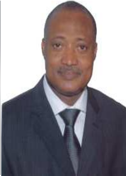
J-P FABRE, député, Pdt ANC

Dramani, protégé par les 10 cuirasses, membres du bureau. Dama Dramani, ancien président du Groupe parlementaire RPT, est un acteur rompu à la tâche, avec à son actif une longue carrière politique trop bien remplie, mais l'homme se distingue plus par les attributs de son caractère : ferme, rigoureux, pugnace, opiniâtre et dur à croquer. A bon chat, bon rat, dit-on. Dans sa première intervention après son élection, Dama Dramani a reconnu le poids de sa nouvelle charge et a promis exercer avec sincérité, humilité et respect. « Je m'imposerai le devoir d'être à l'écoute de mes collègues », a-t-il ajouté. Et bien, il faut qu'il en soit ainsi, pour éviter le schéma "discussions interminables-vote forcé d'UNIR-boycott des séances par les députés de l'opposition". Et si cela arrivait, l'opposition ne sera victime que de ses propres turpitudes, au moment de travailler et de saisir la perche du dialogue,