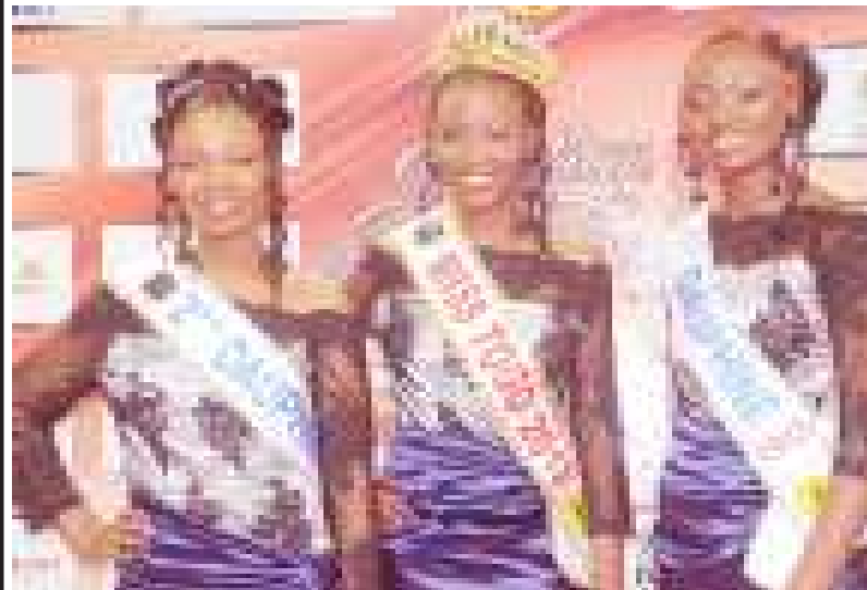
TRIO GAGNANT MISS TOGO 2013