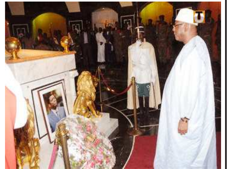
IBK DEVANT LA TOMBE D'EYADEMA