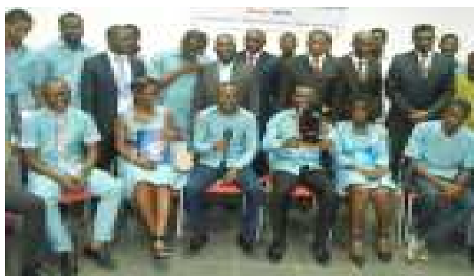
L'équipe du Cénacle, entourée par les lauréats