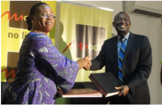
Echange de documents entre la DGA de CIB et le DG de Moov-Togo

En effet, avec un nombre croissant d'abonnés, Moov-Togo a jugé nécessaire de continuer dans sa dynamique, en faisant en sorte d'être toujours plus proche de ses clients et de leur offrir le meilleur service client à travers ses points de contact. « Moov essaie de se distinguer dans l'innovation de ses produits et de sa façon de faire en fournissant des services après vente à ses clients et en même