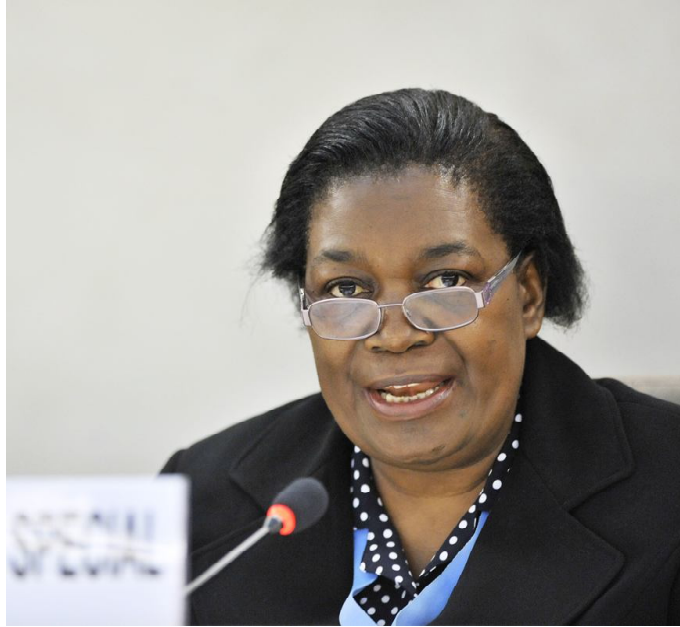
Margaret Sekaggya, Rapporteuse spéciale des Nations Unies