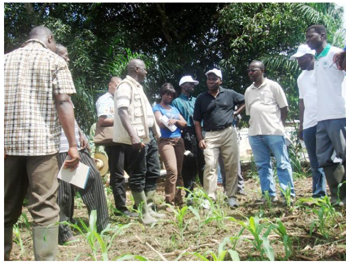
Visite de terrain de la 3 e mission d'évaluation du Pniasa