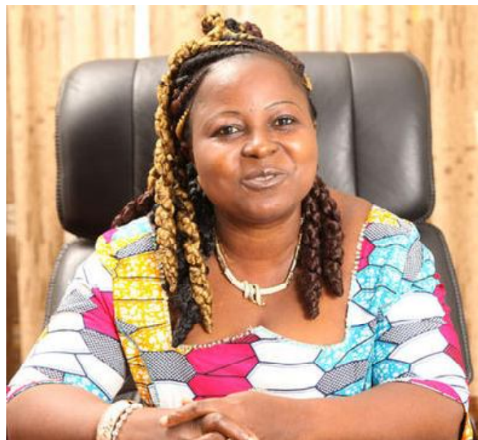
Kouméalo Anaté, Ministre de la Culture

Les eaux sacrées et leurs sites sont inscrits au patrimoine culturel national en vue de la sauvegarde des us et coutumes locales et de la protection de l'environnement et des ressources hydrauliques. A ce titre, ils ne peuvent faire l'objet d'exploitation commerciale ou onéreuse. Ils constituent un bien commun de la nation et ne peuvent faire l'objet d'appropriation privative. Ils bénéficient, de ce fait, d'une protection spéciale de l'Etat et de