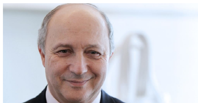
Laurent Fabius, Ministre français des Affaires Etrangères

Cinq pays du Golfe de Guinée, à savoir le Togo, le Bénin, le Nigeria, le Ghana et le Cameroun sont retenus par le Fonds de solidarité prioritaire (FSD) « Appui à la lutte contre la traite des êtres humains dans les pays du Golfe de Guinée » que le ministère français des Affaires étrangères lance officiellement demain mercredi à Lomé. On estime que la traite des êtres humains est particulièrement répandue en Afrique de l'Ouest. Et les cinq pays cités « sont considérés comme des pays d'origine, de transit et de