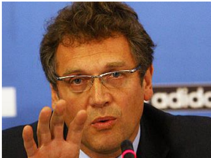
Jérôme Valcke, Secrétaire Général de la FIFA

"Pour réussir, il est important d'avoir le soutien des autorités politiques et c'est ce qui justifie notre présence au Togo et le chef de l'Etat togolais est quelqu'un de charmant, intéressé par le football et qui est parfaitement au courant de la situation du football et qui sait qu'elle est le pouvoir du football, un pouvoir social, culturel, éducatif, et par conséquent il a aussi intérêt que le football togolais reste fort. Il