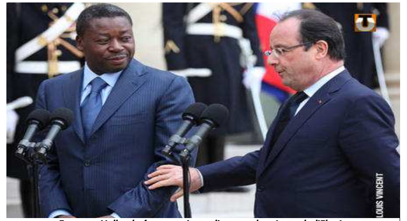
Faure et Hollande face aux journalistes sur le perron de l'Elysée

Faure Gnassingbé : Effectivement, je suis venu ici.