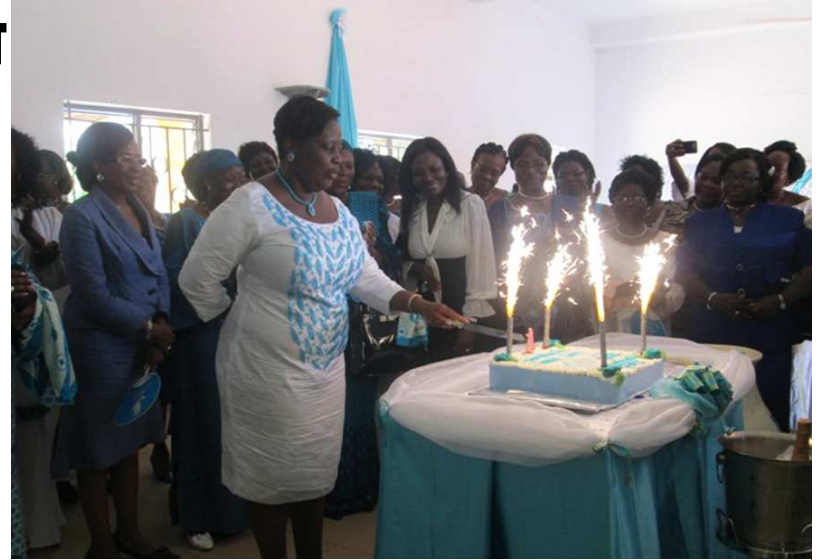
Partage du gâteau d'anniversaire

Pour un an d'existence c'est tout un palmarès que l'on peut retenir de la lutte pour l'ascendance du parti Unir