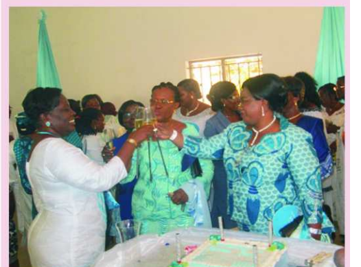
Toast d'anniversaire pour le CFU