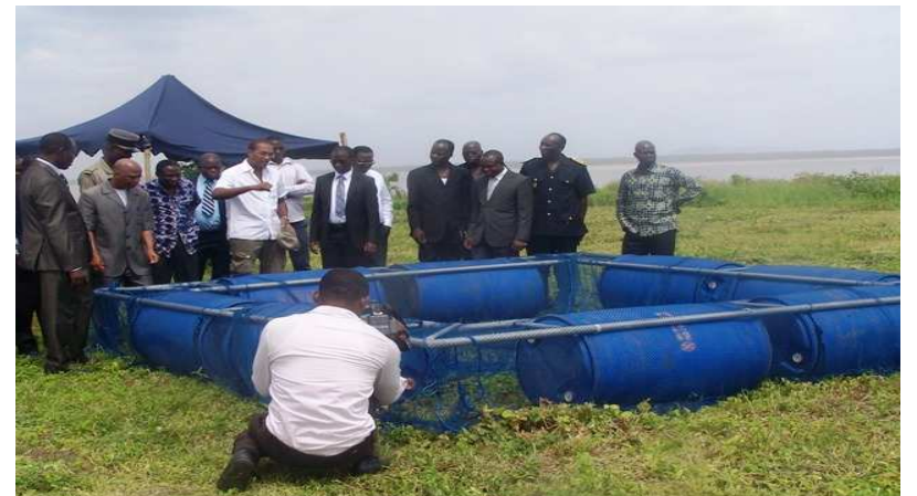
Visite des cages flottantes

Cette œuvre autobiographique, première du genre aux éditions continents, est la vie de l'auteur racontée avec fidélité mais aussi avec émotion, ce qui donne d'ailleurs