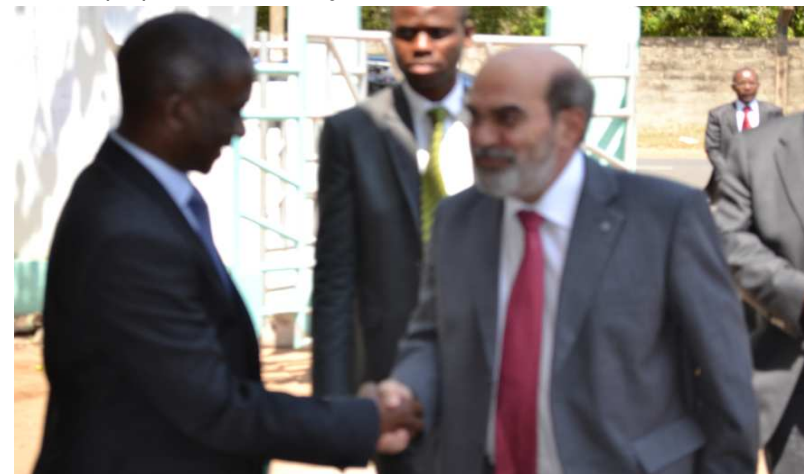
José da Silva (dt), DG FAO invitant le Togo à opter pour la faim zéro

Disons que l'activité aquaculture est dans sa vitesse de croisière par un certain nombre de mesure comme le financement de l'activité par les fonds compétitifs par le financement des sous projets et le fond de garan-