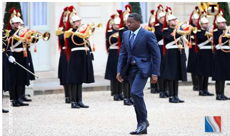
Passage en revue du Président Faure Gnassingbé

que la République française lui a déroulé, Faure Gnassingbé s'est d'abord rendu en Bretagne où il a visité le chantier naval Raidco marine à Lorient où sont actuellement construites les deux vedettes de surveillance et d'interception commandées par la marine togolaise.