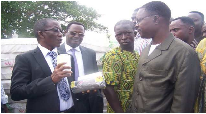
Le ministre Agadazi remettant du matériel aux pêcheurs

Au moment où la rentrée scolaire oscille entre effectivité et réclamation, la rentrée des pêcheurs du lac Nangbéto le 15 novembre dernier après une période biologique de repos marque un tournant décisif dans l'application des mesures retenues dans le plan de gestion des pêcheries dans ce barrage. Ces mesures qui se résument par l'interdiction de l'utilisation des filets de pêche de mailles étirées inférieures à 7,5 cm et qui vise le repeuplement du barrage en poisson a fait l'objet de remise officielle de 2000 nappes de filets de 7,5 de mailles étirées et 8000 bobines de fil pour filet aux profit des pêcheurs du lac Nangbéto. Cette cérémonie présidée par le ministre de l'agriculture de l'élevage et de la pêche, le colonel Ouro Koura Agadazi a eu pour cadre la cité du lac Nangbéto et marque la fin de la période de sensibilisation et le début de l'application des mesures devant conduire à la conservation et à l'utilisation durable des ressources halieutiques du lac.