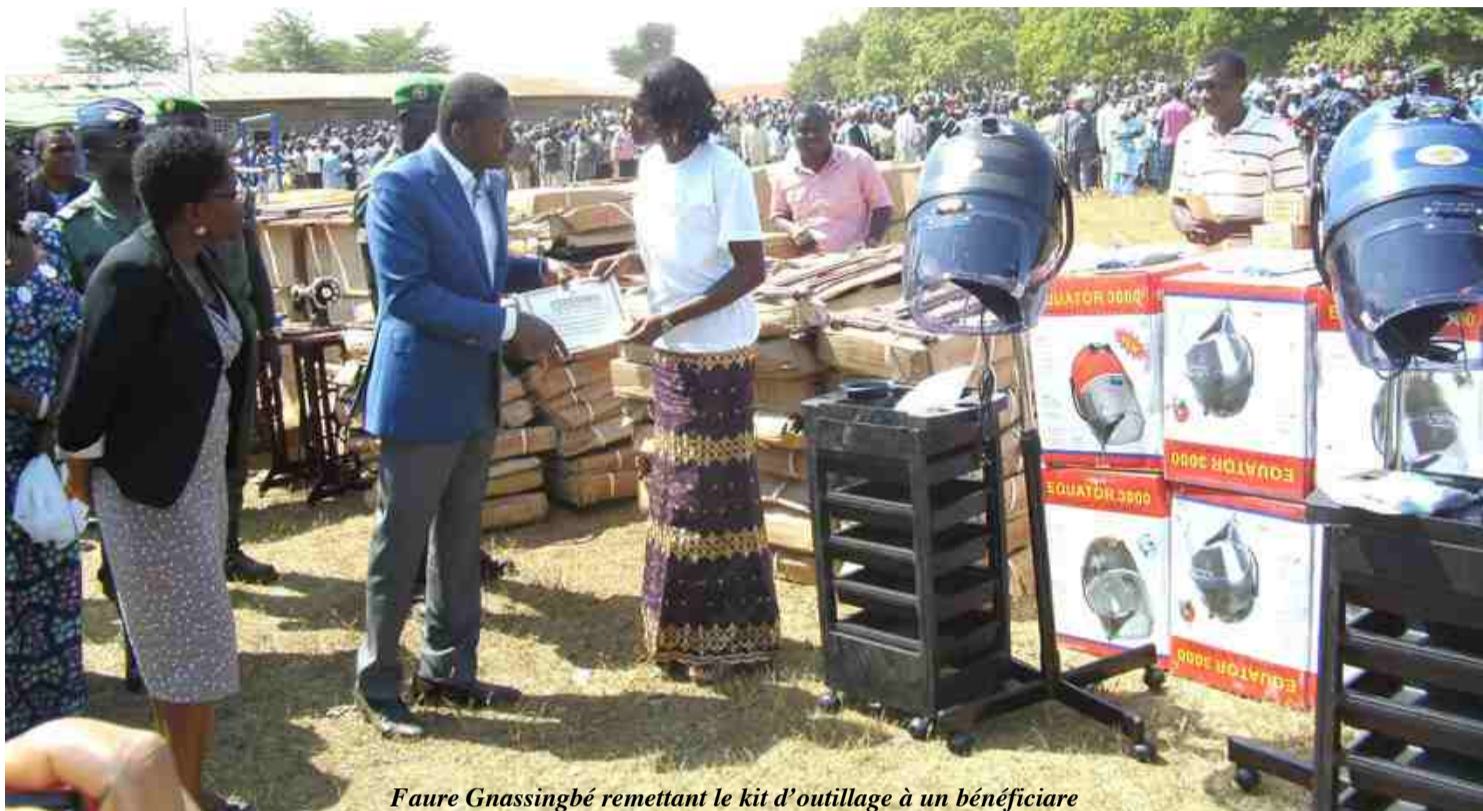
Faure Gnassingbé remettant le kit d'outillage à un bénéficiaire