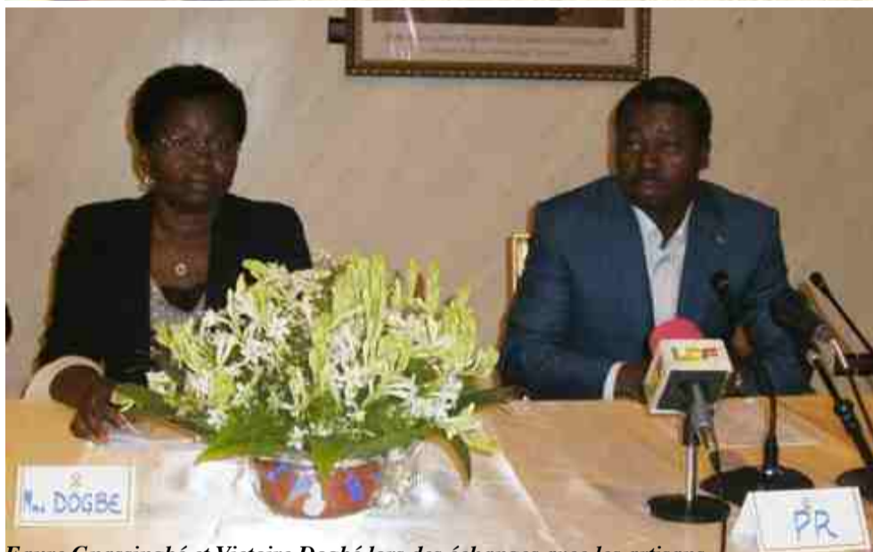
Faure Gnassingbé et Victoire Dogbé lors des échanges avec les artisans

Les artisans étaient à l'honneur le samedi 30 novembre dernier. 700 d'entre eux ont, dans le cadre du Projet d'Appui à l'Insertion Socioprofessionnelle des Jeunes Artisans (PAISJA), reçu leur kits d'outillages destinés à faciliter leur insertion socioprofessionnelle. La cérémonie qui a pris l'allure d'une grande célébration festive, a eu lieu sur le terrain du Lycée de Blitta, et a été présidée par le Chef de l'Etat, Faure Essozimna GNASSINGBE, en présence des membres du gouvernement, des députés à l'Assemblée nationale, des représentants des organisations internationales et des partenaires techniques et financiers. L'ambiance qui était celle des grands jours a été marquée par des moments forts, tels l'entretien avec les représentants d'ouvriers et la remise des kits à un échantillon d'artisans.