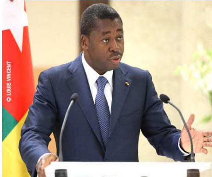
Faure Gnassingbé, répondant aux vœux du corps diplomatique présentés par...