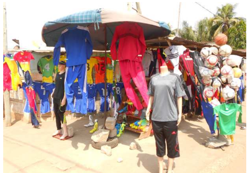
Vue partielle des équipements de Boris Shop