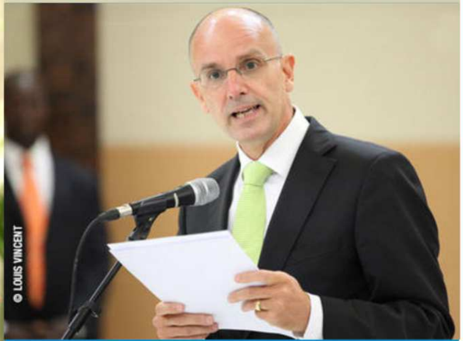
Joseph Weiss, Ambassadeur d'Allemagne au Togo, doyen du corps diplomatique