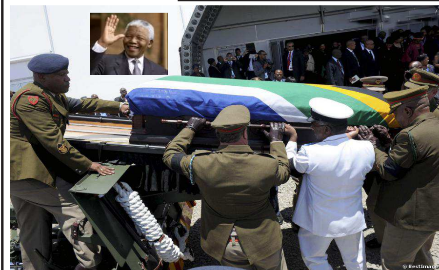
«Saint» Mandela, porté sous terre: même les dieux meurent!