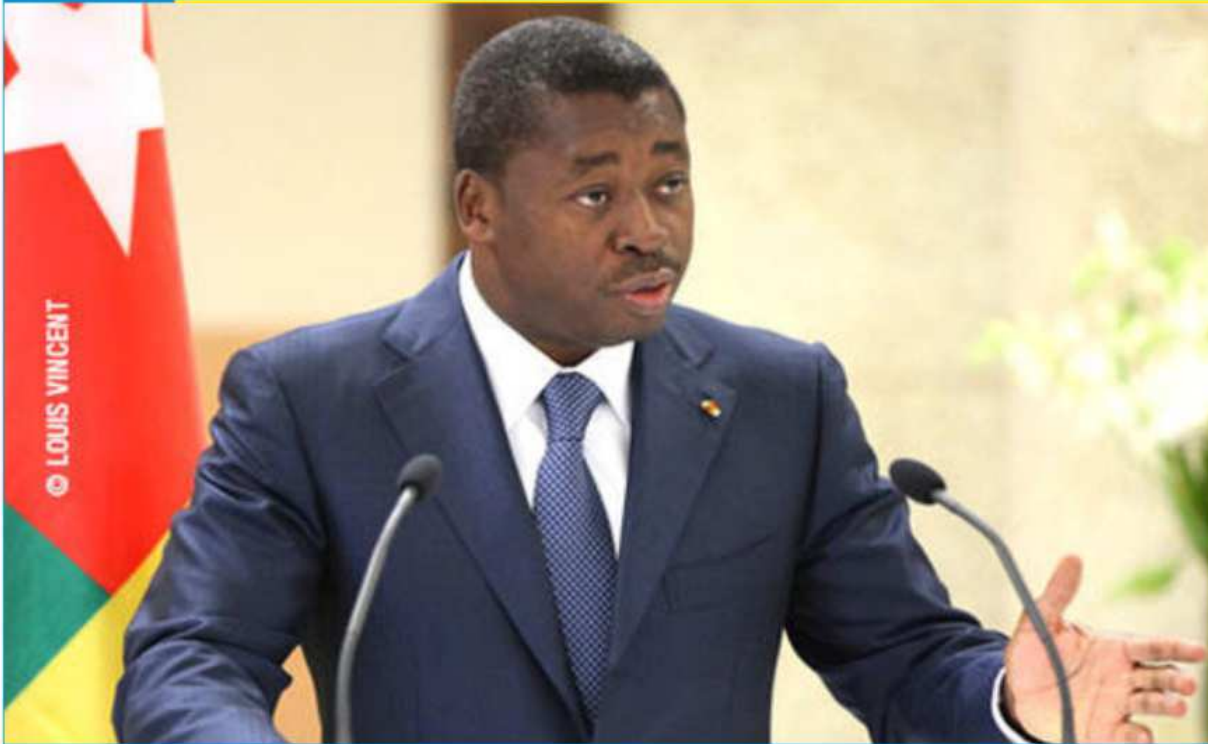
Faure Gnassingbé, répondant aux vœux du corps diplomatique présentés par...