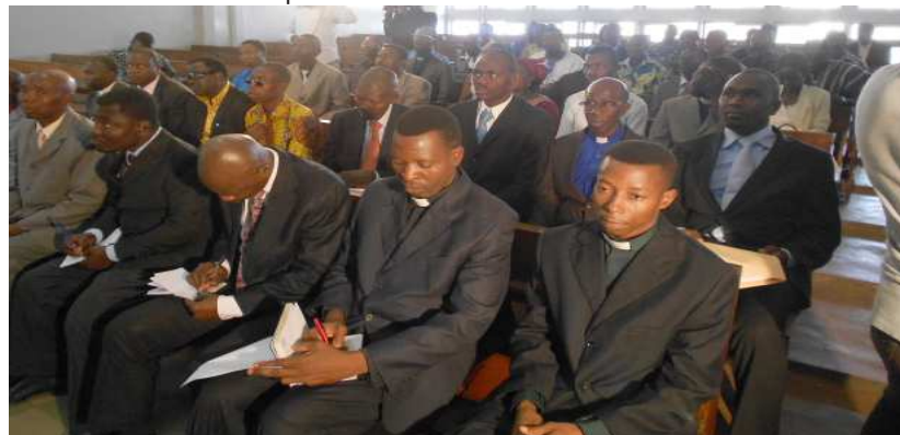
Vue partielle des participants

recommandations, pour permettre à l'OTE, soutenu par l'autorité publique, d'orienter avec beaucoup plus de méthode et de détermination sa mission. Cette rencontre a également permis de renforcer davantage les liens de solidarité et d'union entre les pasteurs participants. Vivement que l'OTE ote de la bonne semence l'ivraie qui gangrène et salit la maison du Christ.