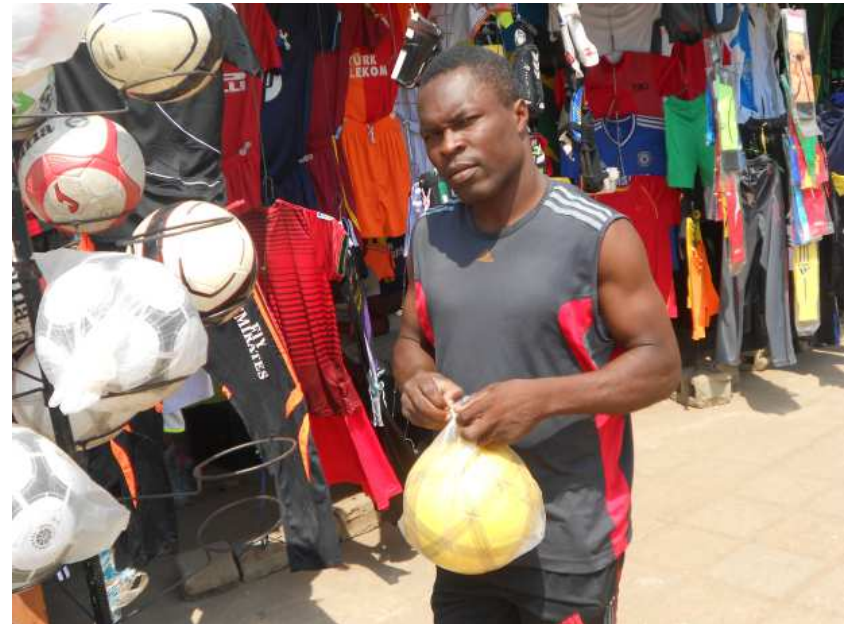
Bobo servant un client venu acheter un ballon