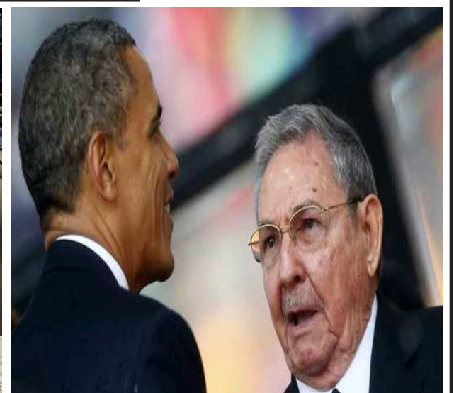
Funérailles de Mandela: poignée de mains historique Obama-Raul Castro, président de deux Etats ennemis jurés