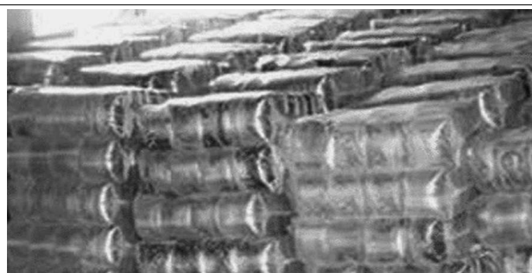
Des sachets d'eau de "Pure water" tassés

Sur les emballages plastiques des certaines eaux de boisson sont inscrits "pure water" pourtant toutes ne le sont pas toujours. Certaines de ces eaux commercialisées au Togo ont des goûts et des odeurs bizarres.