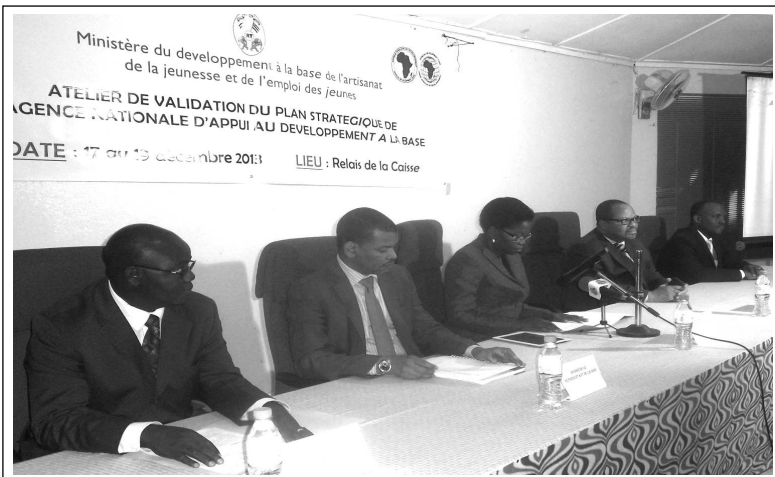
La table lors de l'atelier de validation du plan stratégique de l'ANADEB

Les outils de gestion (Plan stratégique, manuel des procédures administratives, comptables, financières et manuel de suivi évaluation) de l'Agence Nationale d'Appui au Développement à la Base, ont été validés lors d'un atelier qui s'est déroulé du 17 au 19 décembre dernier à Lomé. Ouvrant les travaux, la ministre du Développement à la Base, de l'Artisanat, de la Jeunesse et de l'Emploi des Jeunes, Mme Tomégah-Dogbé s'est réjouie de la présence des acteurs de différents services ministériels qui marque une volonté partagée d'œuvrer en synergie pour réali-