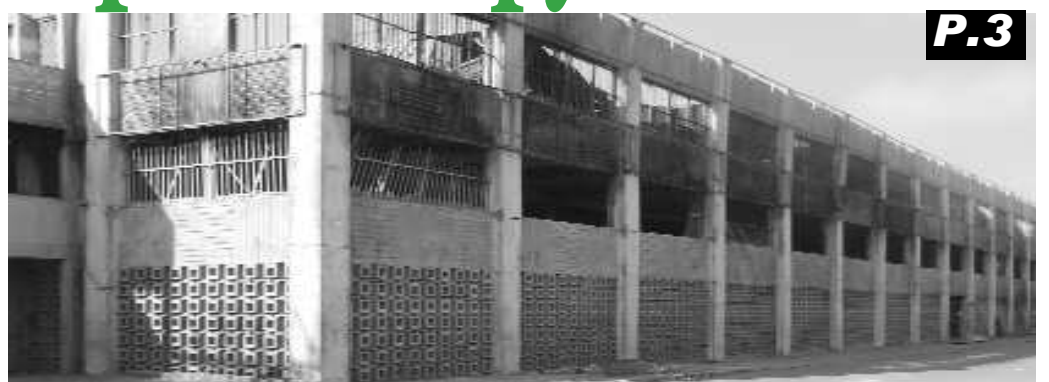
Les ruines du bâtiment central du Grand marché de Lomé