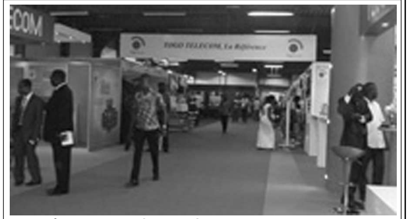
L'entrée du stand du Sponsor Officiel de la Foire, Togo Telecom

Togo Telecom de disposer d'un réseau entièrement numérique en Fibre Optique, qui couvre 90% du territoire national, et permet d'augmenter les capacités du groupe à offrir un grand nombre de services.