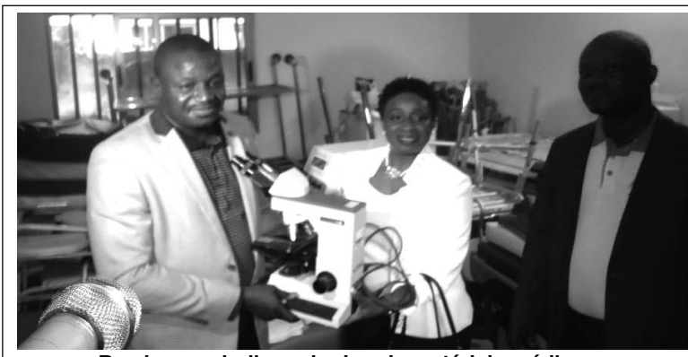
Remise symbolique du don de matériels médicaux

La Fondation Gnassingbé Eyadéma pour l'Education et la Santé (FOGEEES) a bénéficié d'un don de matériels médicaux d'une ONG américaine dénommée Jardin d' Eden. La cérémonie de remise officielle de ce don d'un montant estimé à de 30.000 dollars (15 millions de FCFA) s'est déroulée au siège de cette fondation à Tokoin Doumassé à Lomé le 20 décembre 2013.