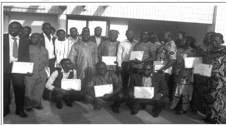
Photo de famille des participants à la formation

Ce renforcement de capacités des médias leur permettra de: - contribuer à l'atteinte de l'ob-