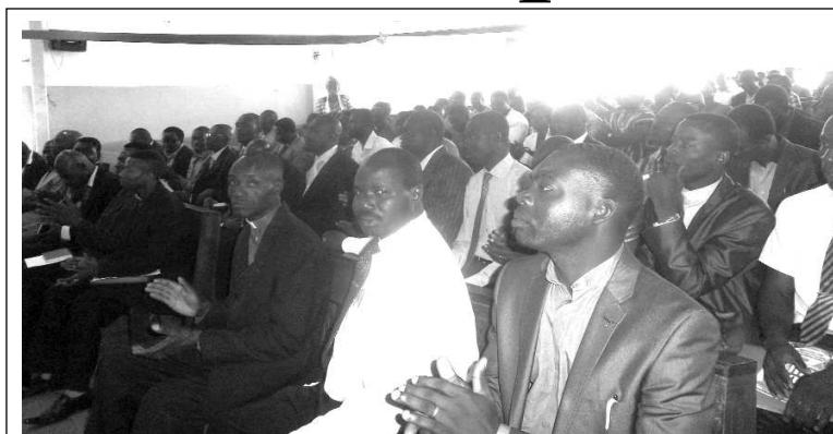
Vue partielle de l'assistance lors de la conférence

La liberté de religions instituée par la Loi fondamentale a engendré un foisonnement d'Eglises dont les conséquences, à la limite, échapperaient au contrôle de l'autorité publique. Les hommes de Dieu, sous d'au-