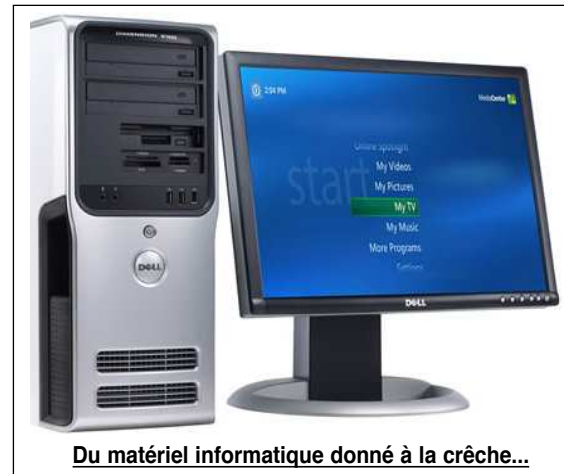
Du matériel informatique donné à la crèche...