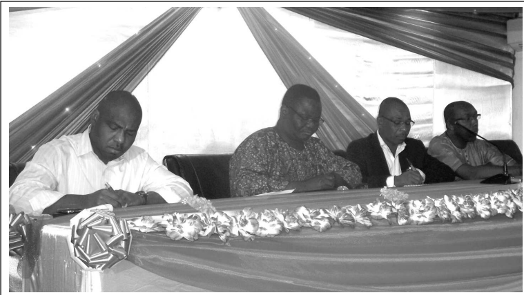
La table lors de la conférence

La 11ème édition de la Foire internationale de Lomé a été une occasion pour les entreprises de déployer toute leur artillerie afin de capter l'attention des visiteurs. Le 14 décembre dernier, au cours de la journée TOGO TELECOM, le sponsor officiel de la Foire n'a pas ménagé ses efforts pour démontrer ses visages de plus en plus exigeante et diversifiée. Retour sur cette journée riche en activités.