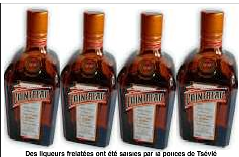
Des liqueurs frelatées ont été saisies par la police de Tsévié

Dans la plupart de nos villes, les revendeuses de denrée alimentaires n'observent pas toujours les règles d'hygiène. Ce qui expose dangereusement les consommateurs aux risques de maladie. Un autre phénomène pend de l'ampleur depuis plusieurs années : la vente de pro-