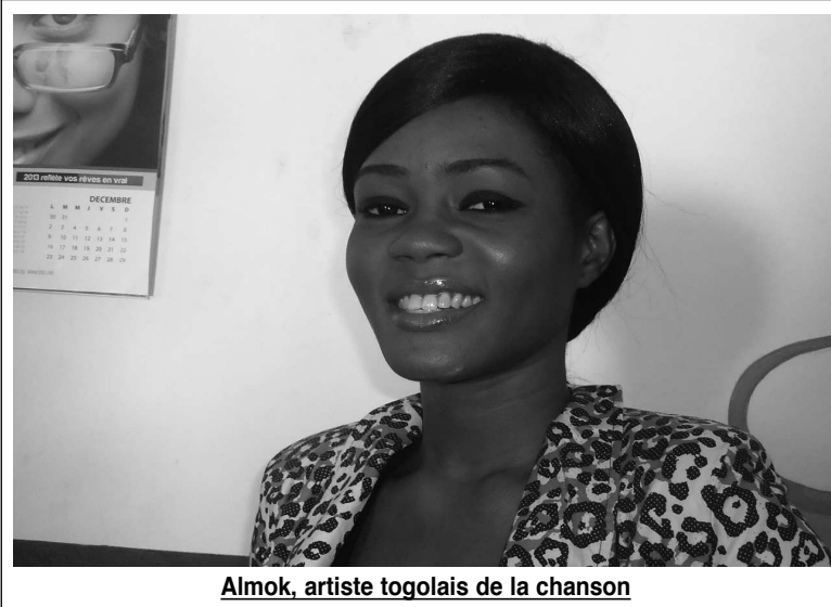
Almok, artiste togolais de la chanson

Bien sûr. Quand tu es choisi ou quand on te remet des prix, c'est dire que tu dois travailler plus que tu ne le faisais. Si tu fournissais 50% de travail, tu es