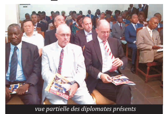
vue partielle des diplomates présents

Les grands rendez-vous internationaux auxquels a pris part le Togo sont évoqués en