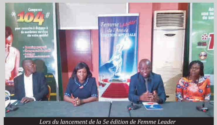
Lors du lancement de la 5e édition de Femme Leader

Les trophées femmes leader qui depuis 5 ans récompensent les femmes d'exception et de mérite, aura lieu cette année mais sous une autre forme. En lieu et place du vote pour choisir la femme leader parmi les nominées, le comité d'organisation a choisi de décerner plutôt des distinctions honorifiques à des leaders africaines et de reconnaissance aux ONG et institution qui œuvrent pour l'épanouissement de la jeune fille et le leader féminin au Togo. Les organisateurs rassurent tout de même que le concours reviendra sous sa forme classique en 2015. L'association LACOM.TG qui organise l'événement entend l'élargir à l'échelle sous régionale notamment au sein de l'UEMOA. Tous les détails ont été fournis le 10 janvier dernier lors de la conférence de presse du lancement de la 5e édition. Il est prévu pour cette édition, des émissions télé inédites et une cérémonie spéciale lors de la célébration du 8 mars journée internationale de la femme.