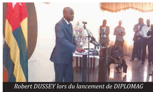
Robert DUSSEY lors du lancement de DIPLOMAG

C'est un magazine de quarante pages qui se propose tous les trimestres, de procéder tous les trois mois à des analyses et réflexions sur la diplomatie togolaise, une manière de rendre visible les actions diplomatiques du Togo à travers le chef de l'Etat. Edité à 2500 exemplaires, ce nouveau magazine est officiellement lancé lundi dernier par le Ministre des Affaires Etrangères et de la Coopération M Robert DUSSEY. C'était en présence de plusieurs diplomates accrédités au Togo. Dans sa préface paru dans le premier numéro du magazine, le Ministre Robert DUSSEY appelle les diplomates togolais à « s'adapter à l'évolution rapide de la pratique