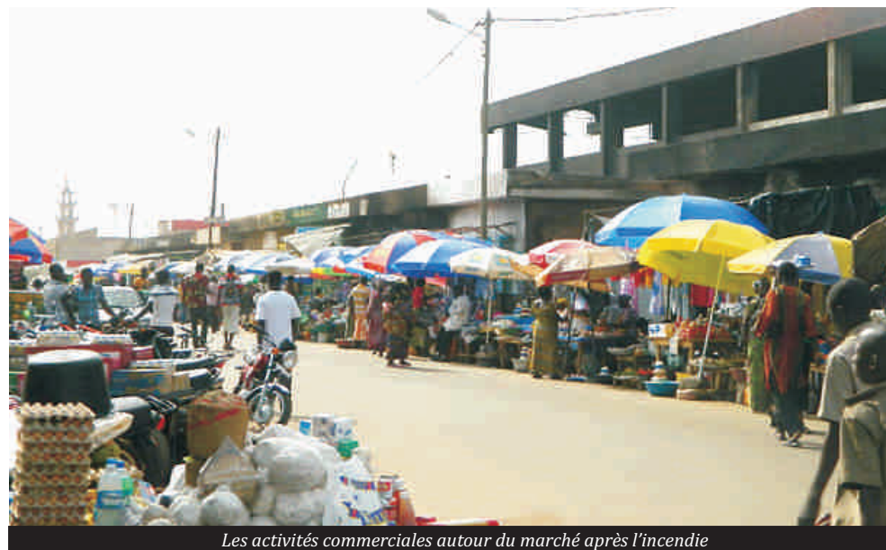
Les activités commerciales autour du marché après l'incendie