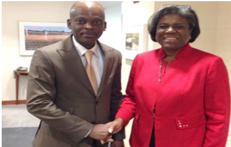
Robert Dussey (g) et Linda Thomas-Greenfield (dt)

multiples efforts que le Togo fournit en matière de lutte contre le trafic de la faune et contre la criminalité transnationale.