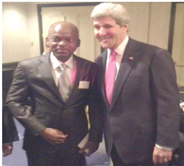
Robert Dussey (g) et John Kerry (dt)

La pertinence des sujets évoqués par Robert Dussey et John Kerry ont motivé ce dernier à passer un coup de fil au Président Togolais afin de le féliciter pour les