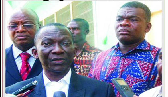
Col. Ouro-Koura Agadazi, ministre de l'Agriculture, de l'Elevage et la Pêche

Accroître la production cotonnière au Togo : Atelier pour mettre en œuvre la vision stratégique de la filière P.6