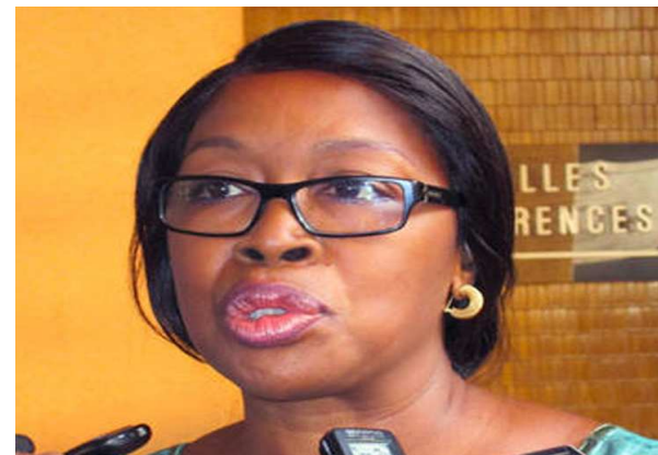
Khadiata Lo Ndiaye, Coordinatrice du Système des Nations Unies

Pour le ministre de la Prospective et de l'Evaluation des politiques publiques, Kako Nubukpo, le document s'inscrit dans la droite ligne de la Stratégie de croissance accélérée