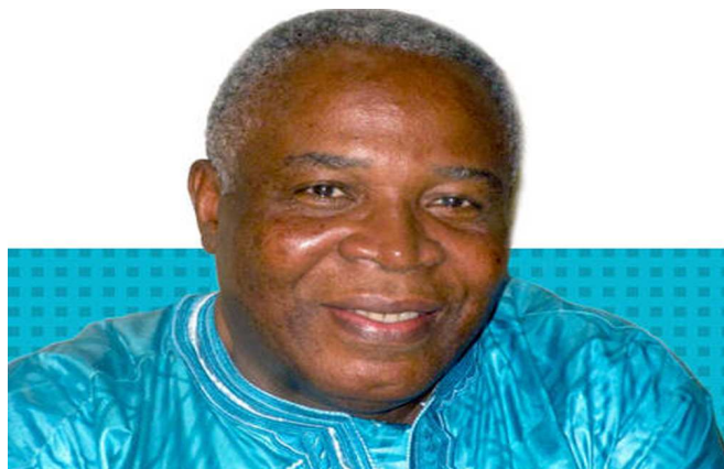
André Johnson, ministre de l'Environnement

Il en est de même pour le problème des espèces en voie de disparition. Les feux de brousses, les trafics, la chasse et la pêche intensive font qu'aujourd'hui, on ne retrouve plus certains espèces d'animaux qui, n'ont