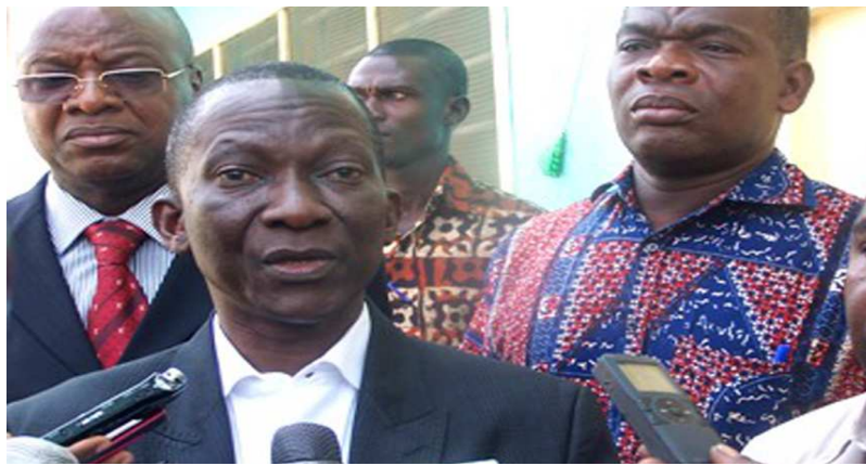
Col. Ouro-Koura Agadazi, ministre de l'Agriculture, de l'Élevage et la Pêche

Selon le ministre Agadazi, la filière cotonnière est une culture straté-