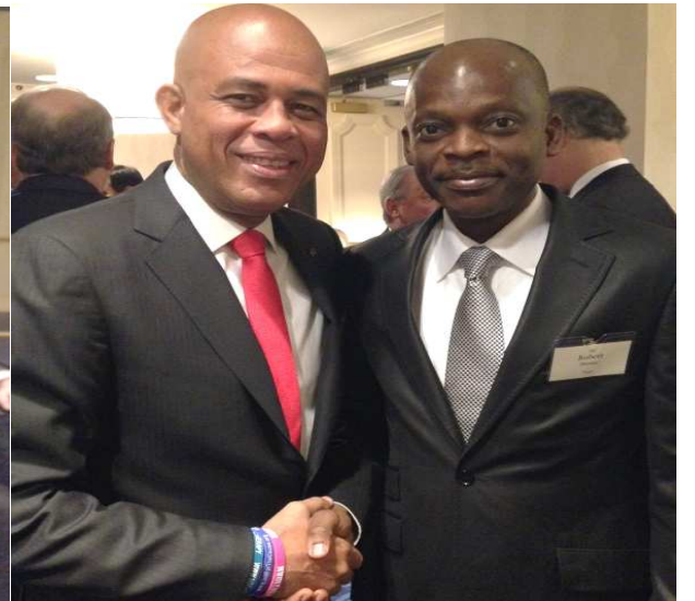
Robert Dussey (dt) et Michel Martelly (g)