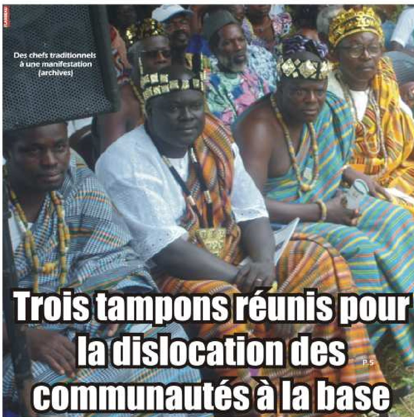
Des chefs traditionnels à une manifestation

Trois tampons réunis pour la dislocation des communautés à la base P.5