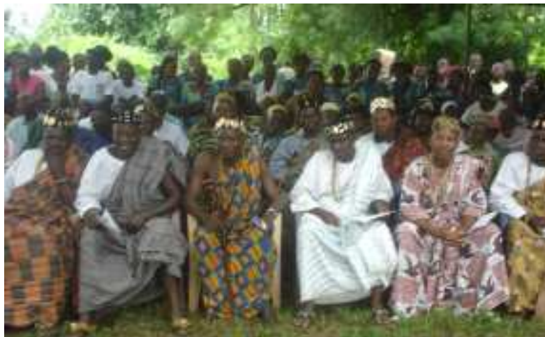
Des chefs traditionnels à une manifestation (archives)

service du cadastre à qui revient la détermination du plan et du lotissement n'a non plus le pouvoir de contrôle. Conclusion, le phénomène de la double vente, sujet à beaucoup de problèmes, est source de tension entre familles et communautés supposées cultiver l'union et la fraternité pour l'atteinte des objectifs du développement prônés par le Chef de l'Etat. L'autre arnaque qui se développe et qui désormais est en vogue dans ces litiges fonciers demeure ce réseau d'huissiers, de propriétaires terriens véreux et de patriarches qui se chargent de prospecter certaines maisons et ensuite, de trouver les moyens d'en exclure