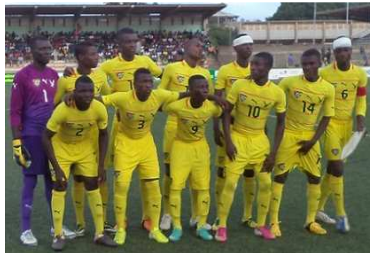
Les Eperviers du Togo