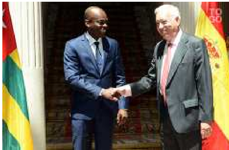
Poignée de mains entre Robert Dussey et Jesus Posada

mier jour de sa visite, Robert Dussey a animé une Conférence à RI Elcano autour du sujet : « Les défis de la Sécurité maritime au Golfe de Guinée ». Peu après cette conférence, Robert Dussey a été reçu au Congrès des Députés, siège du parlement Espagnol, par D. Jesus Posada, Président du Congrès