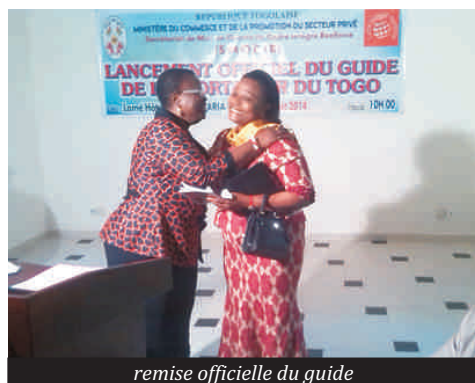
remise officielle du guide

Les exportateurs togolais disposent désormais d'un guide. Son exploitation a été officiellement lancée vendredi dernier au cours d'une cérémonie présidée par la Ministre du commerce et de la promotion du secteur privé, Mme Bernadette LEGEZIM-BALOUKI. C'est un document de 46 pages qualifié d'outil précieux de renseignements sur les dispositions techniques et réglementaires en matière d'exportation des produits de service. Le document a été mis à la disposition des opérateurs économiques présents lors de la cérémonie. Ceux-ci peuvent trouver d'utiles informations sur les marchés d'exportation au plan national, régional,