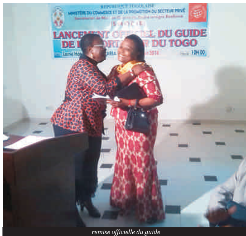
remise officielle du guide

Les exportateurs togolais disposent désormais d'un guide. Son exploitation a été officiellement lancée vendredi dernier au cours d'une cérémonie présidée par la Ministre du commerce et de la promotion du secteur privé, Mme Bernadette LEGEZIM-BALOUKI. C'est un document de 46 pages qualifié d'outil précieux de renseignements sur les dispositions techniques et réglementaires en matière d'exportation des produits de service. Le document a été mis à la disposition des opérateurs économiques présents lors de la cérémonie. Ceux-ci peuvent trouver d'utiles informations sur les marchés d'exportation au plan national, régional, et à l'échelle internationale. La ministre du commerce a convié