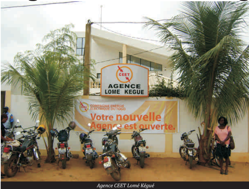
Agence CEET Lomé Kégué