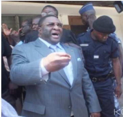
L'ancien ministre Pascal Bodjona

vers une direction pour le moment inconnu de ses avocats. C'est dans une voiture conduite par le capitaine Akakpo, que l'ancien fidèle collaborateur de Faure Gnassingbé a été amené du tribunal.