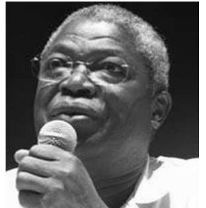
Kofi Yamgnane, Pdt de Sursaut-Togo

Depuis quelques temps, les candidats à la présidentielle du 1er trimestre 2015 se bousculent. Parmi ces prétendants au poste de Président de la République, se trouve en bonne place le plus français des Togolais Kofi, Yamgnane.