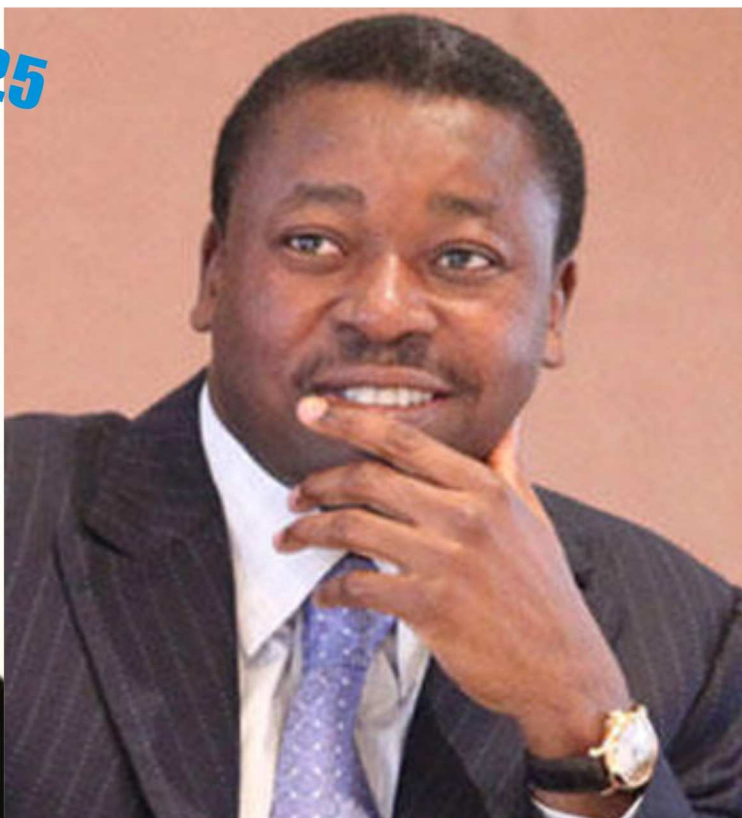
Faure Gnassingbé, Président de la République togolaise

Affaire "d'escroquerie internationale" :