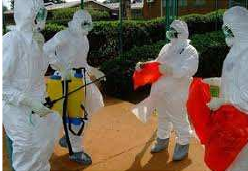
Des médecins prêts à entrer en contact avec les patients

Pour atténuer l'impact des sévères mesures de quarantaine instaurées dans les zones les plus touchées aux confins de la Guinée, du Libéria et de la Sierra Leone, l'OMS travaille avec le Programme alimentaire mondiale (PAM), qui a entrepris d'acheminer de l'aide au million d'habitants concernés. La Banque africaine de développement (BAD) a pour sa part annoncé une aide de 60 millions de dollars (45 millions