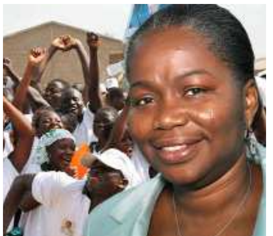
La ministre Victoire Tomégah-Dogbé

L'un des dangers qui guette sérieusement la planète et en particulier les pays africains est le sous emplois et le chômage des jeunes qui représentent plus de la moitié de la population mondiale.