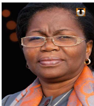
La ministre Victoire Dogbé

127.243 emplois générés, un taux de chômage en baisse P.3&4