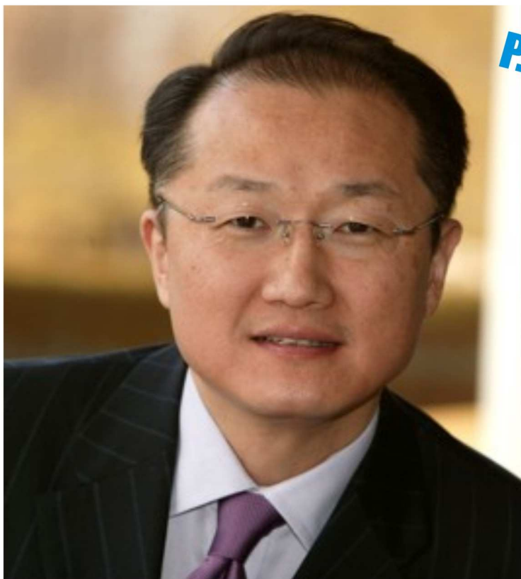
Jim Yong Kim, Président de la Banque Mondiale

Bonne gouvernance et lutte contre la corruption : Le Togo cité en exemple par le Président de la Banque Mondiale