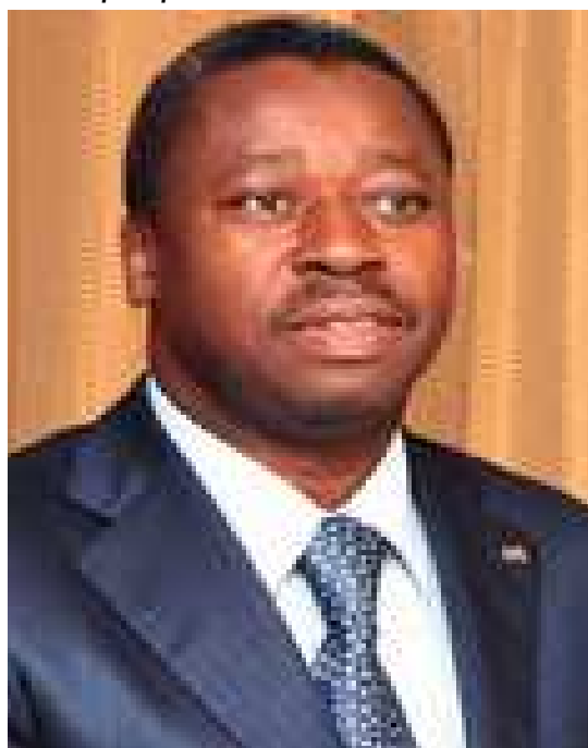
Le Président Faure Gnassingbé