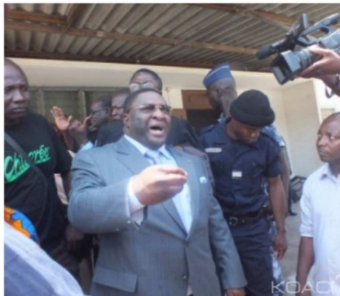
L'ancien ministre Pascal Bodjona

Affaire "d'escroquerie internationale" :