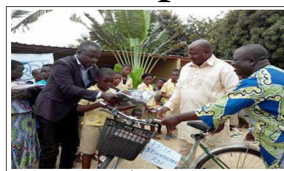
Remise du vélo au 1er du centre

" L'organisation de cette journée de l'excellence s'inscrit dans les objectifs de la RDI-France qui vise à encourager l'excellence chez les élèves et gratifier les