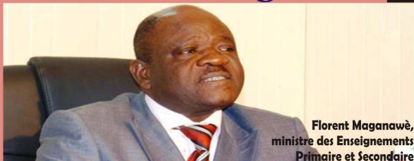
Florent Maganawè, ministre des Enseignements Primaire et Secondaire

L'Education, une priorité de l'Etat togolais P.6