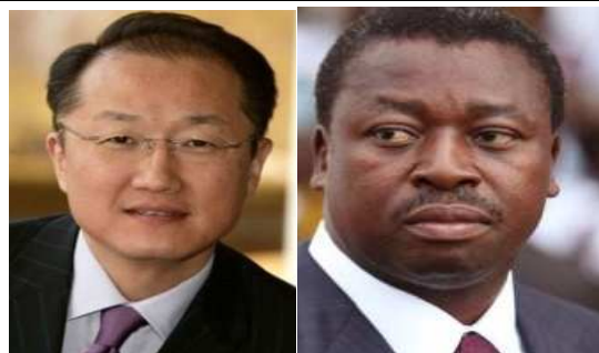
Jim Yong Kim, Président BM / Le Président Faure Gnassingbé

Les efforts entrepris dans divers domaines par les plus hautes autorités togolaises portent déjà leurs fruits. Au plan de la bonne gouvernance et la lutte contre la corruption, notamment dans les dépenses publiques nationales, le pays a atteint, selon la Banque Mondiale, un niveau encourageant dans les réformes en vue de s'approprier ces principes à l'origine de tout développement harmonieux.