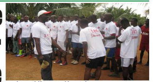
Les athlètes au départ du cross country

Commémoration des 150 ans de la convention de Genève : La Croix-Rouge togolaise marque l'évènement par plusieurs activités à Togoville P.2