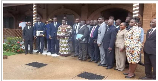
Phot de famille des participants à la rencontre

Un atelier de vulgarisation de la loi anti tabac a été organisé à l'endroit des journalistes, des acteurs de la santé et des importateurs le 26 août 2014 à Agora Senghor à Lomé. Cet atelier fait suite au lancement de la campagne de communication sur les réglementations sur le tabac et ses produits dérivés par la ministre du Commerce et de la Promotion du Secteur Privé, Mme Bernadette Legzim-Balouki.