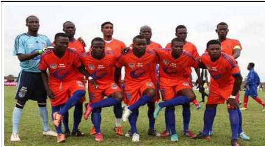
Anges FC de Notsè

Le championnat national de football de première division a connu son dix-neuvième acte le week-end écoulé. Les différentes équipes en lice ont connu des fortunes diverses mais la plus chanceuse reste le champion sortant, Anges de Notsè, qui retrouve son fauteuil de leader après sa victoire, un but à zéro, devant l'AS Douanes mais aussi grâce au verdict de la Commission d'Homologation qui a tranché en sa faveur après le recours l'opposant au club portuaire.