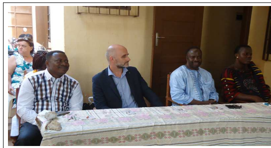
La table des officiels au lancement du projet

" Nous croyons vraiment que les enfants qui sont à la brigade pour mineurs ont besoin du