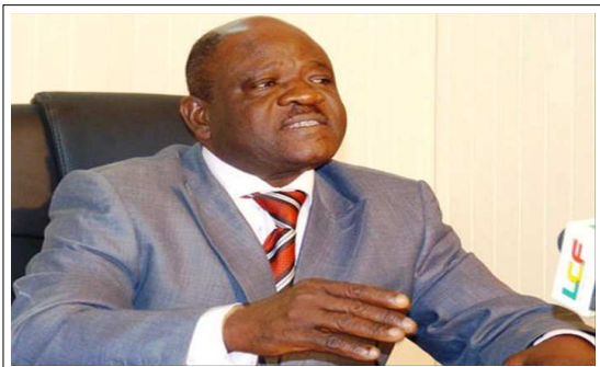
Le ministre Florent Manganawè des Enseignements Primaire et Secondaire

riser le métier d'enseignant et améliorer les conditions de travail et de vie de ce groupe de fonctionnaires. Parmi les efforts du gouvernement, l'on peut énumérer la création des cantines scolaires, la poursuite de la construction des salles de classes, afin de résoudre le problème d'effectifs pléthoriques et améliorer le cadre éducatif, l'élaboration d'une coopérative d'épargne et de crédit pour les enseignants qui sera effective avant la fin de cette année.