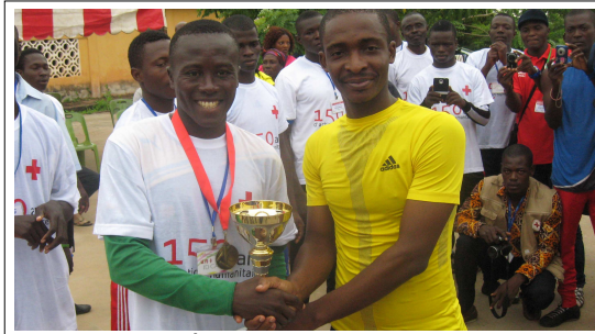
Remise de récompenses aux meilleurs participants

C'était le vendredi 22 août dernier au Centre des aveugles " Kékéli-Néva " de la cité de Togoville. Plusieurs activités étaient au menu de cette manifestation qui a bénéficié du soutien financier du Comité International de la Croix-Rouge