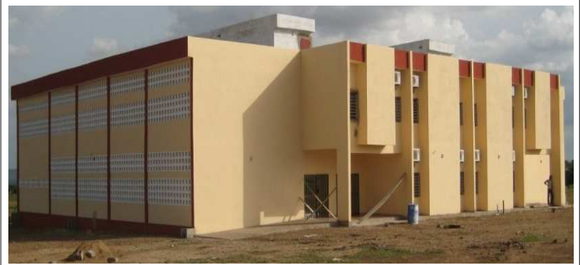
Le bâtiment abritant l'ENI de Dapaong

A ces projets, il faut ajouter les acquis des enseignants, notamment la prime de rentrée qui s'élève à 150 mille francs, 10000 francs comme prime de