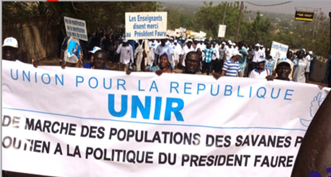
La marche de Vendredi dernier à Dapaong

Des dizaines de milliers de militants derrière UNIR dans la savane