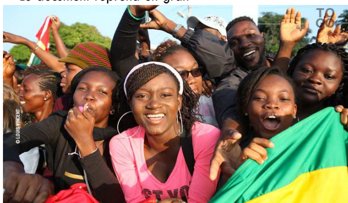
Les Togolais de Dakar ovationnant le président Faure Gnassingbé