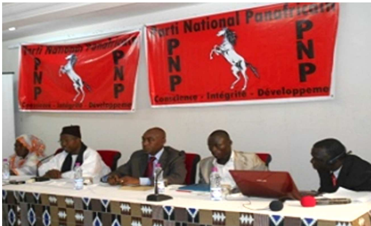
La table d'honneur lors de la rencontre de presse

Le PNP entend contribuer à très court terme à l'alternance au Togo car " c'est l'urgence du