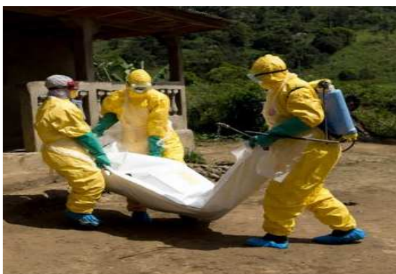
Une victime de plus du virus Ebola

L'organisation mondiale de la santé estime que 6 928 personnes sont décédées, principalement au Sierra Leone, Guinée Conakry et Liberia, les trois pays les plus touchés par l'épidémie.