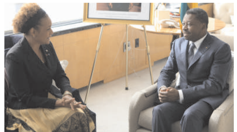
Mme Michaëlle Jean reçue en audience à New York par Faure

L'ancienne Gouverneure générale du Canada et actuelle Présidente d'honneur de l'Université d'Ottawa, Michaëlle Jean a été désignée, par consensus par les Chefs d'Etats et de Gouvernements, pour succéder à Abdou Diouf étant que nouvelle Secrétaire Générale de l'Organisation Internationale de la Francophonie (OIF).