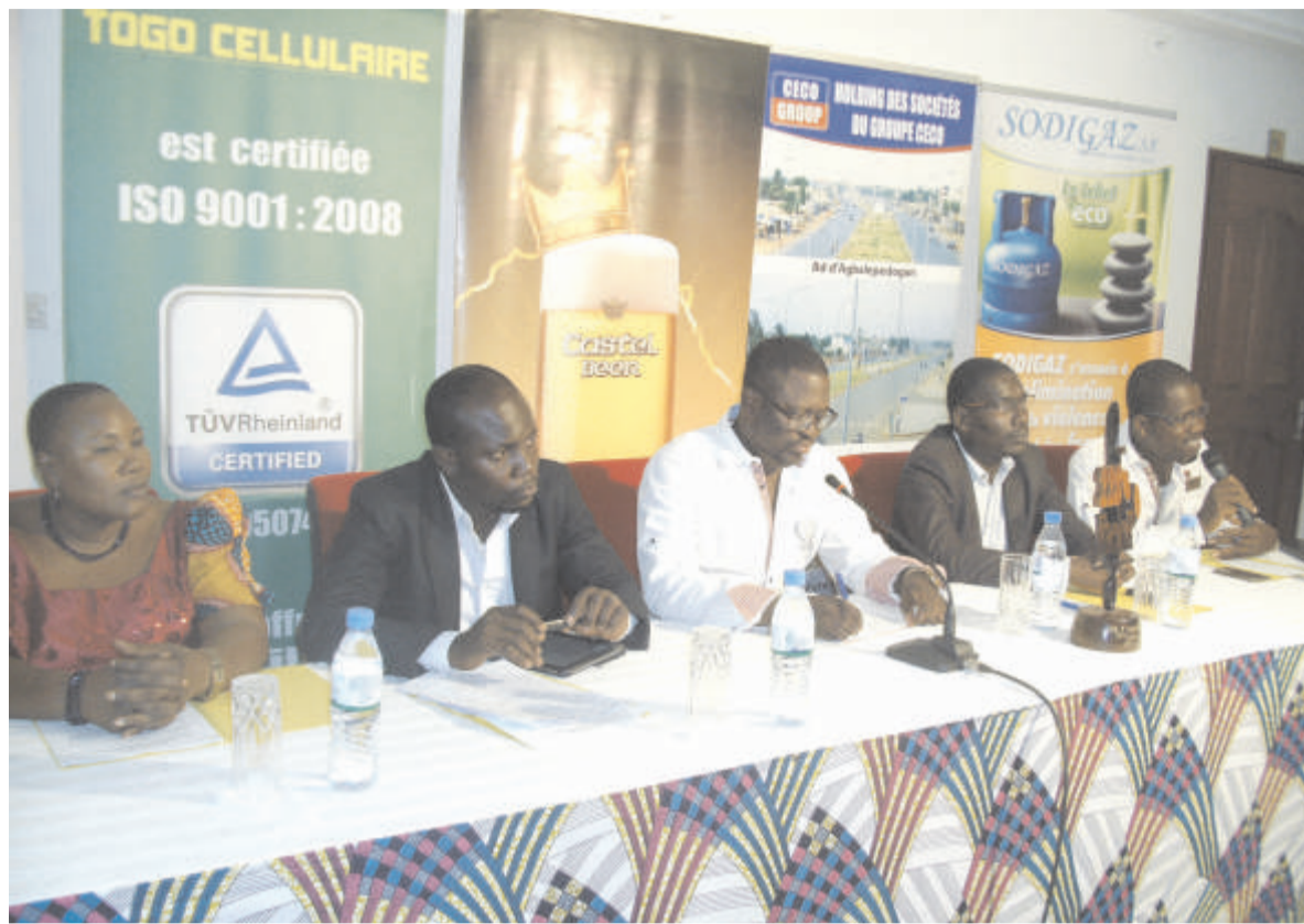
L'équipe de production