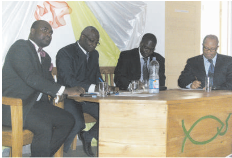
Les responsables de la fondation PISCARE

La Fondation PISCARE contribue à faire vivre et développer le patrimoine de réflexion et d'expériences accumulées au Togo par les luttes sociales et les mouvements d'idées. Elle va apporter sa pierre au développement des échanges et rencontres permettant de favoriser l'élaboration de propositions utiles à une construction nationale de progrès social, économique, démocratique et culturel. Aussi, va-t-elle entretenir des échanges susceptibles d'aider l'action des personnes et des forces sociales qui inscrivent leur réflexion et leur engagement dans la perspective d'un développement citoyen et social. La Fondation PISCARE va également œuvrer au travail de mémoire, liant la conservation et l'exploitation scientifique d'archives relatives à son objet, à l'incitation et l'aide à tous travaux de recherche et de formation,