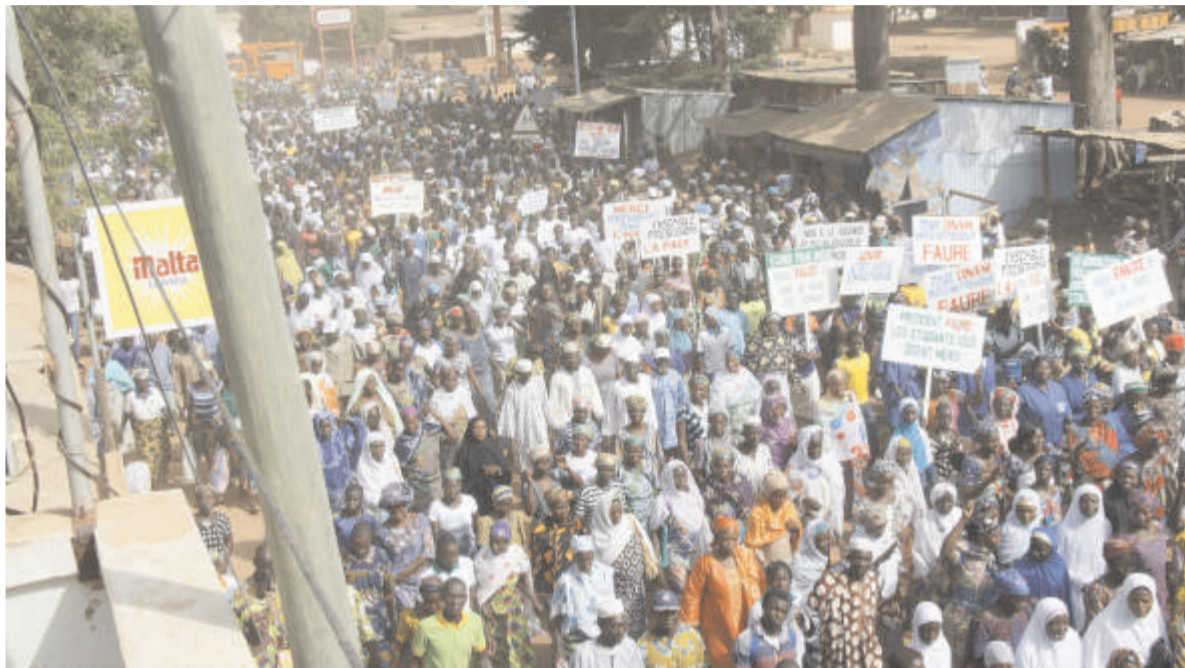
Les manifestants dans les rues de Dapaong

« Faure Gnassingbé d'être... candidat à la prochaine élection présidentielle, afin de parachever l'œuvre de reconstruction du Togo qu'il a entamée et qu'il conduit avec doigté »