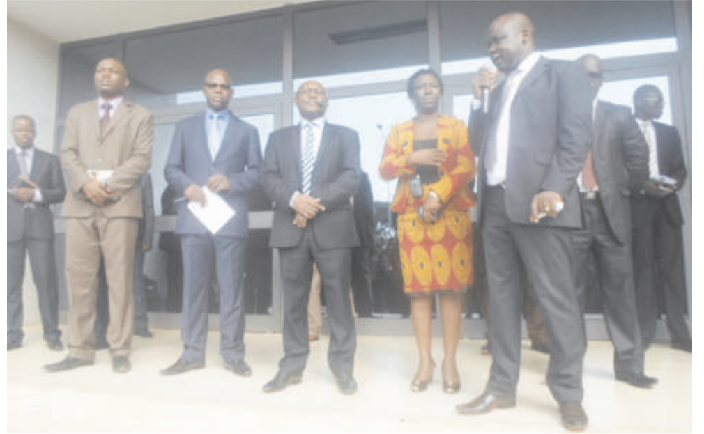
Les premiers responsables de l'OTR