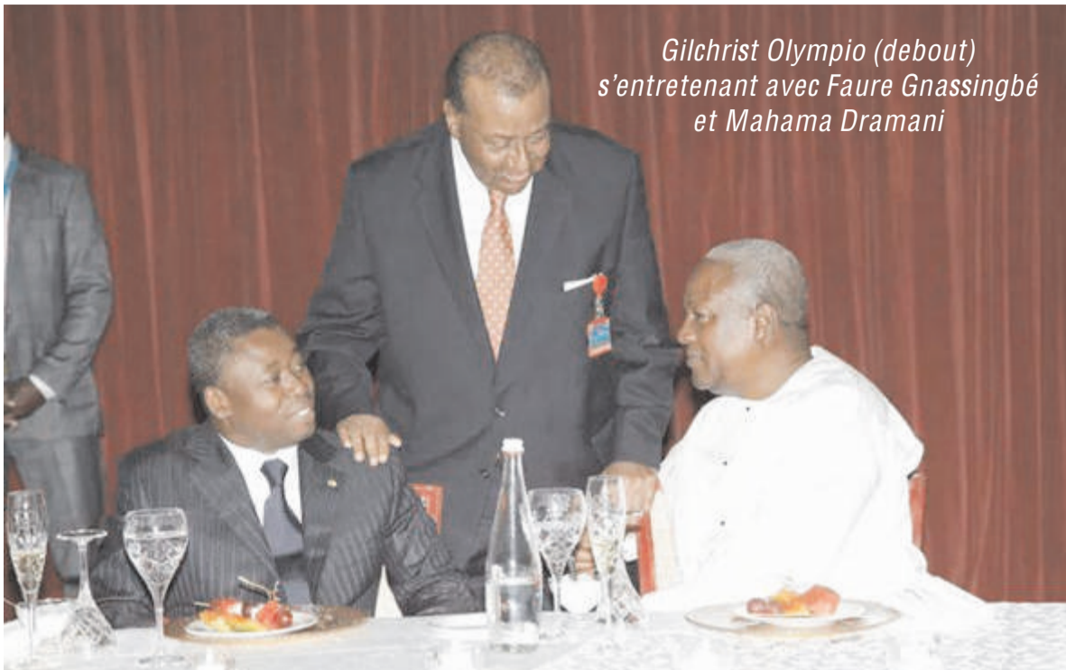
Gilchrist Olympio (debout) s'entretenant avec Faure Gnassingbé et Mahama Dramani

Le président national de l'Union des Forces de Changement (UFC), Gilchrist Olympio était à Accra aux côtés du Président Faure GNASSINGBE qui était en visite de travail de trois jours avec son homologue Mahama DRAMANI. Une présence très appréciée des hôtes ghanéens. A ce propos, le Président Faure GNASSINGBE déclare : « Je pense que sa présence ici est l'un des symboles de la réconciliation qui est en cours au Togo. Mais cette réconciliation et ce symbole ont une racine, une fondation qui est le progrès démocratique, le progrès dans la construction et la consolidation d'un Etat de droit. C'est aussi cet état de fait qui nous a permis d'aller vers la normalisation de nos relations avec le Ghana parce que nous partageons les mêmes principes de démocratie et de liberté avec ce pays »