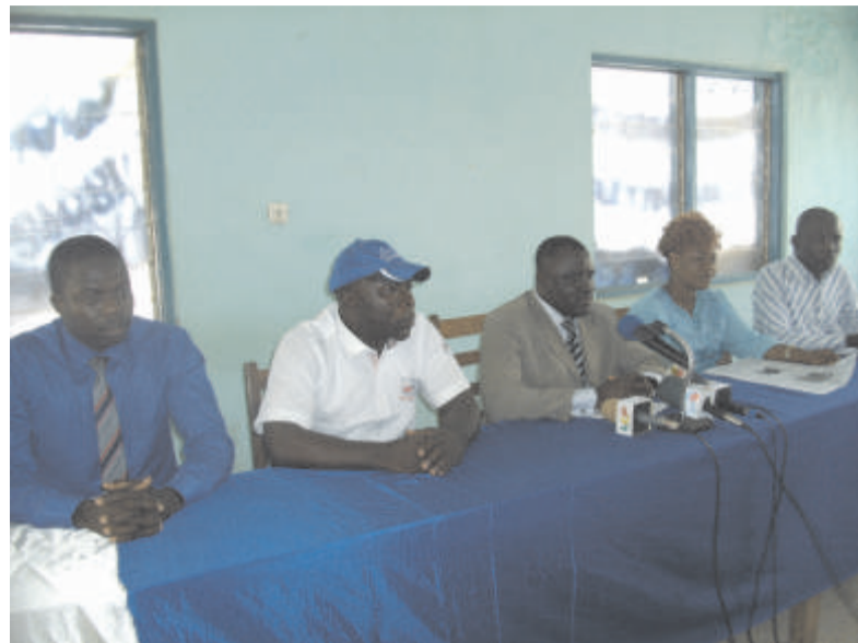
La table officielle lors du point de presse

Les leçons de la Majorité Silencieuse à l'opposition togolaise « SAUVER LE TOGO, C'EST DEFENDRE ET SE SOUMETTRE SANS CONDITIONS AUX LOIS DE LA REPUBLIQUE »