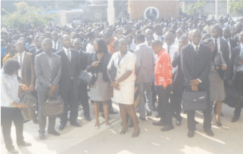
Vue partielle des 529 nouveaux agents