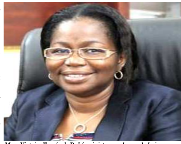
Mme Victoire Tomégah-Dogbé, ministre en charge de la jeunesse

dans notre pays, c'est que nous sommes allés de manière progressive, mais de manière très soutenue. Nous avons impliqué la société civile dans le suivi et l'évaluation des volontaires, puisque nous avons réussi à régionaliser ce programme", a précisé Mme Tomégah-Dogbé.