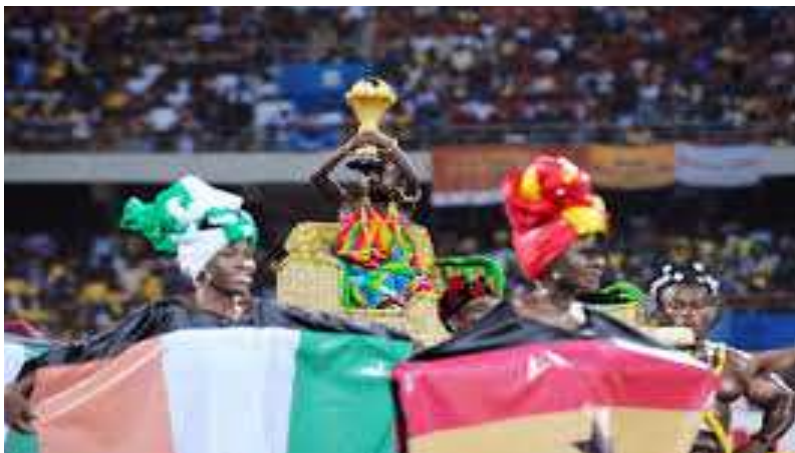
Le trophée de la CAN 2015

la clémence du tirage en se classant dans un groupe largement à sa portée si les Guinéens ont gardé leur forme éblouissante qu'on leur avait connu en 2012 lors de la CAN qu'ils avaient co-organisés avec le Gabon. Et justement ce dernier se retrouve aussi dans cette poule avec le vice-champion en titre : les étalons du Burkina et le Congo Brazzaville, équipe surprise de la compétition qui s'est qualifiée au bénéfice du meilleur troisième des groupes qualificatifs.