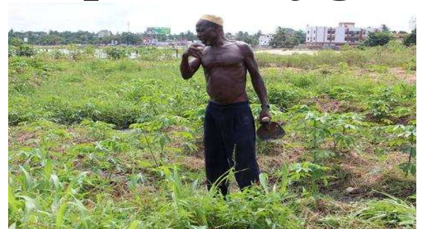
Un agriculteur dans son champs dans la plaine de Djagblé

dans la zone, elle sera à terme complètement désenclavée à travers la construction d'infrastructures.