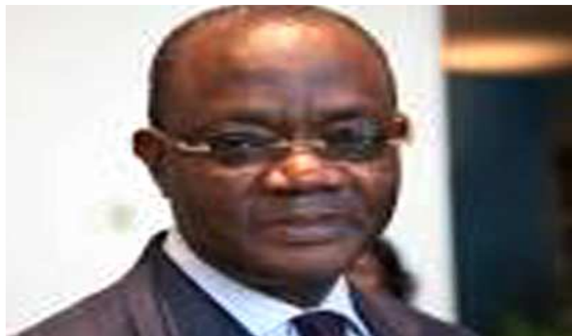
Koffi Esaw, Garde des Sceaux, ministre de la Justice

Cette cérémonie se déroulera à l'occasion de la Journée internationale des droits de l'homme. A cette occasion, des écoliers de certaines établissements publics et privés liront les articles de la Déclaration universelle des droits de l'homme suivie d'une lancée de ballons aux couleurs du Togo et de l'UE.