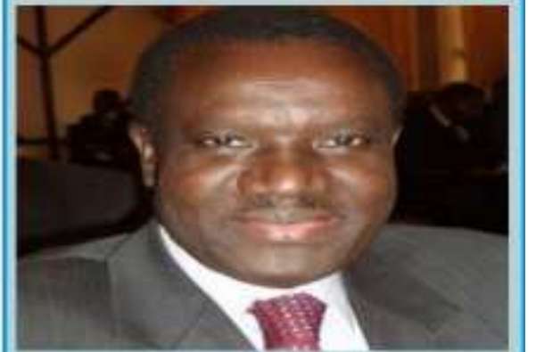
Kadré Désiré Ouédraogo, président de la Commission de la CEDEAO

CEDEAO / RÉUNIONS DE FIN D'ANNEE : Le rapport 2014 et l'élection du président en exercice 2015 au programme