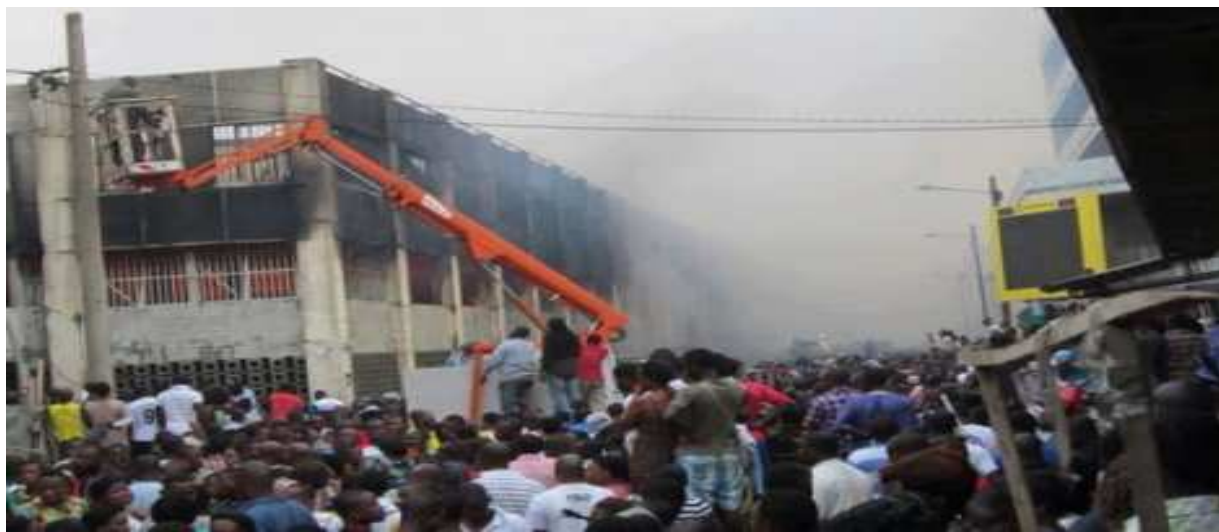
Le bâtiment central du Grand marché de Lomé embrasé par les flammes

Au moment où de braves commerçantes s'étaient effondrées parce que constatant sans force leurs étalages et