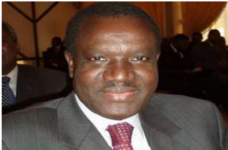
Kadré Désiré Ouédraogo, président de la Commission de la CEDEAO

L'autre importante réunion regroupera, le vendredi 12 décembre,