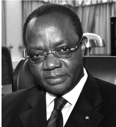
Koffi Esaw, Garde des Sceaux, ministre de la Justice

Une activité financée par le Programme des Nations Unies pour le Développement (PNUD). Depuis 2010, plusieurs avancées ont été enregistrées telles : la revitalisation de l'inspection générale des services juridictionnels et pénitentiaire, aujourd'hui même d'activités de contrôle ordinaire et inopiné ; la création de centre de formation des professions de justice qui garantit la formation initiale, mais surtout la formation continue ; la construction des cours d'appel de Lomé et de Kara qui répond plus ou moins aux normes des standards des juridictions de la sous-région et la revalorisation du traitement salarial des magis-