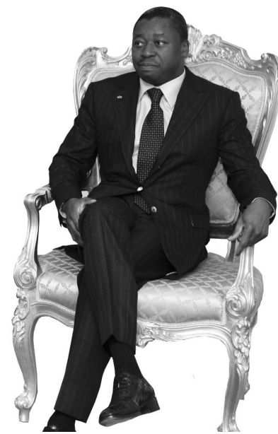
Pdt Faure Gnassingbé

sident de la délégation de l'Union Européenne (UE) au Togo et en même temps vice – doyen du corps diplomatique, cette année ce sont eux qui viennent en dernière position. Au cours de leurs présentations de vœux, il est prévu, comme d'habitude au programme, le discours de leur doyen et la réponse du président de la République. L'année écoulée, les diplomates avaient souhaité la tenue des législatives dans un climat de paix et de transparence ce qui a été le cas avec l'assurance du Chef de l'Etat. Ces élections ont été libres, démocratiques, justes et équitables répondant aux normes internationales. Les diplomates aujourd'hui, dans leur mot toucheront les sujets qui font l'actualité politique au Togo comme, entre autres, la question des réformes politiques et l'organisation, en 2015 de l'élection présidentielle. Les