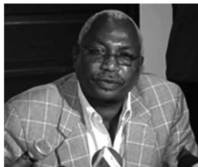
Tafa Tabiou, Pdt de la CENI

nanciers, elle poursuit ses activités. Aujourd'hui, elle rencontre les partis politiques à 9h et les médias à 10h 30. L'objectif est de présenter à ces acteurs importants pour le processus les tâches réalisées jusqu'à présent pour que chacun soit au même niveau d'information ; ce qui éviterait des supputations qui sont de nature à jeter du discrédit sur les efforts qui sont en train d'être faits.