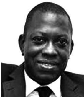
Kako Nubukpo, Ministre en charge de la Prospective