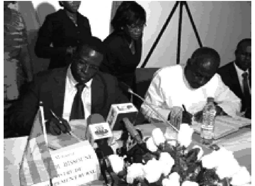
Les deux ministres posant leur signature

ghanéen ; mobiliser des fonds privés pour réaliser le projet, dont le cout est estimé à 2.195.000 euros sont entre autres préoccupations qui constituent l'axe de dudit pro-