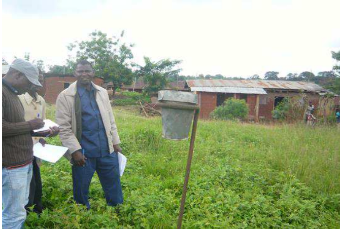
Poste pluviométrique à Kougnonhou