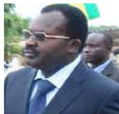
Le PM Ahoomey-Zunu, ministre de la Santé

Parmi les mesures prises par le Togo pour mieux se prévenir et lutter convenablement contre la maladie à virus Ebola, le gouvernement a commandité une étude anthropologique sur cette épidémie qui a fait plus de 11.000 morts dans la sous-région ouest africaine en 14 mois. Les résultats de cette étude ont été présentés ce mercredi à Lomé au premier ministre, Arthème Séléagodji Ahoomey-Zunu, a appris l'Agence de presse Afreepress.