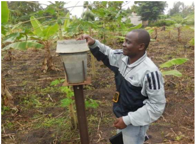
Poste Pluviométrique, le 06/09/2014 (Glékopé)