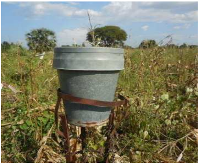
Observatoires pluviométriques : Le poste pluviométrique de Tami au 03/12/2014

Selon la mission chargée de l'étude, les résultats montrent que toutes les stations pluviométriques, climatologiques, synoptiques sont à rénover par de nouveaux équipements de nouvelle génération et que la période de 6 (6) ans est jugée convenable pour pourvoir en nouveaux équipements de mesure de météorologie et d'hydrologie. Elle a, par ailleurs, prévu la formation diplômante professionnelle en " Licence Professionnelle en base de données météo hydro " et ingénieur au titre des cadres moyens de météorologie et d'hydrologie.