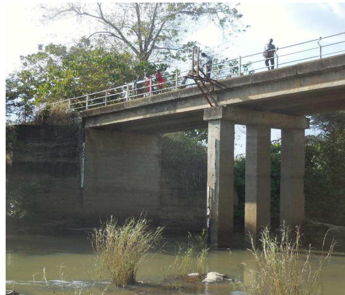
Observatoires hydrologiques : Environnement de la station sur la rivière Anié à Blitta-Gare au 13/11/2014

Parmi les instruments recensés, se trouvent : le Pixel (20km×20km), l'Oregon et le Ventage pour la météorologie et le Flotteur, le Radar sans GPS, la Limnométrie, le Linographie, le XZC2-2D, le Radar avec GPS pour l'hydrologie.