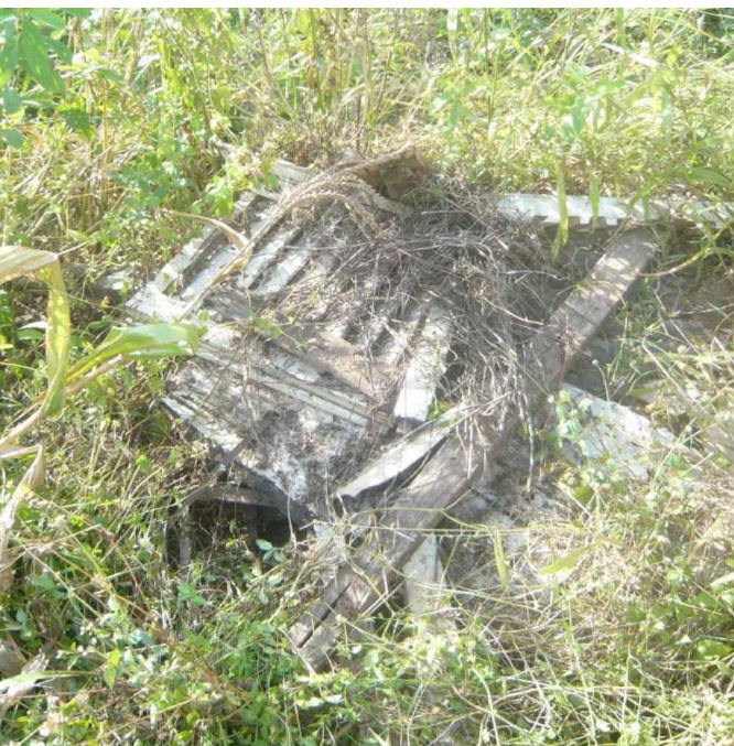
Observatoires climatologiques : Restes de l'abri météorologique (Bassar), 10/11/2014

Le coordonnateur du projet, M. Morou, a signalé que ce besoin de renouvellement des équipements dans les 180 centres de météorologies sur toute l'étendue du territoire permettra à la population locale d'être informée à temps avant que se produisent les catastrophes ou pour des dispositions préventives à prendre.