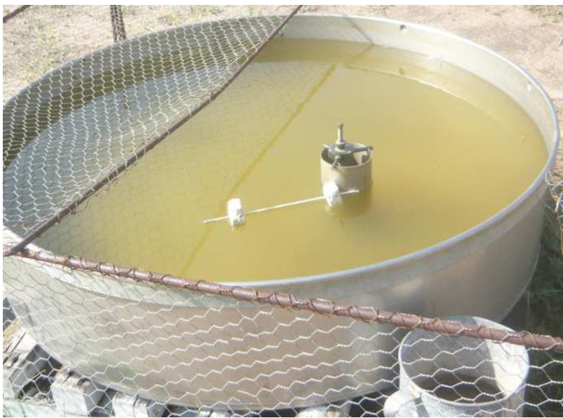
Observatoires synoptiques : au bureau de la Banque mondiale a fait savoir que la problématique de la prévention des catastrophes par Bureaux de la station synoptique de Sokodé