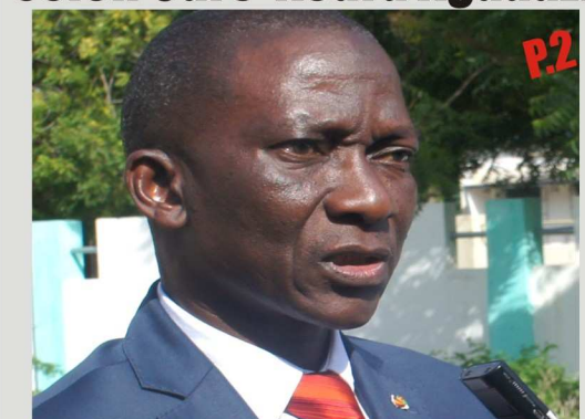
Col Ouro-Koura Agadazi, ministre de l'Agriculture

Hausse du prix du maïs sur le marché : Une situation " normale ", selon Ouro-Koura Agadazi