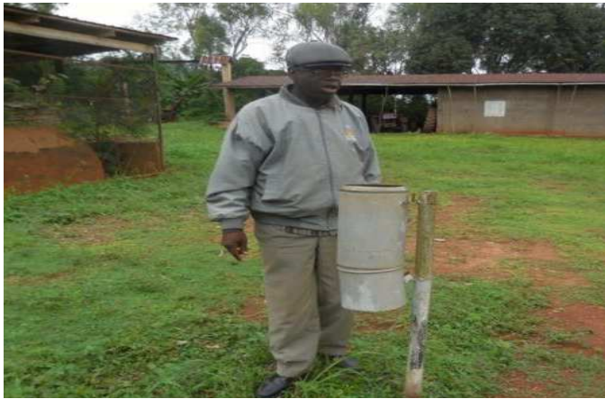
Poste Pluviométrique constaté le 05/09/2014 (Agou-Gare)