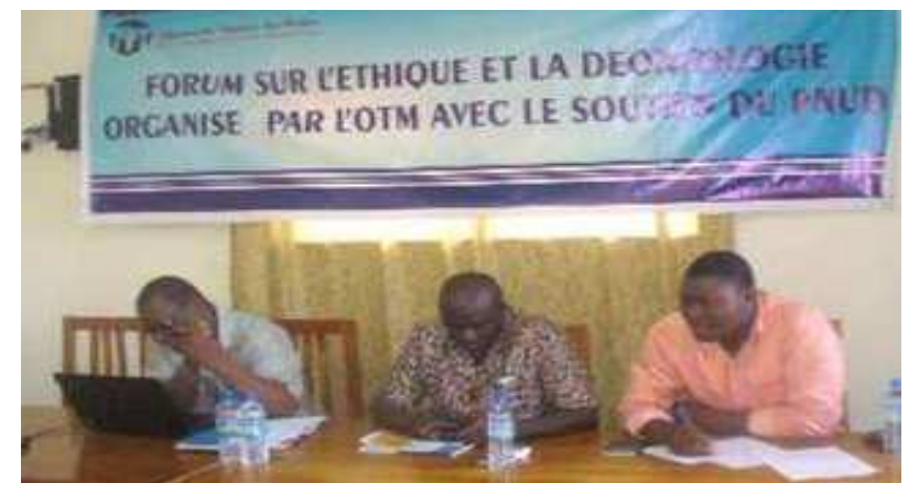
La table d'honneur lors de la rencontre; au milieu le président de l'OTM

d'hommes prennent le dessus et l'on assiste le plus souvent à des injures qui ne font pas honneur à la profession. Il a également cité l'exemple du RD- Congo et de la Belgique pour expliquer à l'assistance que, ces dérapages existent partout.