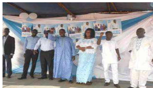
Les cadres de la MJPG face ...

Tour à Tour, les responsables des associations constituant la majorité silencieuse, ont rappelé le travail de sensibilisation de l'électorat qui a conduit à la victoire de leur candidat. Ils sont revenus sur ce qu'ils ont appelé " une absurdité électorale ", qui a consisté au sein de l'opposition, à déclarer nuls les résultats issus des