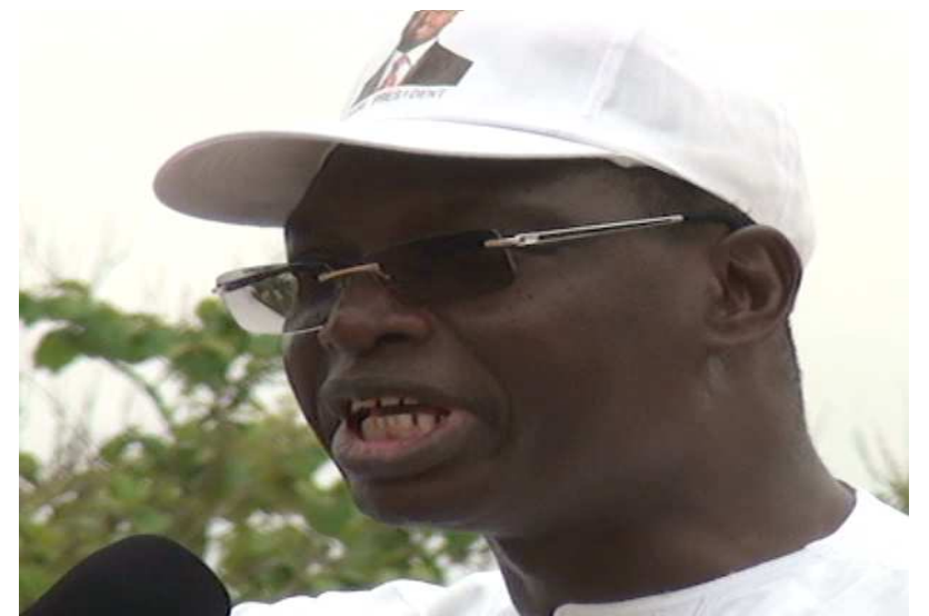
Le Commissaire Adoyi Essowavana

Avec respectivement 38%(109.994 voix sur 522.887 votants), la région Maritime et le grand Lomé connaissent une progression du candidat de l'UNIR par rapport aux consultations antérieures.