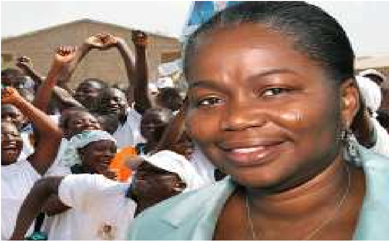
Mme Victoire Tomégah-Dogbé

Le président élu a prêté serment le 4 mai courant devant la cour constitutionnelle réunie en séance solennelle et il ne reste que l'investiture à venir. Pour en arriver là il a fallu batailler avec des combattants qui ont donné le meilleur d'eux-mêmes pour que le parti présidentiel et son candidat triomphent. Les artisans de cette brillante victoire sont nombreux et diversifiés.