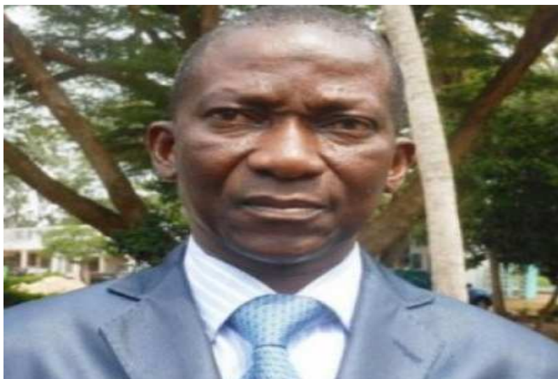
Ouro-Koura Agadazi, ministre de l'Agriculture

Depuis quelques jours, le prix du maïs connaît une légère hausse sur les marchés sur toute l'étendue du territoire national. A Lomé par exemple, le bol de maïs de 2,5 kg est passé de 500 francs CFA à 550 ou 600 francs, voire même à 700 francs. Cette situation n'est pas sans alarmer aussi bien les consommateurs que les femmes revendeuses de cette céréale très prisée à la consommation au Togo.