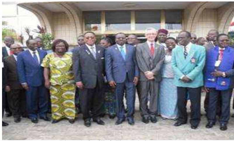
Photo de famille à l'issue de la rencontre

cités par le numéro 2 de l'exécutif togolais, il a également souligné, en tant que ministre togolais de la Santé, l'intérêt du Gouvernement Togolais de savoir le Rotary engagé dans l'action majeure de la lutte contre la poliomyélite dans le monde et au Togo.