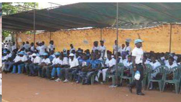
...aux membres lors de la rencontre

bureaux de vote dans lesquels leur adversaire a été plébiscité. Pour la majorité silencieuse, tout a été limpide au regard des résultats parvenus à la CENI, confrontés avec ceux des observateurs nationaux et internationaux, ajoutés à la proclamation de la Cour Constitutionnelle.