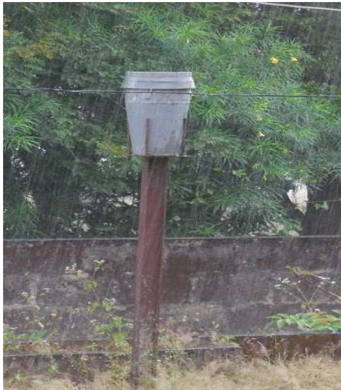
Observatoires pluviométriques : Le Poste Pluviométrique de Alédjo-Kadara