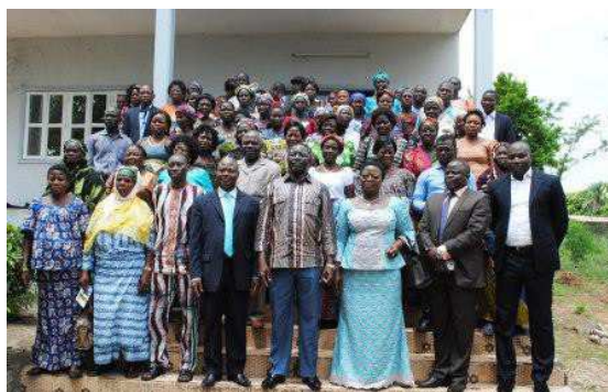
La ministre (2e à droite) a posé avec les acteurs

Le projet de trois ans prend en compte trois volets : à savoir le renforcement des capacités productives, l'appui des unités de transformation existante et la commercialisation du Soja.