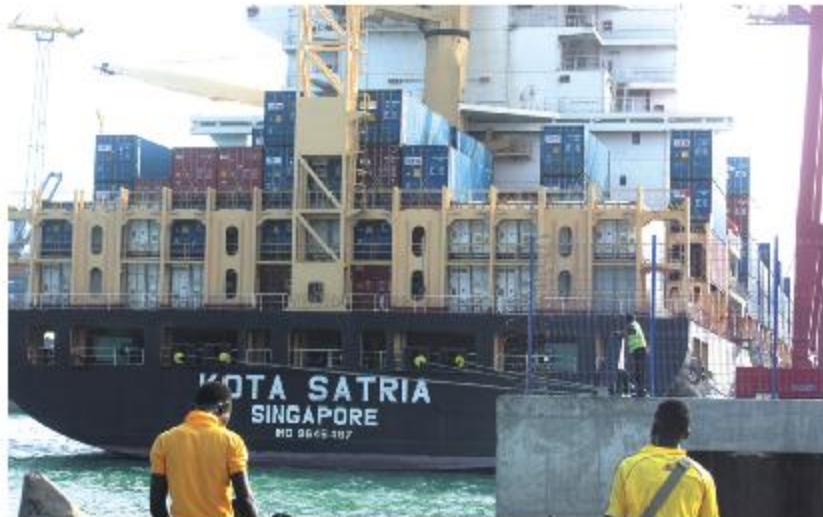
Le Port de Lomé recevant pour les amateurs

déplacements. Ainsi, selon ces recoupements sur le terrain, les propriétaires des voitures de location sont conscients de leur part de responsabilité dans la réussite de cet important rendez-vous, les uns et les autres s'apprêtent activement en prenant soin de rassurer du bon état de leurs voitures qui doivent non seulement être propres, mais surtout répondre aux normes de sécurité en vigueur. Au regard de parcs visités, ceux là qui auront à solliciter les services des agences de location des voitures pour ont disposés de toutes les gammes en fonction de leurs bourses. C'est le lieu d'attirer l'attention des promoteurs des nos agences sur la nécessité de bien sensibiliser pour leur part le personnel qu'ils auront à utiliser, notamment les chauffeurs et les convoyeurs, à être bien propres, égaux et dignes de confiance. Alors les visiteurs tireront satisfaction partout où ils seront conduits à travers tout le Togo qui pour découvrir des sites touristiques ou pour des courses personnelle. Les agences concernées ont leur intérêt à relever les défis qui s'imposent afin de garantir davantage leur carnet d'affaires.