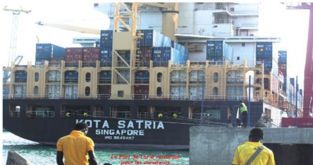
Le Port de Lomé rassurant pour les amateurs

Les préparatifs se précisent pour assurer un séjour agréable aux participants P.8