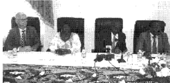
Les participants à l'atelier de renforcement de capacité des professionnels des médias.

Cet atelier de renforcement de capacité des professionnels des médias sur le thème « les fondamentaux du journalisme professionnel » arrive donc à point nommé pour améliorer les capacités des journalistes qui, six jours durant, seront outillés par d'éminents formateurs. Cette formation leur permettra ainsi, non seulement, de mieux exercer leurs médias dans le respect des genres rédactionnels journalistiques mais aussi d'améliorer leurs performances à travers des connaissances précises qui seront dis-