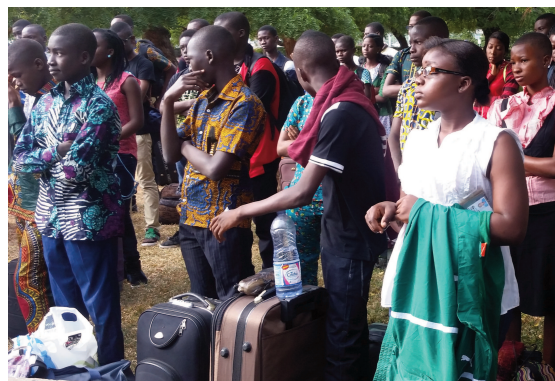
Les élèves participants à la colonie de vacances

dans les localités de la préfecture de la Kozah pour le compte du programme, l'argent de poche pour tout le séjour donné aux enfants talentueux était de 1500