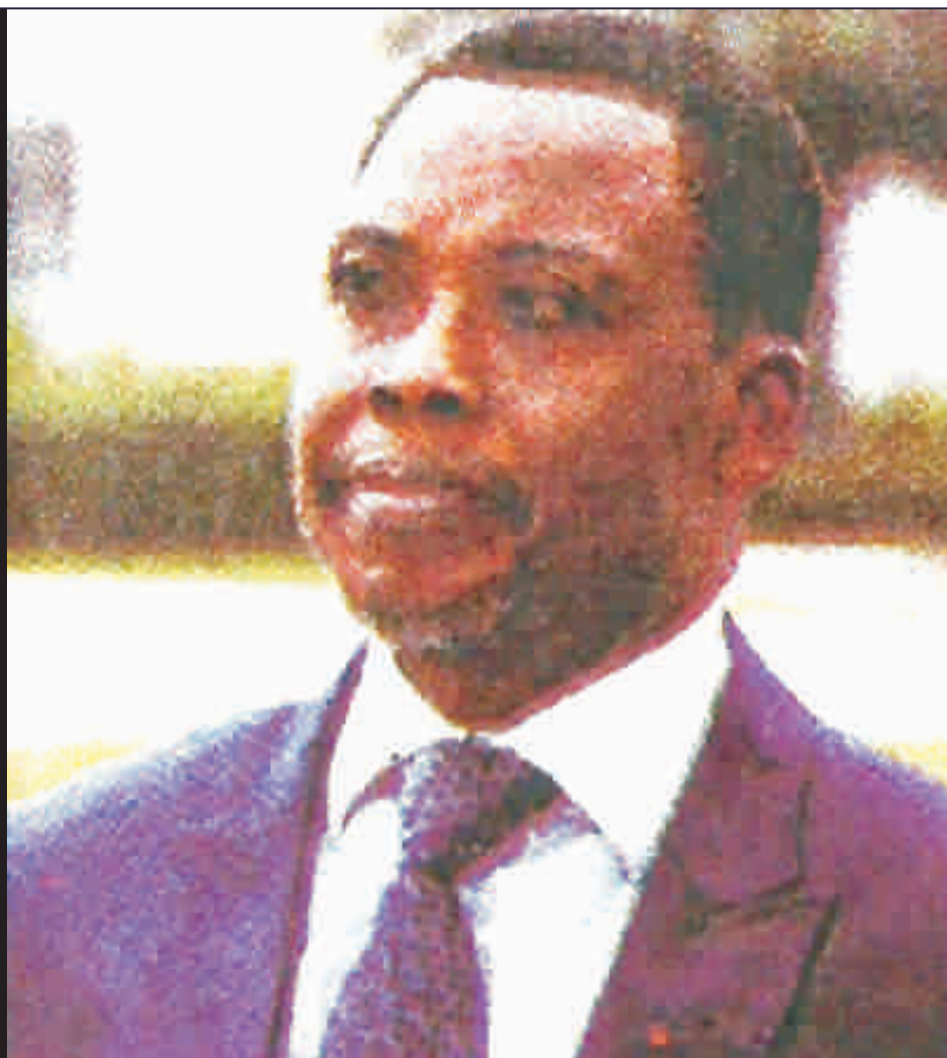
M. Pyus Agbetome, Ministre de la Justice

Le phénomène de l'insécurité au Togo QUAND LES JUGES INDÉLICATS SAPENT LE TRAVAIL DES FORCES DE L'ORDRE ET DE SÉCURITÉ P.3