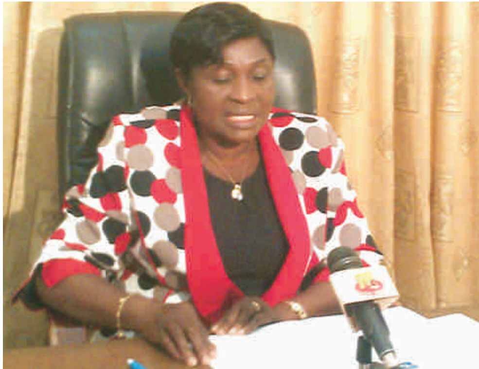
La Ministre Yentcharé de l'Action Sociale

Célébrée tous les 8 septembre de chaque année, la journée internationale de l'Alphabétisation édition 2015 est célébrée ce mardi 8 septembre au Togo. Pour l'occasion, la ministre de l'action sociale de la promotion de la femme et de l'alphabétisation, Kolani Yentcharé a délivré un message à son cabinet à Lomé, le lundi 7 septembre 2015. En effet, la journée mondiale de l'Alphabétisation est instituée par l'UNESCO en 1965 dans le but de sensibiliser et informer l'opinion nationale et internationale sur l'ampleur et les méfaits de l'analphabétisme ainsi que les conséquences qu'il peut avoir sur le succès des individus et de la société en générale. Cette journée est également une occasion pour mener des plaidoyers auprès des autorités publiques et privées, des médias, des partenaires, pour une mobilisation intégrée autour de la lutte contre l'analphabétisme. Pour l'édition de cette année, il est retenu comme thème « alphabétisation et sociétés durables ». Un thème qui selon la ministre, souligne le lien qui existe entre les conséquences