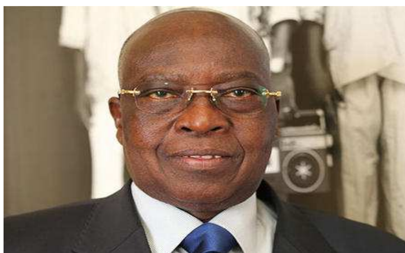
Adji Otèth Ayassor, ministre d'Etat, ministre de l'Economie et des Finances

la réaction du Chef de l'Etat qui n'a pas du tout laissé une seule seconde à ses Ministres concernés afin de trouver le plus rapidement possible une solution aux cris des riverains.