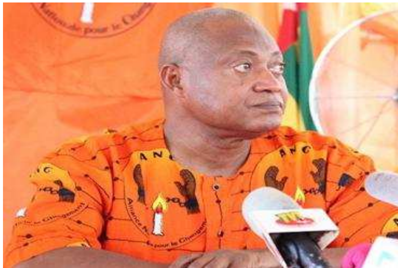
Jean-Pierre Fabre, président de l'ANC

CETTE FOIS ci, nous pouvons être sûrs que le désamour entre Jean-Pierre Fabre et les militants de l'ANC a atteint un point de non retour. Pour qui connaît la force de mobilisation de ce parti aux lendemains de sa création, c'était une surprise, un étonnement et un choc à voir le maigre public qui peinait à répondre aux slogans. Pour être poli, nous dirons que ceux qui ont fait le déplacement s'évaluent à un peu plus d'un millier de personne. La moitié a vidé les lieux pendant que Jean-Pierre Fabre était sur l'estrade. Consternant pour un vieux militant qui s'est rappelé la foule immense sur ce même terrain d'Ablogamé dans les années 90.