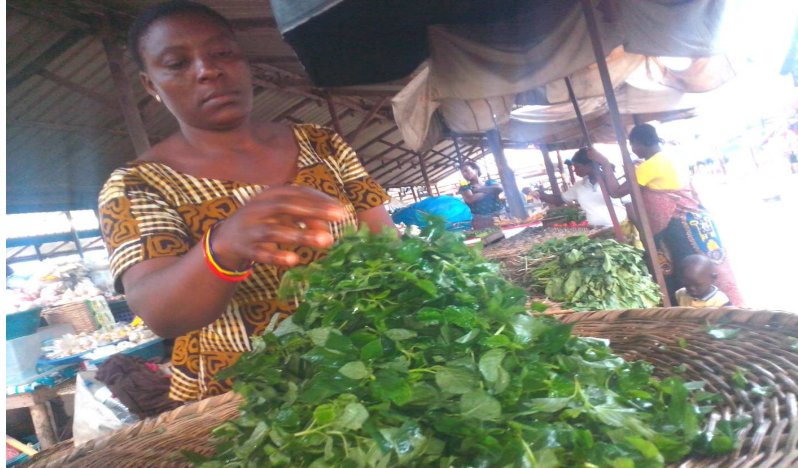
Adémé, en forte hausse (+64,6%)

Parallèlement, les postes "Légumes frais en fruits ou racine" (-13,2%) ; "Poissons et autres produits séchés ou fumés" (-4,2%) ; "Agrumes" (-15,9%) ; "Légumes secs et oléagineux" (-4,3%) ; "Tubercules et plantain" (-1,2%) ; "Volaille" (-1,6%) et "Bœuf" (-1,0%) ont contribué à l'amortissement de la progression de la fonction "Produits alimentaires et boissons non alcoolisées". Pour ce qui est de la fonction de consommation "Restaurants et Hôtels", la progression observée est portée par le poste "Restaurants, cafés et établissements similaires" (+0,4%). S'agissant de la