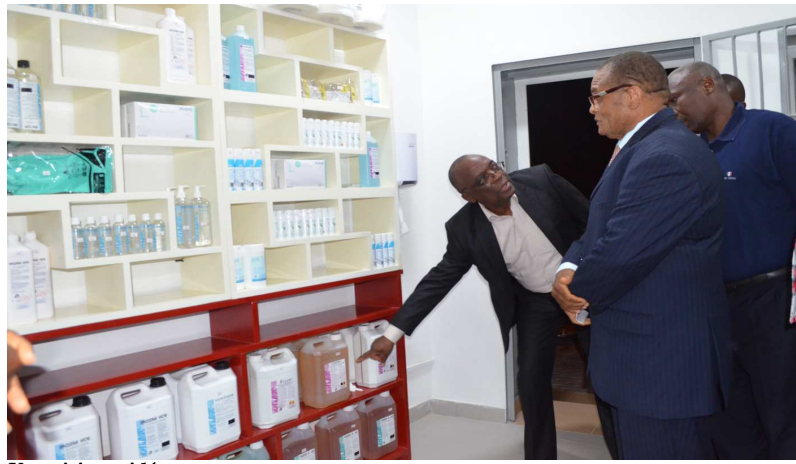
Une visite guidée...