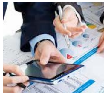
Prévision en baisse

L'OCDE estime en effet que la croissance française atteindra 1,4% l'an prochain et non 1,7% comme elle le prévoyait encore en juillet dernier. La nouvelle prévision de l'OCDE apparaît donc juste en dessous des 1,5 % attendus par Bercy et réaffirmé un peu plus tôt par Michel Sapin. Une prévision officielle qui pourrait même être dépassée puisque Michel Sapin a qualifié celle-ci de "prudente" et expliqué que le gouvernement cherchait à se "donner les moyens de faire mieux." L'Allemagne, moteur de la zone euro, continue à afficher une croissance plus forte que la France, mais a elle aussi vu ses perspectives corrigées sensiblement: le Produit intérieur brut allemand devrait selon l'OCDE croître de 1,6% cette année (même prévision qu'en juin) puis 2% l'an prochain (-0,4 point par rapport en juin). La croissance européenne s'améliore moins vite qu'espéré l'OCDE, dans son rapport intermédiaire sur l'économie mondiale, n'a pas livré d'analyse détaillée pays par pays. Elle a seulement noté qu'en moyenne en zone euro, la croissance "s'améliorait, mais moins vite