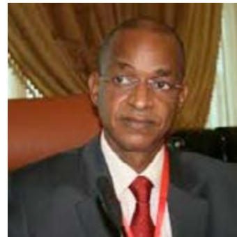
Cellou Dalein Diallo

Après les premières élections démocratiques de son histoire en 2010 qui ont vu l'arrivée d'Alpha Condé au pouvoir, le pays fait face à de nouvelles épreuves dans sa marche. Ainsi, plusieurs crises et autres problèmes majeurs minent le pays depuis l'arrivée des élections présidentielles.