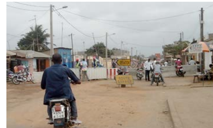
Travaux routiers à Bè

La même situation prévaut au niveau du boulevard de la paix à commencer par le rond-point