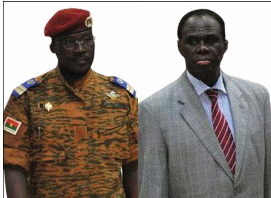
Le Pm Zida et le Pdt Kafando

On croyait les carottes cuites et les marrons définitivement tirés du feu pour une élection présidentielle apaisée au Burkina Faso. Que nenni.