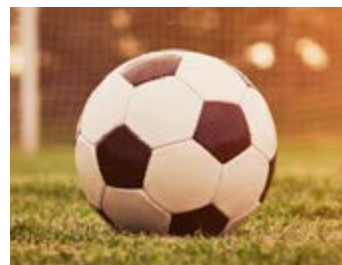
Vue d'un ballon

Les championnats D1 et D2 avaient été programmés pour débiter le samedi 12 septembre 2015 mais visiblement les