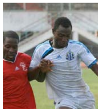
Des joueurs de la D1

Cette première du genre réunira 8 formations premières et deuxième divisions et des centres de formations du Togo. Le tirage au sort des quarts de finale a été effectué le mardi. A suivre des explications entre AS Togo Port, récent vainqueur du tournoi Sport FM et ASFOSA ou encore Agaza - JCA (Jeunesse Club d'Agoenyivé). Les demi-finales sont prévues le mercredi 23 septembre. Puis un match de classement le 26 septembre. La grande finale est prévue pour le 27 septembre précédée d'un match d'exhibition de football féminin entre Athleta et CECO Dauphines (deux des meilleures formations féminines du pays).