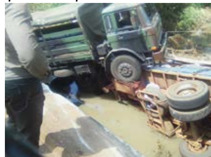
Vue de la scène

Un convoi des Forces Armées Togolaises (FAT) a été victime d'un accident de circulation le dimanche 13 septembre 2015 sur le tronçon Langabou-Gnamassila (route nationale n°1) dans la préfecture de Blitta. Le convoi avait quitté à Lomé pour se rendre à Kara.