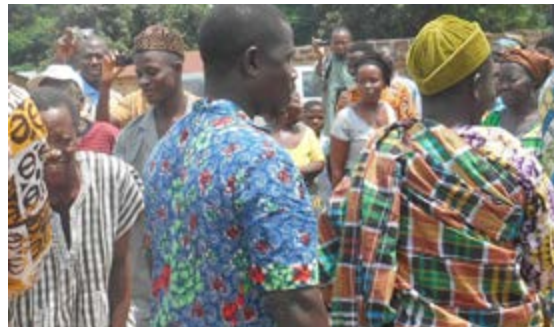
Une fête traditionnelle à Kpalimé

Le problème de chefferie au Togo devient de plus en plus récurrent au Togo. Et pourtant chaque peuple, chaque tribu, chaque communauté est régi par des us et coutumes dont les dispositions prévoient déjà la succession après la mort d'un chef.