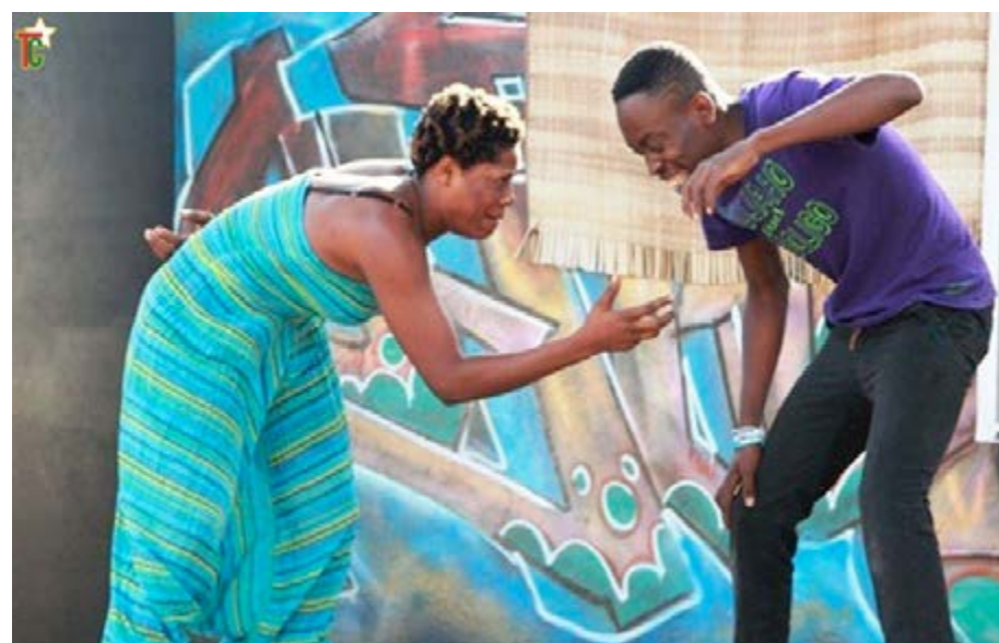
Vue de la mise en scène