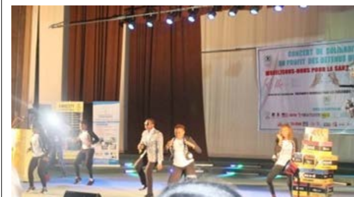
Une prestation durant le concert

La 3 e édition du concert pour les détenus a eu lieu dimanche 13 septembre dernier au palais des congrès de Lomé.