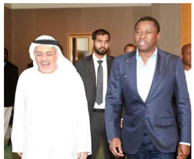
Faure Gnassingbé et des dirigeants d'entreprises

A ce deuxième jour de visite, le Togo a également signé un accord avec la société Amea Power. Cet accord s'inscrit dans le cadre du projet de centrale solaire de 30MW. Avec cet accord, « le schéma