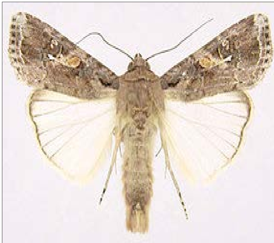
Chenille légionnaire dans son état papillon

raison de sa grande dépendance à l'égard de l'agriculture. En général, l'expansion de l'aire géographique de telles espèces est empêchée par des barrières naturelles, océans ou montagnes. Mais avec le développement des échanges commerciaux et des déplacements au niveau mondial, on a observé une multiplication ces dernières décennies de ces invasions biologiques. On peut citer le grand capucin du maïs, Prostephanus truncatus , lui aussi originaire des Amériques, introduit par accident en Tanzanie dans les années 1970. Ce coléoptère s'est rapidement propagé via des lots de maïs et