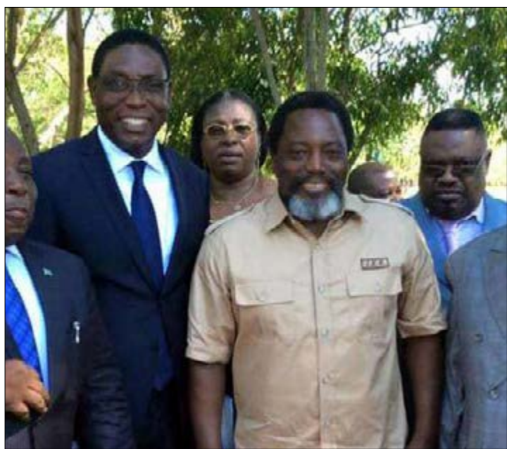
Kabila entouré des membres du FCC

Seconde avancée de la coalition dirigée par l'ancien président Joseph Kabila, ce 11 mars 2019 en RDC. Après la majorité à l'Assemblée nationale, le Front commun pour le Congo (FCC) vient de conforter sa présence sur la scène politique congolaise en raflant la quasi-totalité des Assemblées provinciales du pays. Une avancée qui réduit de plus en plus les marges de manœuvre du nouveau président Félix Tshisekedi.