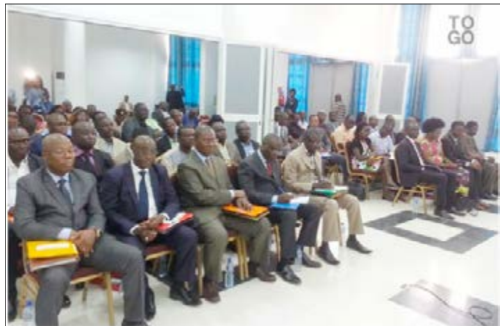
Officiels et participants lors du séminaire

La corruption est un vrai cancer pour les économies mondiales aujourd'hui. Le Togo qui est aussi touché par le phénomène cherche à s'en débarrasser afin d'attirer plus d'investissement pour son développement et surtout que le peu de ressource qui existe puisse servir réellement pour la cause commune. Les autorités ont donc pris le problème très au sérieux depuis quelques années avec une accentuation dans la prise de mesures ces derniers mois par la création de la Haute autorité de prévention et de lutte contre la corruption et les infractions assimilées (Haplucia).