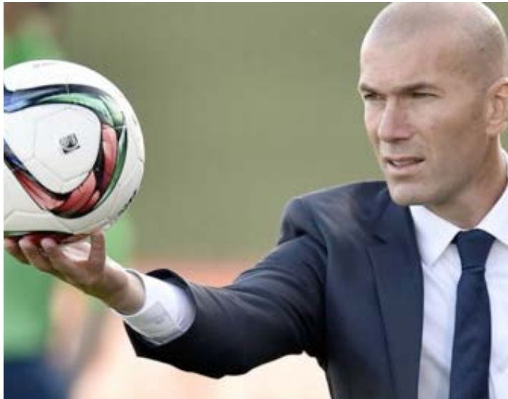
Zinedine Zidane, nouvel entraîneur du Real Madrid

actuel des Merengue. Marcelo pourrait être un des grands gagnants de ce retour. Affecté par le départ de Cristiano Ronaldo, le Brésilien a même été relégué sur le banc au profit de Reguilón, un jeune joueur du club. Isco, Kroos, Benzema et Marcelo font partie des joueurs les plus utilisés par Zidane lors de son premier passage au Real Madrid. Thibaut Courtois pourrait