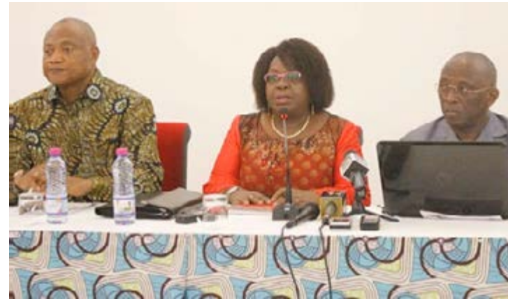
La C14 lors de la conférence de presse

La Coalition malgré les difficultés de désignation d'un candidat unique comme on l'a toujours constaté par le passé, veut mettre en place les modalités pratiques pour y parvenir. Ainsi, le regroupement va se restructurer. Une conférence des présidents sera l'instance des