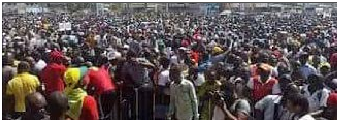
Des manifestants béninois

Ils étaient plus de 50 000 manifestants, selon les organisateurs, et environ 5 000, selon la police béninoise, à sortir manifester leur colère aux yeux du monde contre ce qu'ils appellent la dérive autoritaire du président Talon.