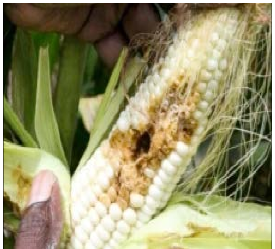
Etat d'un maïs rongé par la chenille légionnaire