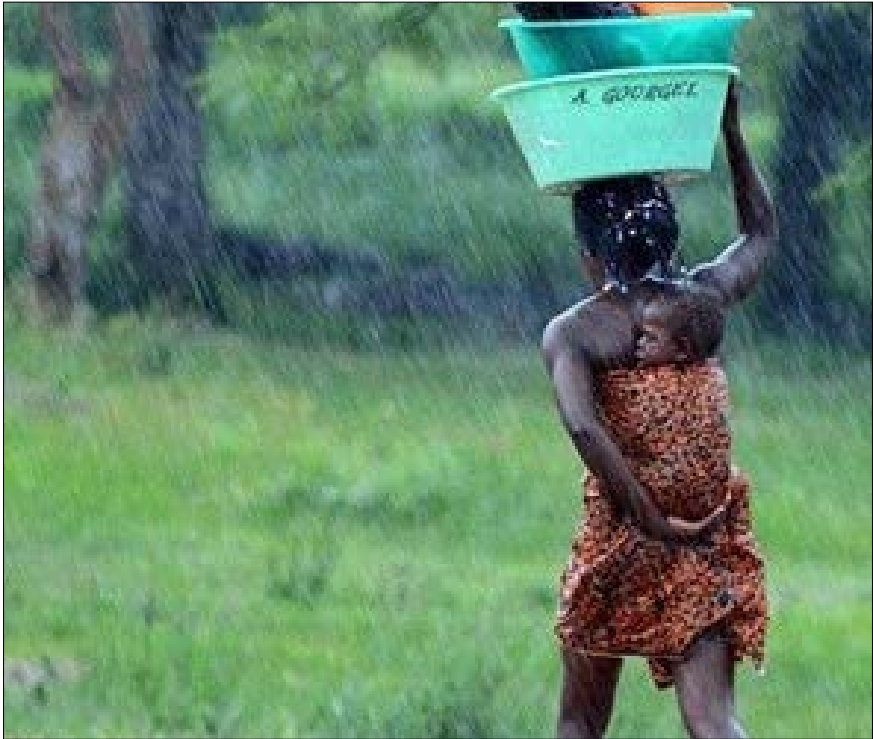
Commentez cette photo