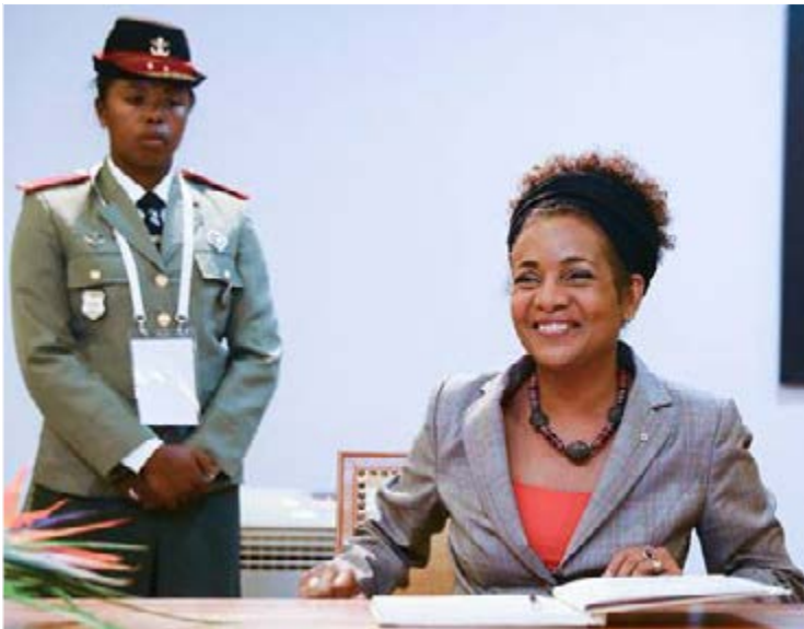
Michaëlle Jean, la Secrétaire générale de l'OIF

La Conférence des chefs d'Etat et de gouvernement des pays ayant le français en partage, communément appelée "Sommet de la Francophonie", est l'instance suprême de la Francophonie. Elle fait partie des trois instances consacrées par la Charte de la Francophonie (article 2) avec la Conférence ministérielle de la Francophonie (CMF) et le Conseil permanent de la Francophonie (CPF). Le Sommet se réunit tous les deux ans. Il est présidé par le chef d'Etat ou de gouvernement du pays hôte du Sommet