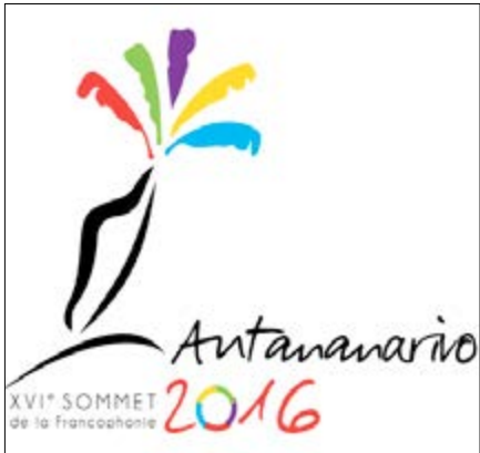
Le logo de la Francophonie 2016

Le sommet de Madagascar représentait jusqu'ici un double défi. Un défi pour Madagascar pour qui cette rencontre est la plus importante jamais organisée sur la Grande île qui avait déjà raté la même occasion en 2010 pour cause d'instabilité politique. Un défi également pour l'Organisation Internationale de la Francophonie qui va au-delà des aspects linguistiques et culturels pour mettre les pieds dans les plus grandes préoccupations mondiales actuelles. A cet effet le Président malgache Hery Rajaonarimampianina se fondant sur le thème de la réunion déclare : « Nous sommes convaincus que si le monde veut durablement et efficacement lutter contre la