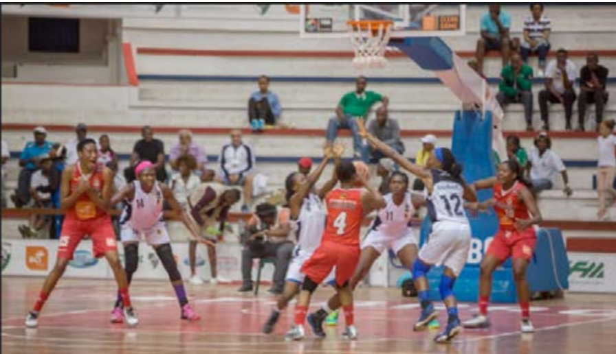
Le match First Bank vs Apolitecnica du Mozambique

Au terme d'un match très compliqué, First Bank du Nigéria a réussi à se débarrasser de l'Apolitecnica du Mozambique à la Coupe d'Afrique des Clubs Champions Féminine 2016 sur un score de 65-59. Primeiro d'Agosto a pour sa part confirmé son statut de favori en battant le GS Pétroliers 74-54.