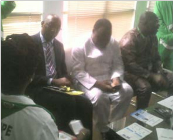
Les responsables du groupe Togo Télécom dans leur stand en compagnie du Dg du CETEF

La journée du samedi 26 Novembre dernier a été dédiée au Groupe Togo Telecom à la 13e Foire Internationale de Lomé (FIL). L'opérateur téléphonique a profité de cette opportunité pour présenter au public, ses dernières innovations au service du développement.