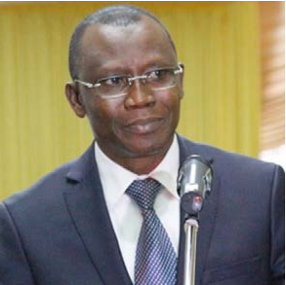
Sani Yaya, le ministre de l'Economie et des finances

Les députés togolais ont voté le jeudi 24 novembre en plénière, le projet de loi de finances rectificative gestion 2016. Les recettes connaissent désormais une augmentation de 188 milliards de francs CFA, soit 19% par rapport à la prévision initiale.