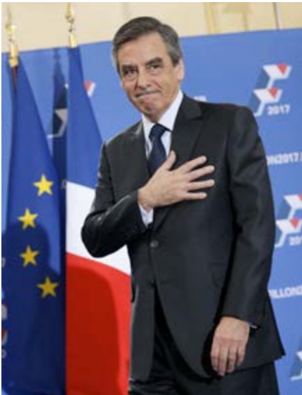
François Fillon, vainqueur de la primaire à droite

Dans un discours rapidement tenu dans son QG, François Fillon a déclaré qu'il était de son devoir de vaincre l'immobilisme et la démagogie. Pour lui, en effet, « La gauche, c'est l'échec ; l'extrême droite, c'est la faillite. Je parle de vaincre ces partis politiques, pas de vaincre ces Français déçus, ces électeurs qui ne sont pas aujourd'hui