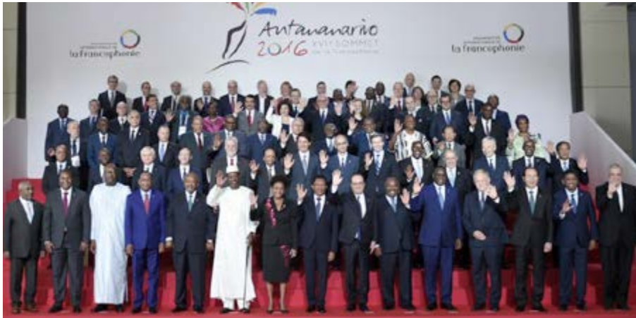
Photo de famille des chefs d'Etat et de gouvernement

Le Président en exercice sortant de la Francophonie, le Sénégalais Macky Sall réaffirme le soutien de l'OIF à la Cour Pénale Internationale éprouvée en ce moment. Mais le Chef de l'Etat sénégalais précise : « Il est important de rappeler que la justice pénale