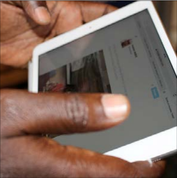
vers l'amélioration de la connexion internet au Togo

Le Gouvernement a annoncé la semaine dernière, la création toute prochaine de la Société d'Infrastructure Numérique (SIN). Elle sera chargée de booster le développement du numérique au Togo.