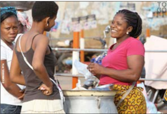
Le FNFI a touché près de 700 000 bénéficiaires

Le Fonds koweïtien pour le développement économique Arabe (FKDA) a accordé un soutien financier d'une valeur de 8 milliards CFA au Fonds National de la Finance Inclusive (FNFI). C'était la semaine dernière à Malabo en Guinée Equatoriale, en marge du sommet Afrique-Arabe.