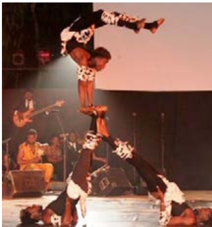
Une prestation lors du festival

« Kombibissé» est comme un manifeste, un concert chorégraphique dédié à l'Afrique, ses jeunes, leurs interrogations face à l'injustice, aux inégalités, leur incompréhension des politiques, leurs révoltes, mais aussi l'énergie prodigieuse de cette jeunesse, sa soif de changement et de construction. Avec ses propres mots, ses codes et sa culture, cette jeunesse parle de son incompréhension face au monde qui l'entoure, de son rejet des carcans politiques et culturels, de ses déceptions, de son désespoir, mais aussi de son impatience de voir les choses changer... voire de manifester sa volonté de survie, sa volonté de s'exprimer par les moyens qui lui sont à portée du corps. Et il se révèle à travers la pièce « Kombibissé» que le corps lui-même est le meilleur canal dans ce sens. En effet, « Kombibissé» est une œuvre où les corps sont aussi engagés que la pensée. Elle est portée par une dizaine de musiciens, cinq chanteurs, et plusieurs dizaines de danseurs...ensemble engagés pour cet hommage à la jeunesse