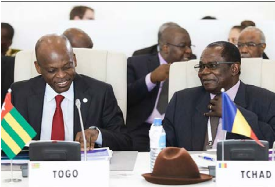
Robert Dussey lors des travaux du sommet

Dans une interview accordée au site Republicoftogo, le ministre togolais des Affaires Etrangères, Robert Dussey, a révélé que la 33e session de la Conférence Ministérielle de la Francophonie (CMF) portera sur l'économie bleue et aura lieu à Lomé. Pour Dussey, la rencontre de Lomé aura un rapport avec le récent sommet extraordinaire de l'Union Africaine sur la sécurité et le développement en Afrique qui s'est tenu au Togo.