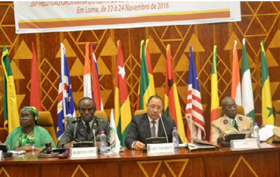
Table d'honneur lors de la cérémonie de clôture

De son côté, Nbemba M. Kéita, général de brigade de l'armée malienne et porte-parole du Comité des Chefs d'Etat-Major de la CEDEAO, a félicité ses pairs pour le bon déroulement des travaux. Il n'a pas manqué d'exprimer « sa gratitude au