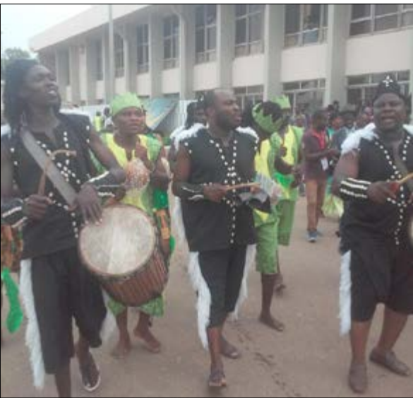
Des artisans à la foire

En vue de promouvoir ce secteur d'activité, la ministre du Développement à la base a expliqué