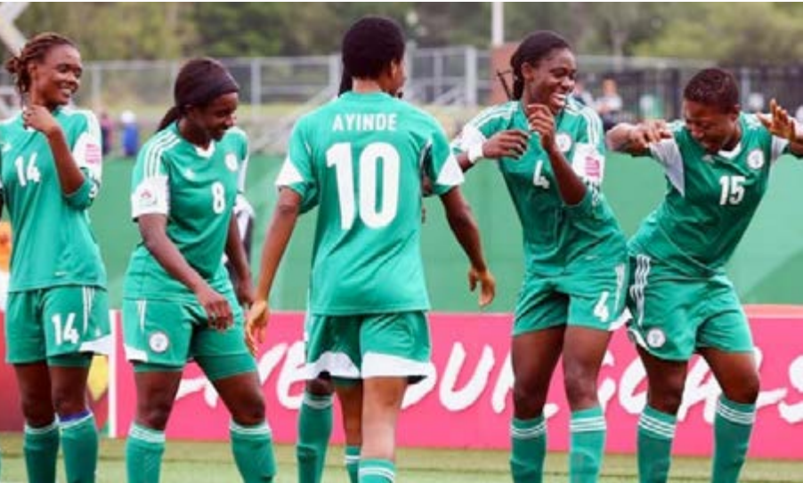
Les Super Falcons du Nigéria

La phase de poules de la Coupe d'Afrique des Nations de football féminin a été bouclée le 26 novembre avec les deux derniers matchs de la poule B. Il s'agit du Nigéria-Kenya (4-0) et Ghana-Mali (3-1). Les affiches des demi-finales sont désormais connues. Le Cameroun affrontera le Ghana tandis que le Nigéria affrontera l'Afrique du Sud. Résultats à l'issue de cette première étape de la compétition.