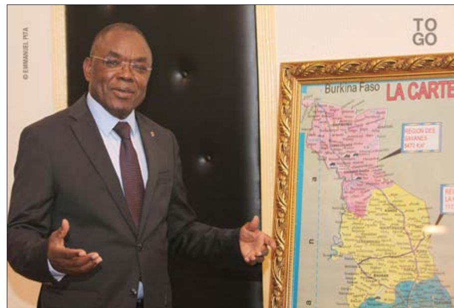
Figure 1 Le ministre Payadowa Boukpassi

des autorités. La marche, n'est donc plus autorisée à Lomé, mais à Adétikopé, où un circuit plus approprié a été tracé par le ministère. Pour ce qui est des marches que projette le PNP à l'intérieur du pays, deux localités ont finalement été retenues par l'autorité. Il s'agit de Sokodé et Afagnan. Toute manifestation à l'intérieur du pays, en dehors de ces deux localités n'est