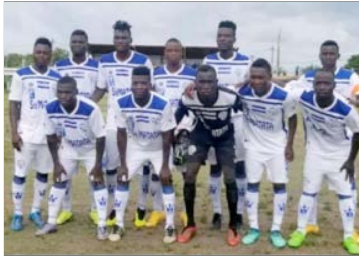
Les Show boys