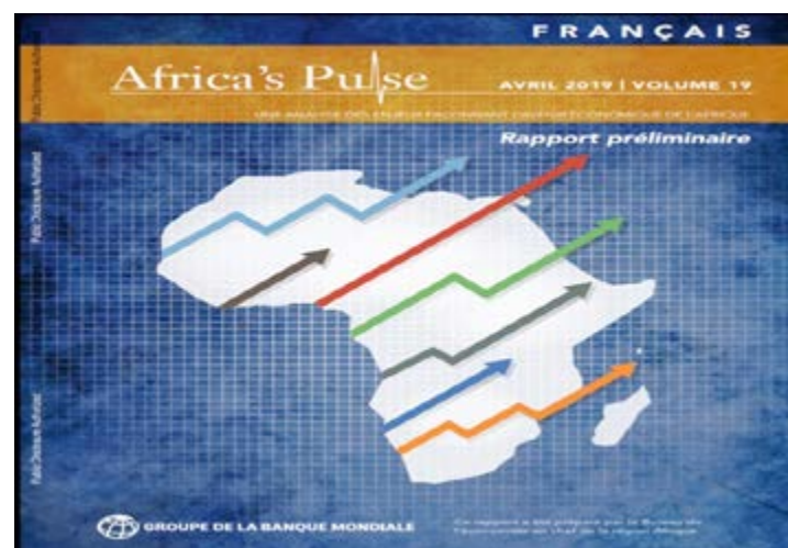
La couverture du rapport

résistantes aux risques dans un environnement extérieur difficile, les pays africains doivent renforcer leurs conditions nationales. Ces conditions se sont affaiblies et ont contribué à une croissance médiocre, en particulier au sein des plus grandes économies de la région », précise le rapport Africa's Pulse.