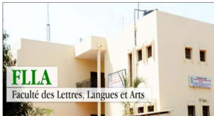
Décanat de la faculté des lettres, langues et arts

Le thème choisi pour cette année 2019 est : « Fluidité identitaire et construction de changement ». Ce thème constitue un moyen de déterminer les intérêts et de maintenir la tolérance sociale, seul gage du bien-être culturel. Cette année, la conférence inaugurale du Festilarts sera prononcée