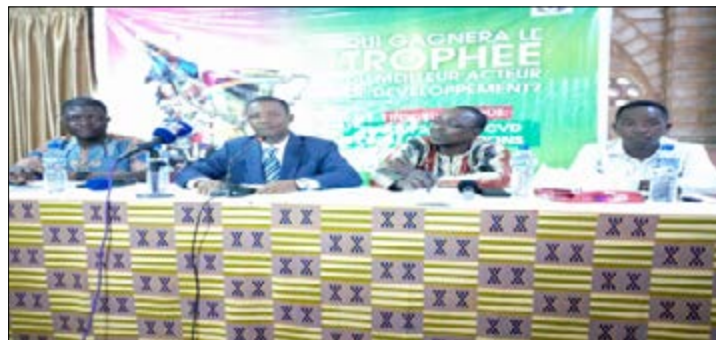
Le staff de l'association Opération développement en compétition (ODC)

communautaire sont quelques objectifs de ce concept. Cette compétition s'adresse à toute personne physique ou morale résidant au Togo et ayant participé à la mise en œuvre d'un projet qui concilie civisme et développement communautaire. On peut citer entre autres les communautés de développement à la base (CDQ, CVD, CCD) les Start up et tout citoyen de bonne