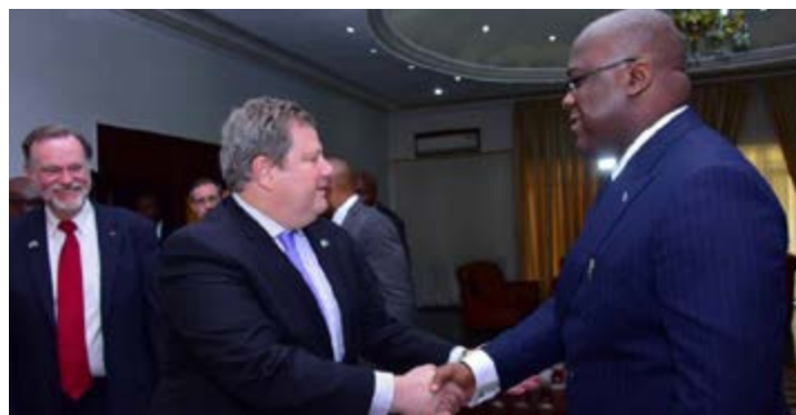
Félix Tshisekedi aux USA

Lors d'un séjour à Washington, Félix Tshisekedi a demandé jeudi dernier l'aide des États-Unis, alors même que les autorités américaines avaient pris des sanctions à l'encontre de plusieurs responsables du processus électoral congolais l'ayant mené au