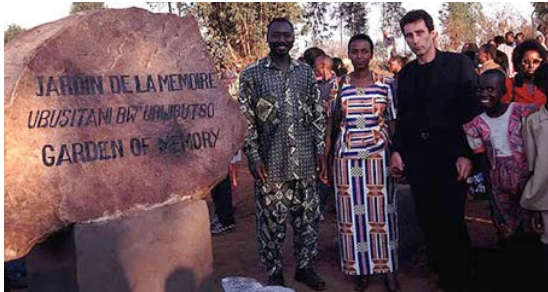
La place du Jardin de la Mémoire