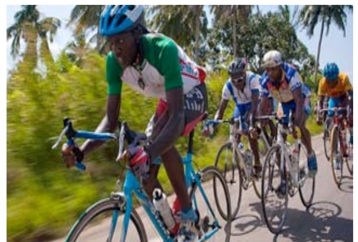
Tour cycliste du Togo