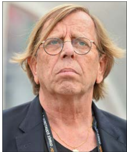
Claude Le Roy

Les Eperviers du Togo participeront à la CAN Gabon 2017. Ils entameront à partir du 1er Janvier 2017, leur stage de préparation à Saly au Sénégal. Dans un entretien qu'il a accordé à nos confrères de la radio « Taxi Fm », le sélectionneur du Togo Claude Le Roy s'est prononcé sur le dernier stage des Eperviers, les préparatifs de la CAN 2017 et le cas Adébayor.