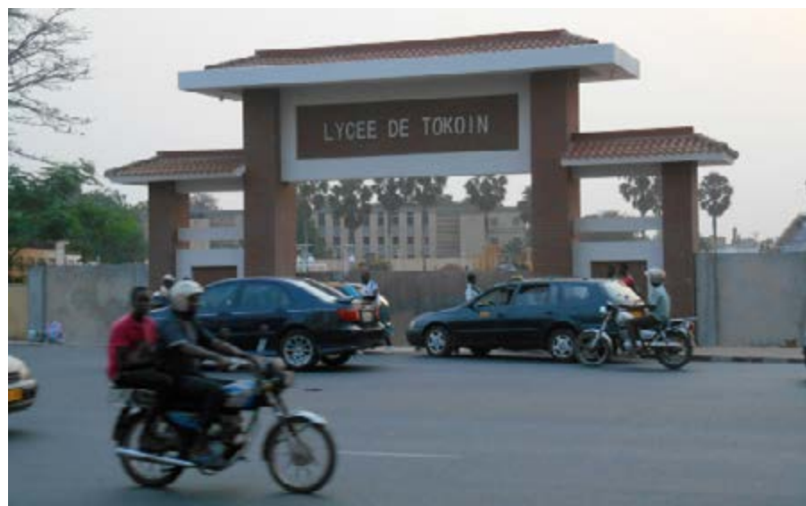
L'entrée du Lycée de Tokoin à Lomé

Les élections locales annoncées pour bientôt revêtent une importance capitale dans le processus de décentralisation au Togo comme indicateur de l'ancrage et de la consolidation du processus démocratique au Togo. Elles y serviront de baromètre à la dynamique irréversible de la démocratie : une démocratie de proximité dans laquelle les populations sont appelées à jouer pleinement leur partition en participant directement aux processus de prises de décisions aux côtés des élus locaux. L'article 141 de la Constitution indique que la République Togolaise est organisée en collectivités territoriales sur la base du principe de décentralisation dans le respect de l'unité nationale. Ces collectivités territoriales sont les régions, les préfectures et les communes. Toute autre collectivité territoriale est créée par la loi.