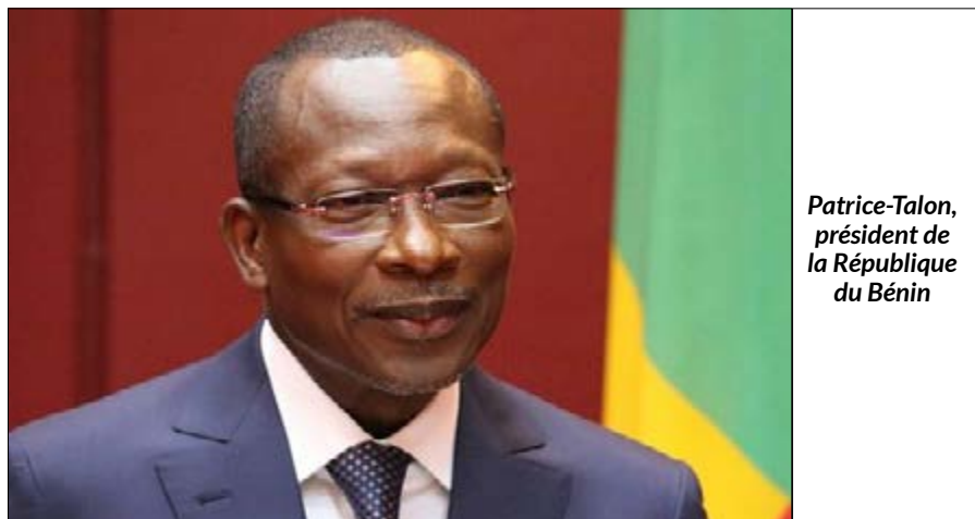
Patrice-Talon, président de la République du Bénin

Les centrales et confédérations syndicales du Bénin ont au cours d'un grand meeting d'information organisé ce mardi à la Bourse du Travail, dénoncé la gouvernance sous le magistère de Patrice Talon.