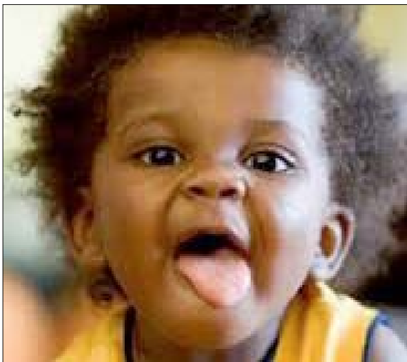
un enfant sur facebook (2)

Malgré plusieurs mises en garde, les parents continuent à poster et à partager sur des réseaux sociaux tels que Facebook ou Instagram des photos de leurs progénitures qui, à l'avenir, pourraient bien se rebeller contre eux. Faut-il exposer ou pas sa progéniture sur les réseaux sociaux ?