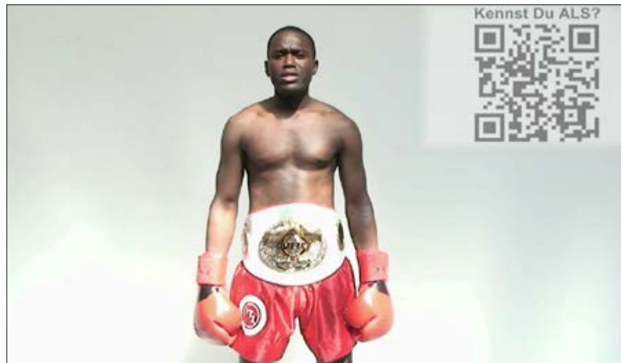
Le boxeur Prince Lorenzo

Le boxeur togolais Prince Lorenzo va défendre son titre de champion du monde, le 16 décembre prochain au palais des congrès de Lomé.