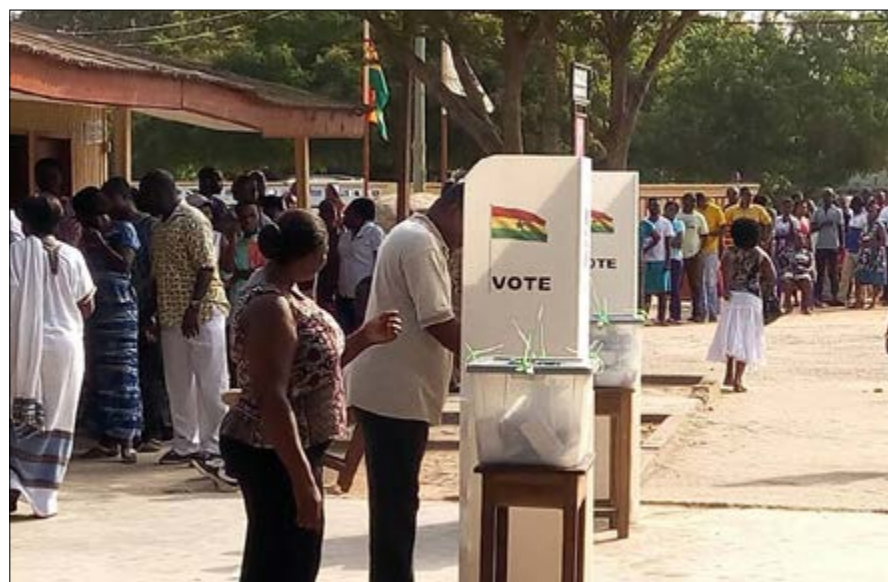
Un centre de vote au Ghana

Les Ghanéens attendent ce jeudi les premiers résultats de la présidentielle et des législatives qui se sont déroulées hier mercredi dans le pays. Mais d'ores et déjà, on assiste à une guerre de communiqués des deux principaux challengers à savoir John Mahama et Nana K. Abo. Pour la présidentielle, les électeurs avaient à faire le choix entre sept candidats et choisir 275 députés parmi 1.158 candidats. Le scrutin est venu parachever la période de la