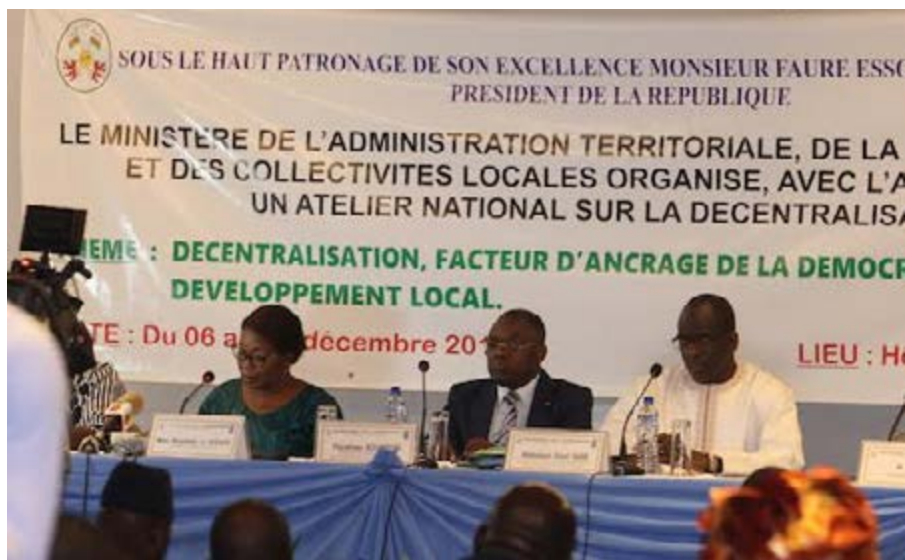
Les officiels à l'ouverture de l'atelier

C'est dans l'aire depuis quelques mois déjà, mais aucun débat d'envergure nationale et inclusive n'a été jusque là organisé pour accélérer le processus. L'atelier qu'organise le gouvernement les 06, 07 et 08 décembre devra permettre aux acteurs politiques, aux membres du gouvernement, aux partenaires techniques, aux membres de la société civile et autres, d'apporter leurs contributions pour que le processus de décentralisation déclenché par le gouvernement aille jusqu'au bout. Mais avant tout, il faut que tous les acteurs s'accordent sur les attributions et les rôles des élus locaux et des communes qui seront créés. Et surtout, il faudrait savoir comment trouver les moyens pour faire fonctionner efficacement les structures décentralisées ? L'autre inquiétude selon le gouvernement, c'est la création