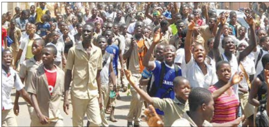
Des élèves dans la rue

Ces derniers jours, les élèves des enseignements primaires et secondaires de plusieurs villes du Togo ont repris à leur compte le mouvement de grève lancé par des syndicats d'enseignants. Pour se faire entendre, et pour demander à l'autorité de prêter une oreille attentive aux doléances des enseignants, ces derniers choisissent la rue, plutôt que leurs salles de classes. Ils investissent les rues, s'organisent et poussent loin le bouchon en allant délocaliser les camarades des établissements, privés ou publics, en marge de la grève. Ce mouvement a gagné Lomé hier.