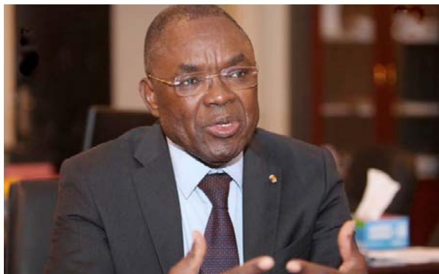
Ministre Payadou BoukpeSSI

institution de communes mixtes, les différentes constitutions togolaises consacrent la décentralisation. Ainsi, l'article 58 de la constitution du 4 avril 1961 énonce que : « La République togolaise, une et indivisible reconnaît l'existence des collectivités territoriales. Ces collectivités sont les circonscriptions et les communes. Elles s'administrent librement et