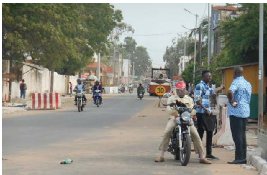
Une rue en chantier à Lomé

démocratiquement dans les conditions prévues par la loi. Pour sa part, l'article 84 de la constitution du 11 mai 1963 dispose que : « La République Togolaise une et indivisible, reconnaît l'existence des collectivités territoriales. Les collectivités territoriales sont créées par la loi. La loi détermine les principes fondamentaux de la libre administration, sous le contrôle de l'Etat, des collectivités territoriales,