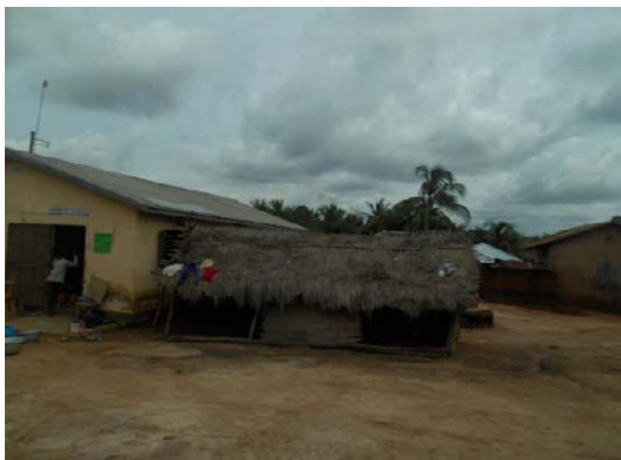
Un village dans les Bas-Mono

Depuis la constitution de la quatrième république du 14 octobre 1992, le Togo a opté pour une réforme de l'organisation administrative fondée sur le principe de la décentralisation. En effet dès