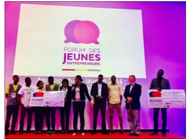
Les lauréats en compagnie du ministre Cina Lawson

Le Forum des jeunes entrepreneurs est une initiative de l'agence True de Claude Grunitzky, avec l'appui du ministère togolais des postes et de l'économie numérique, de l'UE etc. C'est un creuset d'échanges et de transmission de valeurs entrepreneuriales entre jeunes porteurs