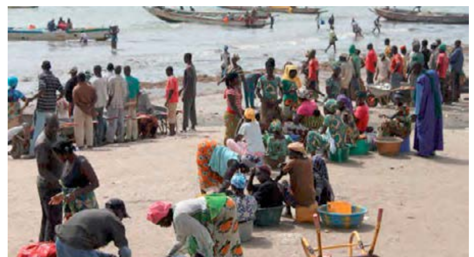
Activités économiques en Gambie

Cet endettement auprès des banques locales créé un effet d'éviction au détriment du secteur privé à double titre. D'une part, en matière de volume, dans un contexte de capitaux limités (lié à la faiblesse de l'épargne domestique et des investissements étrangers), l'État capte une part importante des fonds, ne laissant qu'une portion