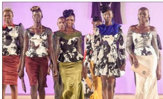
Les manequins en défilé

La dixième édition du festival international de la mode en Afrique (FIMA) s'est tenue du 16 au 17 décembre à Agadez au Niger. C'est en effet une plateforme qui réunit les stylistes et modélistes africains et d'ailleurs.