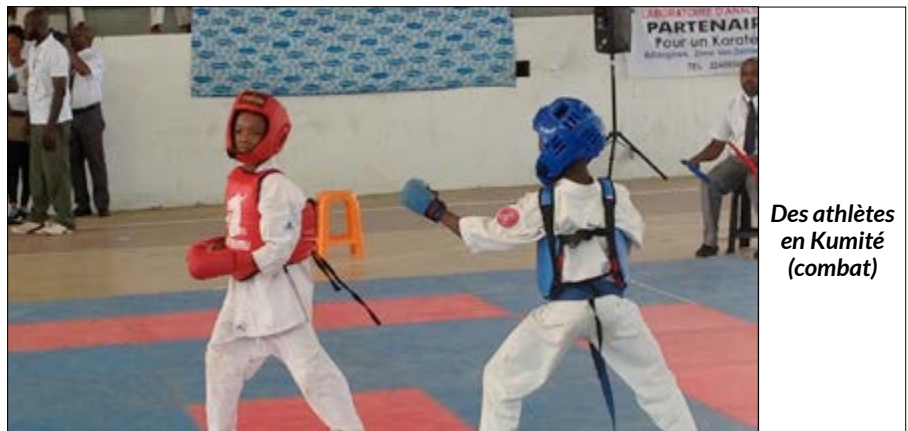
Des athlètes en Kumité (combat)

Hier dimanche 18 décembre 2016, les karatéphiles se sont retrouvés au stade omnisports de Lomé pour un tournoi dénommé Karaté Challenge. Placée sous le signe de la « Maturité », cette 4 e édition aura tenu toutes ses promesses eu égard au nombre de participants et aux nouveautés introduites cette année.