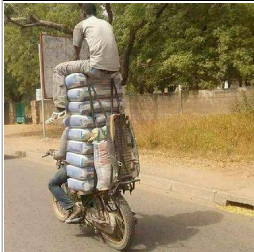
Commentez cette photo