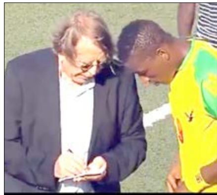
Claude Le Roy s'entretenant avec un joueur