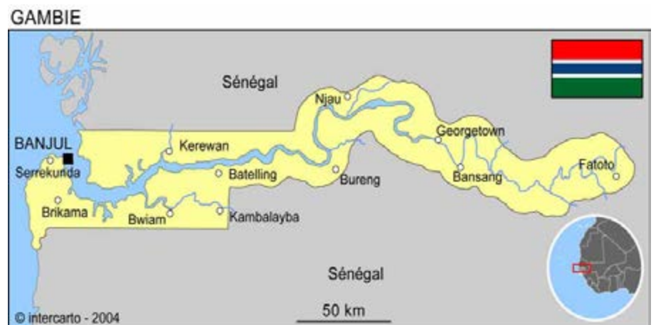
Carte géographique de la Gambie

La Gambie est un pays très étroit, qui s'étend de part et d'autre du fleuve Gambie. Sa largeur maximale n'excède pas 48 km. Un traité entre la France et le Royaume-Uni a défini les frontières actuelles en 1889. La