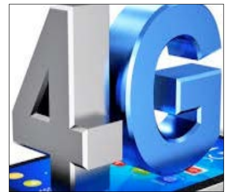
Bientôt la 4G au Togo

S elon le classement 2016 de l'UIT, L'île Maurice demeure le champion en Afrique et le 73 e au niveau mondial dans le développement des TIC et télécoms sur les 175 pays. Dans le classement, il est suivi des Seychelles et de l'Afrique du Sud, tandis que le Niger et le Tchad, en queue de peloton africain et mondial, doivent encore déployer d'importants efforts pour améliorer l'accès de leurs populations aux télécoms et espérer s'éveiller à l'économie numérique.