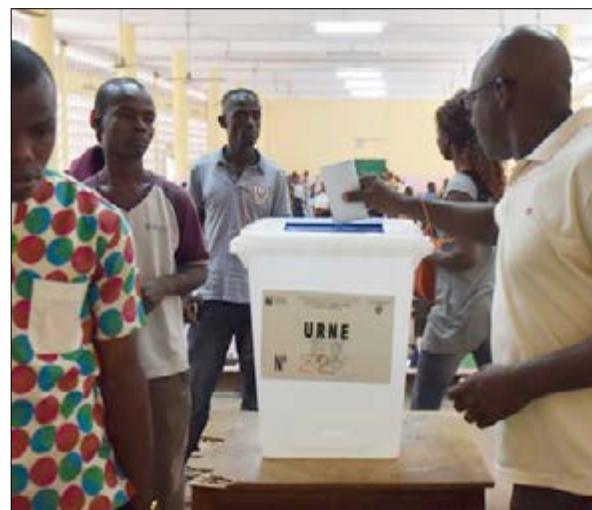
Des électeurs en train de voter

19 800 bureaux de votes étaient ouverts hier