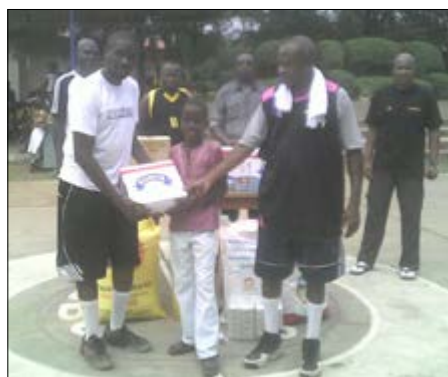
Remise symbolique de dons aux enfants

Les enfants du SOS Village d'enfants (VESOS) ont bénéficié de divers dons composés de vivres et non vivres, à l'issue d'un Gala de basketball qui s'est tenu le 17 Décembre dernier sur le terrain de Basketball du centre dans le quartier Wuiti à Lomé.