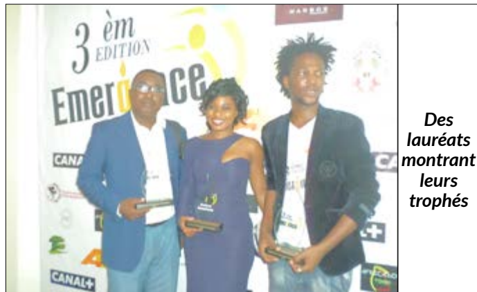
Des lauréats montrant leurs trophées

La 3ème édition du festival « Emergence » a finalement livré son verdict. En effet il a été question pendant 4 jours, de choisir les meilleurs films africains parmi les 20 mises en compétition.