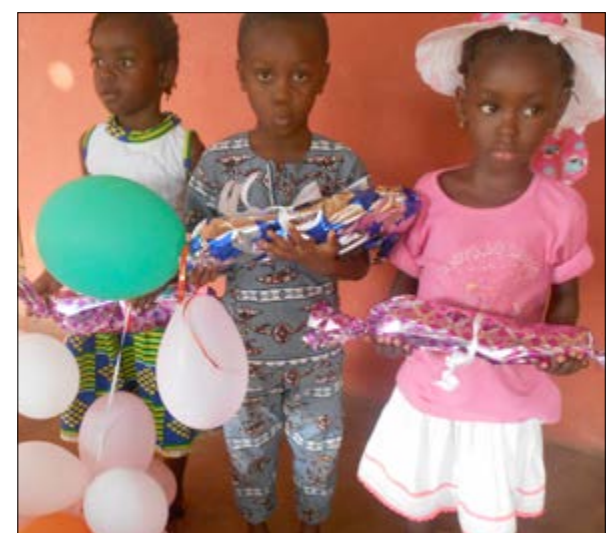
Des enfants avec des cadeaux reçus