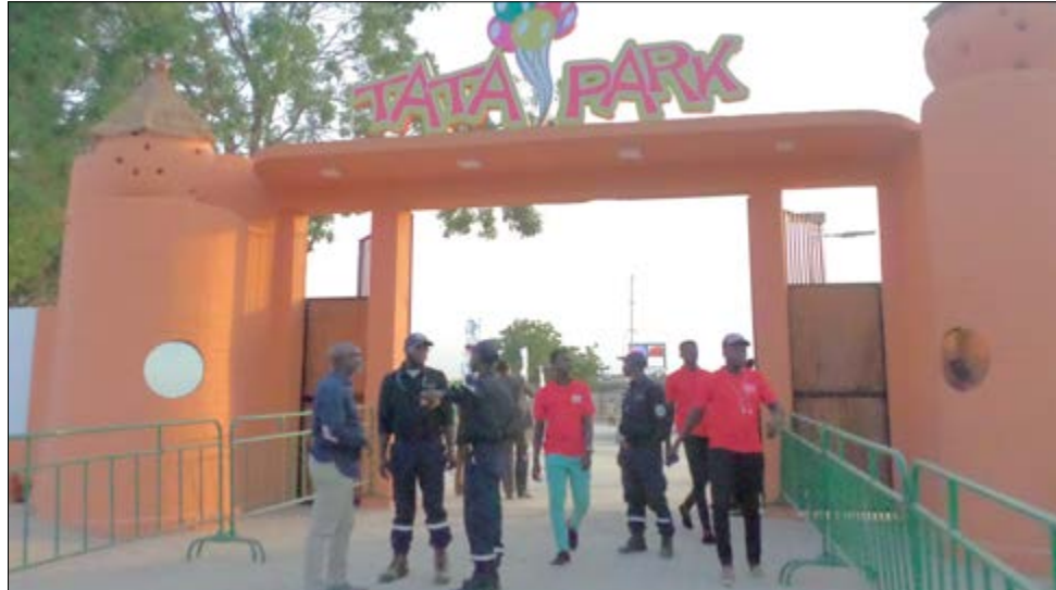
L'entrée du parc

Le nouveau parc d'attraction moderne au Togo dénommé Tata Park a été inauguré le 16 décembre dernier à Lomé. Il est situé en face du Centre Togolais des Expositions et Foires (CETEF).