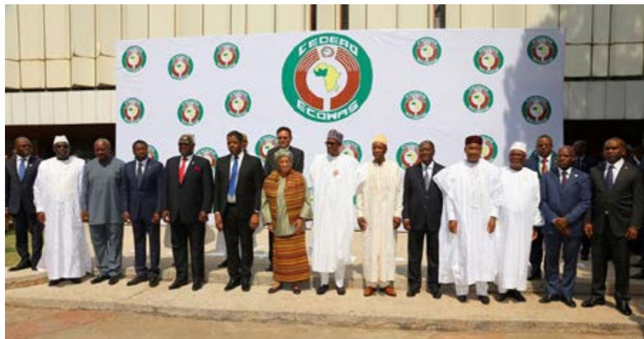
Photo de famille des Chefs d'Etat de la CEDEAO à Abuja

La Communauté économique des États de l'Afrique de l'Ouest (CEDEAO) a délégué les Présidents Muhammadu Buhari du Nigeria et son homologue ghanéen, John Dramani Mahama, respectivement médiateur en chef et co-médiateur afin de sortir la Gambie de l'impasse politique dans laquelle elle se plonge depuis le rejet des résultats de la présidentielle par le Président Yahya Jammeh.