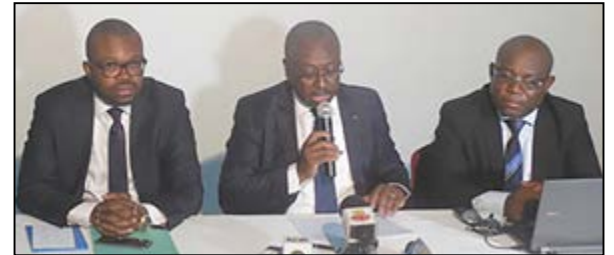
Le ministre G. Lorenzo (milieu) à l'ouverture de la cérémonie

La 3ème édition des Journées portes ouvertes (JPO) de la presse s'est tenue en fin de semaine dernière à Lomé.