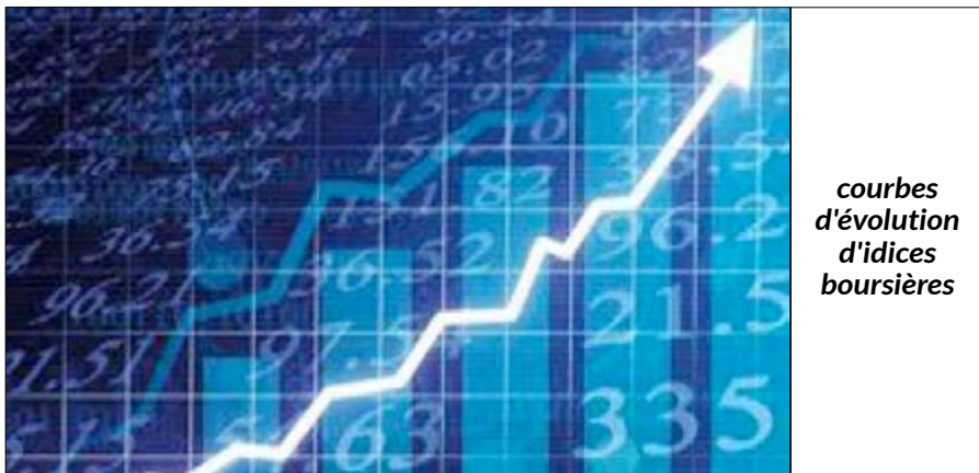
courbes d'évolution d'indices boursières

BOA Capital et de son partenaire BMCE Capital ont lancé le West African Economic and Monetary Union Bond Index (WBI), un indice de suivi des titres obligataires souverain, Présenté le 14 décembre 2016 à Dakar.