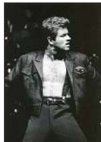
Le chanteur britannique aux plus de 100 millions d'albums vendus est