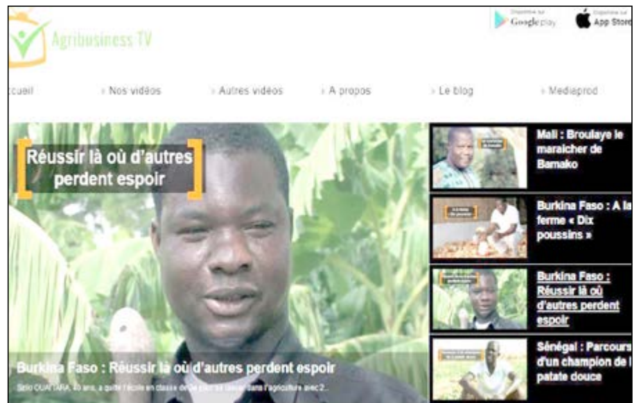
Interface de Agribusiness TV

Le Prix francophone de l'innovation dans les médias est le fruit d'un partenariat entre l'OIF, RFI et RSF. Il s'adresse à tous les médias (radio, télévision, presse écrite et médias numériques) des 58 États et gouvernements membres de la Francophonie ayant développé des offres innovantes prenant en compte les nouveaux modes de consommation et d'accès à l'information. Il récompense les innovations dans les contenus, dans les usages et dans les modèles