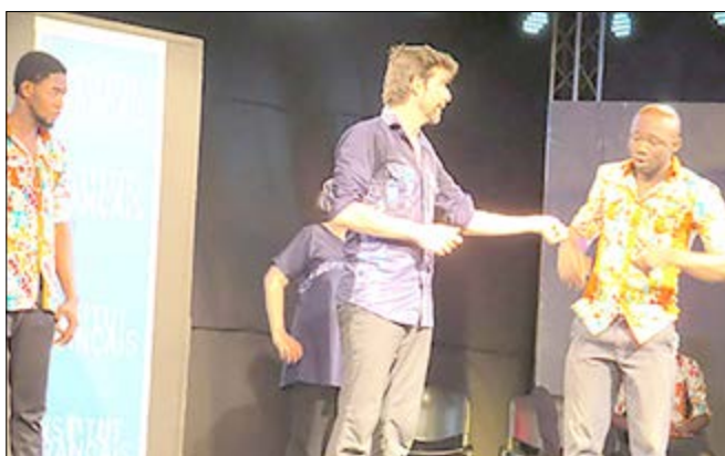
Des comédiens sur scène

Le match d'improvisation théâtrale a été créé le 21 octobre 1977 au Québec sous la gouverne du Théâtre Expérimental de Montréal par Robert Gravel qui souhaitait expérimenter de nouvelles formes théâtrales et approches du public.