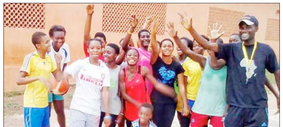
Des participants au tournoi

Depuis 2013, la BPW sillonne tout le Togo en organisant des tournois de la balle orange pour des jeunes et de la sensibilisation. Cette 5 e édition ne dérogera pas à la règle. Placé sous le thème « Miledou contre la traite des humains », la BPW passera, du 5 au 16 avril, dans 10 villes et villages du Togo. « Nous irons à Avépozo