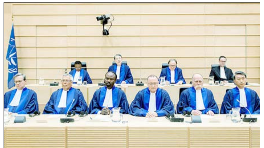
Des juges siégeant à la CPI

Nations Unies a le pouvoir d'imposer des sanctions, une telle démarche ne devrait pas mener à bien plus qu'à une petite tape sur les doigts, d'après les experts.