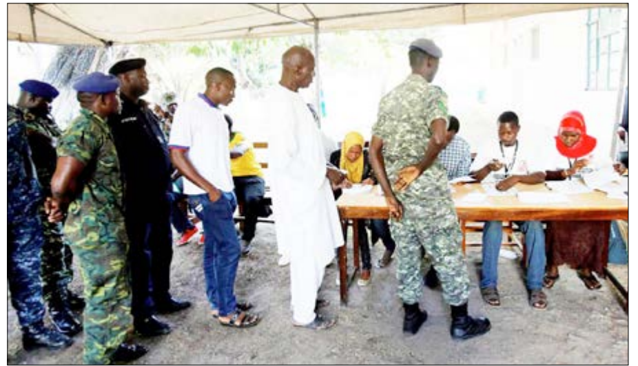
Des électeurs en Gambie

Les résultats du vote seront diffusés dès ce soir à la télévision nationale et dans les radios jusqu'à vendredi. Les partis qui ont présenté des candidats aux législatives sont l'UDP de l'avocat Ousainou Darbo avec 44 candidats, le GDC de Mamma Kandeh avec 52