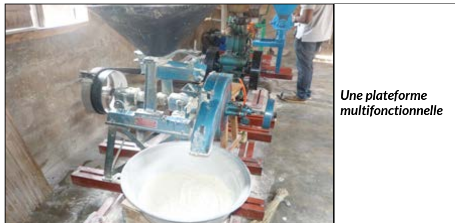
Une plateforme multifonctionnelle

Pendant sa tournée dans le Haho, le ministre du développement à la base, de l'artisanat, de la jeunesse et de l'emploi des jeunes, Mme victoire Tomégah-Dogbé a rejoint à Akakegan, localité située à 20 km de Notsè, les membres des comités de gestion des plateformes multifonctionnelles en congrès régional.