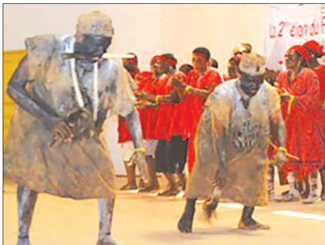
Groupe-ASSAFOU de Benali lors de la prestation de preselection

C'est aussi une occasion pour les différents groupes folkloriques de mettre en valeur leurs talents afin de