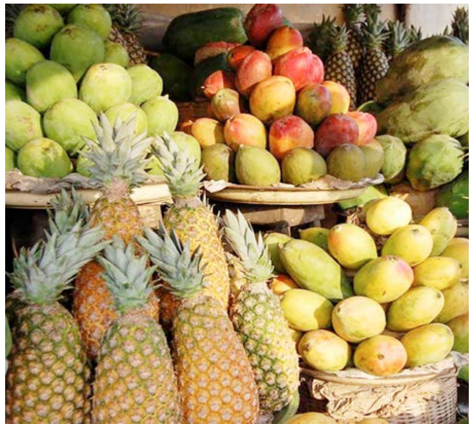
Un étalage montrant une variété de fruits

La culture des arachides au Togo s'inscrit quant à elle dans la continuité du projet durable de la filière ananas. Pour assurer la rotation des sols et toujours bénéficier de terres riches, les producteurs alternent les productions