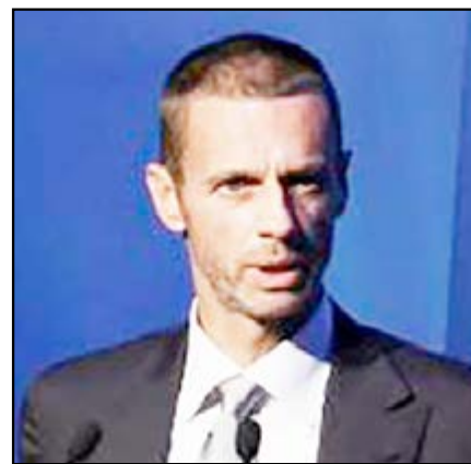
Aleksander Ceferin, Président de l'UEFA

ont été également élus pour siéger au Conseil de la Fifa pour un mandat de quatre ans: Sandor Csányi (Hongrois), Costakis Koutsokoumnis (Chypre) et Dejan Savićević (Monténégro).