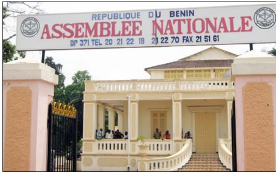
Assemblée nationale béninoise

Après le refus des élus béninois de réviser le texte du gouvernement Talon en procédure d'urgence, ils ont voté le mardi dernier contre la prise en considération du projet de révision constitutionnelle. Deuxième camouflet essuyé par ce texte en moins de 3 semaines pour ce texte qui se veut révolutionnaire pour ce petit pays de l'Afrique de l'Ouest.