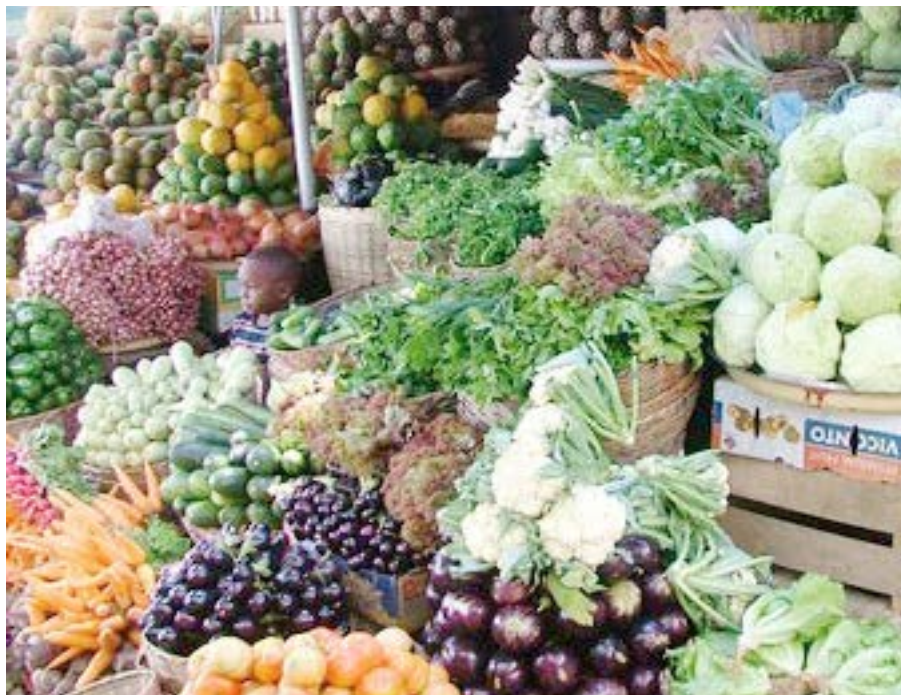
Des fruits et légumes dans un marché

condiment en cuisine. Une tête d'ail se compose de plusieurs caïeux ou gousses d'ail. Produit dans la région des Savanes, la région de la Kara, la région Centrale.