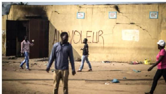
Libreville, le 1er septembre, au lendemain de l'annonce des résultats de l'élection présidentielle. Le candidat de l'opposition Jean Ping conteste toujours les résultats.

scrutin et pendant le scrutin du 27 août 2016. L'essentiel du document tient en quelques pages, il s'agit des constats. Ainsi, la compétence des organes de gestion du processus électoral ne peut être remis en cause, mais l'OIF pointe que les nombreux manquements observés dans l'organisation du vote dénotent un défaut de formation caractérisé des agents électoraux. Sur les recours, la mission relève l'absence de confiance des candidats dans la machine judiciaire, incapable d'un traitement équitable. « Une confiance très faible, voire inexistante. » Concernant le traitement médiatique, le rapport pointe qu'une fois les résultats provisoires prononcés, le 31 août, la balance de la couverture