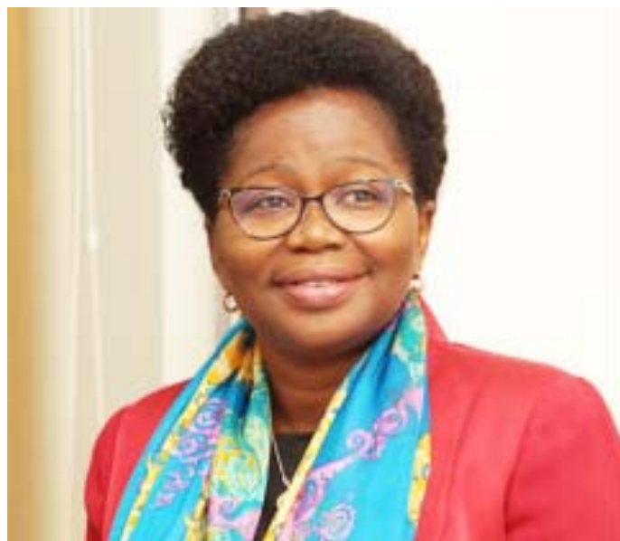
Mme Victoire Tomégah-Dogbé, Ministre du Développement à la base

Les services à réaliser dans le cadre de cette mission sont, essentiellement : la consultation avec le gouvernement et avec les partenaires (publics et privés) du PRADEB ; les visites de terrain pour constater les réalisations, les succès et les contraintes ; l'organi-