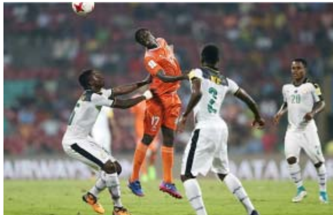
bre à Guwahati.

Dans leur huitième de finale face au Niger, les Black Starlets ont pris l'avantage en toute fin de première période, sur penalty. Le portier nigérien a repoussé un second penalty ghanéen en fin de match. Malgré la défaite, le Mena peut être fier de son parcours, pour la première participation nigérienne à une épreuve mondiale. De son côté, le Ghana a gagné le droit d'affronter une autre nation africaine au tour suivant, à savoir le Mali, le 21 octo-