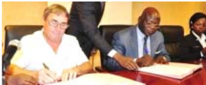
Signature des documents entre la CCIT et la CMA

D'après la même source, ce nouveau partenariat permettra aux deux parties de renforcer leurs secteurs privés. Il repose en grande partie sur la formation des entrepreneurs afin