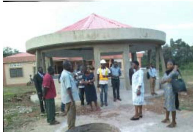
Visite à la maison de la femme de Sotouboua

Dans la région des plateaux, les magasins construits au marché d'Agbonou et d'Anié ont été visités. Ces magasins sont d'une grande utilité aux commerçantes et commerçants de ces lieux. « Avant la construction de ces magasins, ce sont sous des hangars de fortune que nous vendions et lorsqu'il pleut, nous avons beaucoup de problèmes. Mais maintenant, avec ces magasins, nous sommes plus à l'aise. Je préfère d'ailleurs y rester pour vendre parce que cela me réduit certaines charges de transports aussi » nous a confié très joyeuse, une revendeuse de céréales, la quarantaine rencontré à Anié. Comme cette dame, les commerçants de ces deux marchés, se sentent plus confortables sur les lieux d'exercice de leurs activités. Pour eux