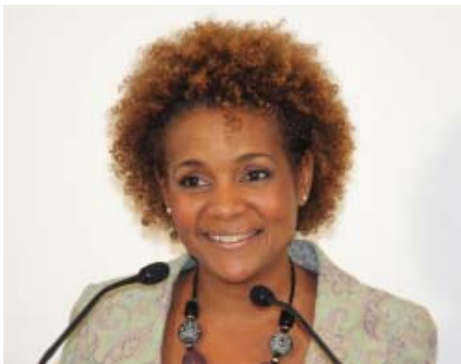
Madame Michaëlle Jean, Secrétaire générale de la Francophonie

De son côté, dans un communiqué publié le 18 octobre 2017, la Secrétaire générale de la Francophonie, Madame Michaëlle Jean, déplore l'escalade de la violence ces dernières semaines au Togo. « Rien ne peut justifier ces affrontements. Nous pensons aux victimes, aux familles endeuillées, au climat gé-