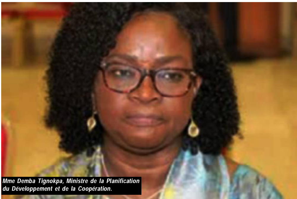
Mme Demba Tignokpa, Ministre de la Planification du Développement et de la Coopération.

*L'ambition du PND est de transformer structurellement l'économie du pays, pour une croissance forte, durable, résiliente, inclusive, créatrice d'emplois décents pour tous et induisant l'amélioration du bien-être social.