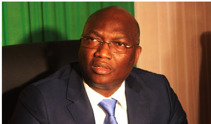
Col Kossi AKPOVY, Président de la FTF

Pour absorber les fonds du Programme Forward 2.0 de la FIFA, la FTF se lance dans un ambitieux programme de développement tous azimuts sur la période 2019-2022. "Après une série de crises que le football togolais a connu pendant des deux décennies, les nouveaux diri-