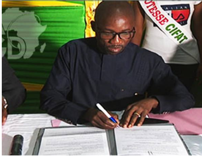
Noël Koutera BATAKA, Ministre de l'Agriculture signant le contrat

Séance tenante, le ministre de l'agriculture, Noël Bataka, représentant la partie gouvernementale, a signé un contrat-programme avec le Conseil interprofessionnel sur la période 2019-2022. Ce contrat définit clairement les ambitions pour la filière en termes de volumes, rendements et emplois à créer dans les quatre prochaines années. D'ici à 2022, la filière anacarde veut atteindre une production de 30.000 tonnes et créer 21.500 emplois. Et pour la seule année 2019, une production de 24.000 tonnes est atten-