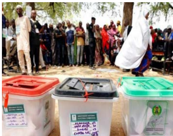
Des urnes au Nigéria

La mission des observateurs de l'Union européenne a constaté des « manques systémiques » au cours des élections de début 2019.