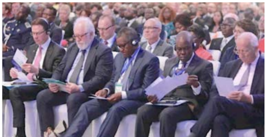
Des investisseurs dont Aliko Dangote (au milieu)

Dans le registre de la lutte contre la corruption, l'Etat togolais a procédé, depuis décembre 2012, à la création de l'Office Togolais des Recettes (OTR), la fusion au sein d'une seule structure des deux régies financières du Togo, notamment la Douane et le Service des Impôts. Cet office, au-delà de son rôle de recouvrer les impôts, taxes et droits de douanes pour le compte de l'Etat et des Collectivités locales, se veut aussi un modèle d'innovation qui, non seulement accélère les procédures de formalité, mais