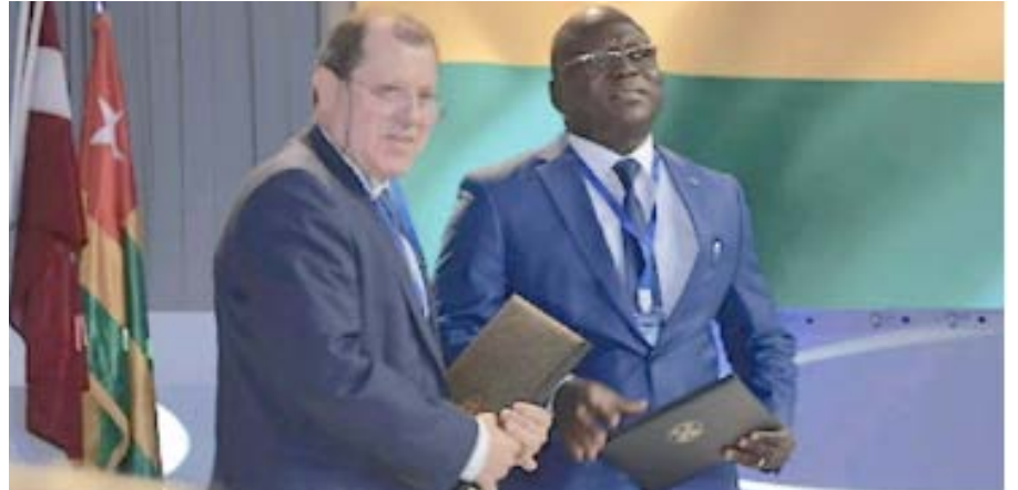
Signature des accords avec la Chambre de commerce togolaise

En ce qui concerne la création d'entreprises, le Centre de Formalités des Entreprises (CFE) a vu le jour en 2006 pour simplifier et faciliter les démarches de création des entreprises. Aujourd'hui, grâce à cette réforme, il est possible de créer son entreprise en moins de 07h de temps, et à un coût réduit. 29.250 CFA. De même que la publication de l'annonce légale sur le site du CFE est passée de 5000 FCFA auparavant