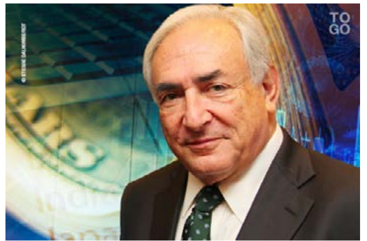
Dominique Strauss Kahn

Toutefois et c'est très important, ce n'est pas le moment de dormir sur nos lauriers. Le travail ne fait que commencer. Les efforts doivent se poursuivre. « Il faut à l'arrivée que ce qui a été décidé soit exécuté et cela dans un bref délai », précise Dominique Strauss Kahn. L'expert français pense que l'intégration reste un élément