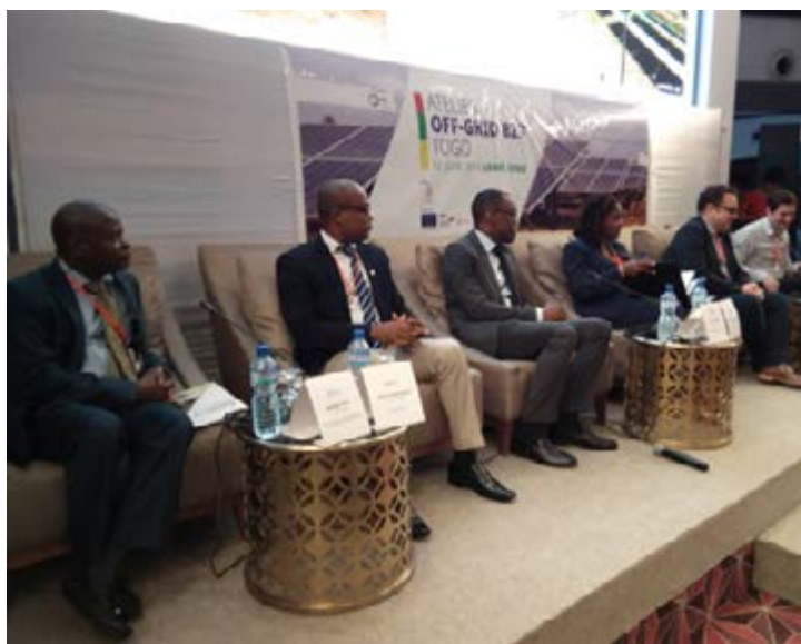
Les officiels lors de la Journée Off Grid B2B Togo

Avec une capacité de production pouvant couvrir 65% de sa consommation d'énergie, le Togo sollicite ses voisins pour combler le déficit énergétique. Pour réduire cette dépendance et permettre à bon nombre de Togolais surtout en zone rurale d'accéder à l'électricité, le gouvernement s'est engagé activement dans la fixation d'objectifs nationaux ambitieux visant à augmenter le taux d'électrification à 50% d'ici 2020 et à 100% d'ici 2030. La priorité politique donnée à l'énergie crée ainsi une dynamique forte et hausse l'attractivité du marché togolais pour les entreprises togolaises et étrangères.