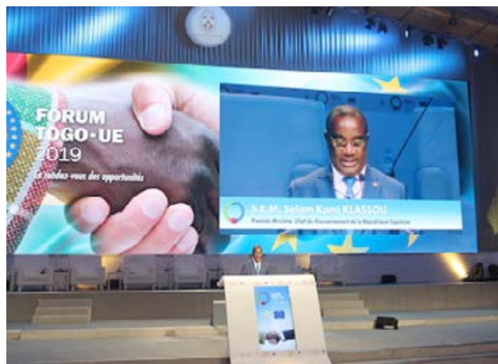
Le Premier ministre prononçant son discours à la clôture du Forum

D'autres accords ont également été signés dans le secteur de l'agriculture. Le Mécanisme incitatif de financement agricole fondé sur le partage de risques (Mifa) et la société allemande Better Eco ont signé une lettre d'intention. Dans 3 mois, un mémorandum d'entente et une convention seront signés entre les deux institutions pour la production biologique selon les normes de qualité internationales et la commercialisation sur le marché international des produits togolais comme le gingembre, le soja, le sésame, l'anacarde, l'ananas et le karité.