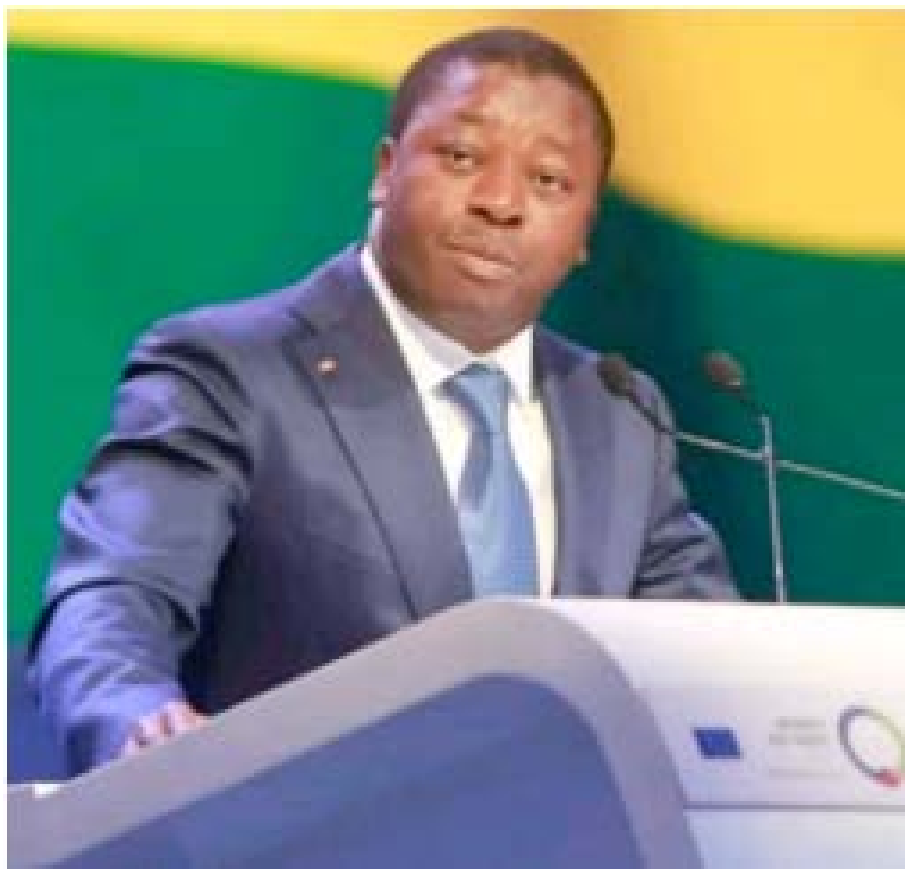
Faure Gnassingbé ouvrant officiellement le Forum

En ce qui concerne la création d'entreprises, le Centre de Formalités des Entreprises (CFE) a vu le jour en 2006 pour simplifier et faciliter les démarches de création des entreprises. Aujourd'hui, grâce à cette réforme, il est possible de créer son entreprise en moins de 07h de temps, et à un coût réduit. 29.250 CFA. De même que la publication de l'annonce légale sur le site du CFE est passée de 5000 FCFA auparavant