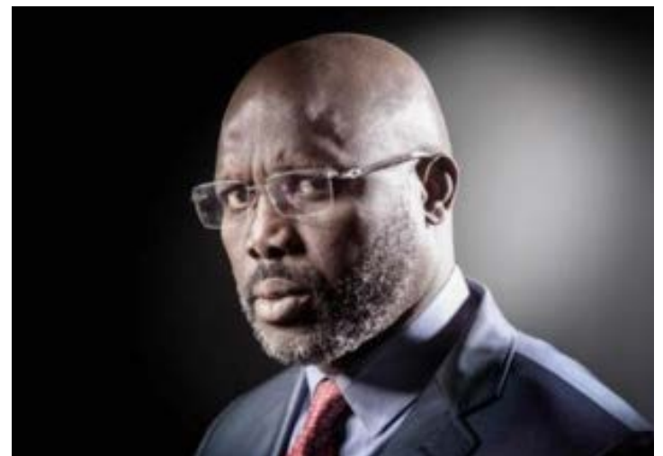
Georges Weah, ancien footballeur et actuel président libérien

« Le foot m'a sauvé la vie » L'homme politique a surtout reconnu à quel point le football lui a rendu service : « Le football m'a appris les valeurs traditionnelles comme le travail, le respect, la volonté, la ponctualité ou la discipline. Mais au-dessus de tout, il m'a permis de mieux connaître les hommes. Le foot est une vraie école de la vie ». « C'est le football qui m'a sauvé la vie en m'offrant