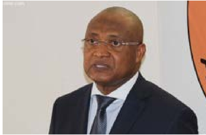
Jean-Pierre Fabre, président de l'ANC

me traitez de tous les mots sur les réseaux sociaux, sur les radios et les autres médias. Je m'en fous », a-t-il lancé à l'endroit de ses détracteurs avant de leur poser une question rhétorique : « Est-ce que je suis allé à la C14 en vous demandant la permission » ? Il répond lui-même : « Non. Je suis allé à la C14 pour travailler ». Le