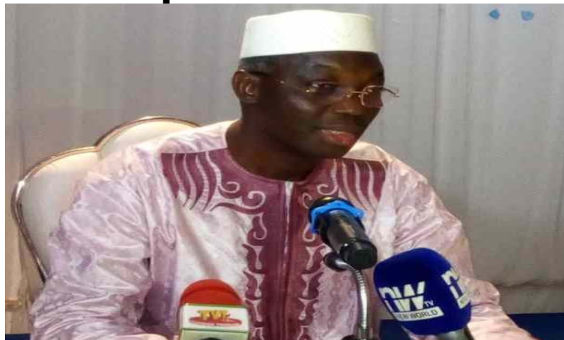
Gal Yark Damehame, ministre de la Sécurité et de la protection civile