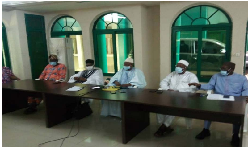
La table d'honneur lors de la conférence de presse

Les musulmans du Togo ont débuté le vendredi 24 avril dernier, le jeûne du mois de ramadan. Une période qui, malheureusement coïncide avec la maladie de coronavirus. Bien que le moment n'est pas propice aux musulmans pour se retrouver et prier ensemble dans les mosquées, l'Union Musulmane du Togo (UMT) dans sa démarche auprès des autorités, a permis à ce que les muezzins puissent lancer des appels à la prière depuis les mosquées.