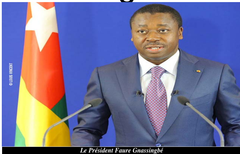
Le Président Faure Gnassingbé

Tout est désormais clair et les signaux habituels se font sentir dans la masse. Outre les mouvements occultes de ceux qui croient ou pensent être en mesure d'occuper des postes ministériels, il y a cette tradition des mercenaires de la plume qui refait surface et ceux qui s'adonnent à cela le font avec un plaisir vicieux mélangeant tout.