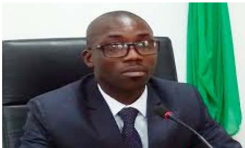
Noël Bataka, ministre en charge de l'Agriculture

L'objectif que vise ce plan est d'arriver à assurer aux ménages ruraux une sécurité alimentaire et multiplier à terme leur revenu habituel