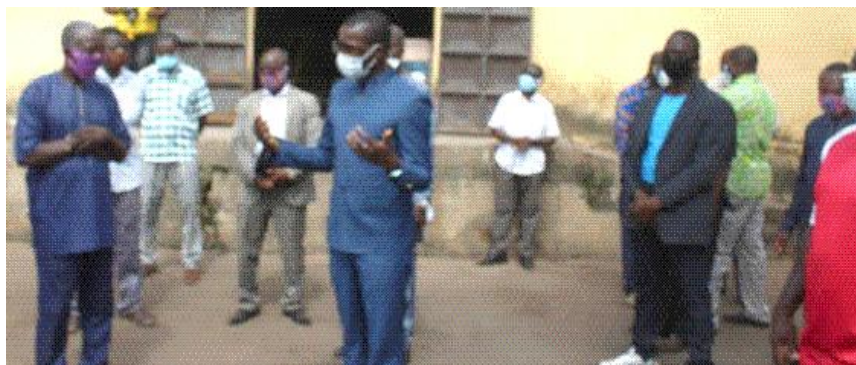
Le ministre Bataka (milieu) en échange avec certains acteurs agricoles

fecture de l'Ogou). A ces trois endroits stratégiques, Koutéra Bataka a constaté de visu la disponibilité des intrants agricoles aux agriculteurs. On apprend que cette année, afin d'assurer la sécurité alimentaire et nutritionnelle, une panoplie d'intrants a été déployée. On y compte des tracteurs, des semences améliorées et des engrais.