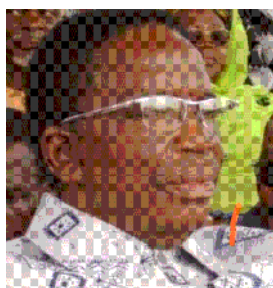
Feu Yawovi Agboyibo

Selon l'Ambassadeur des USA au Togo, l'ancien premier ministre est un pionnier de la protection des Droits de l'homme, du multipartisme au Togo. Il était le symbole du pragmatisme en politique.