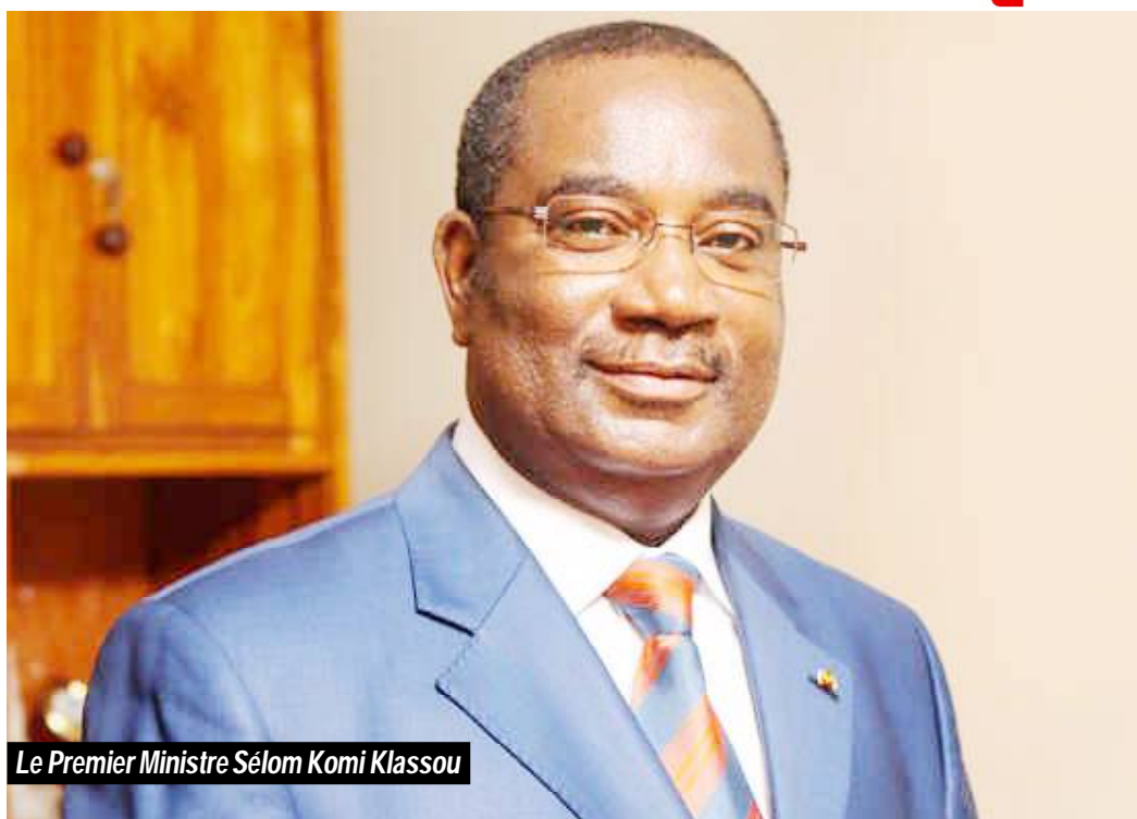
Le Premier Ministre Sélom Komi Klassou

Selon la Cour Constitutionnelle, la décision est conforme à la constitution