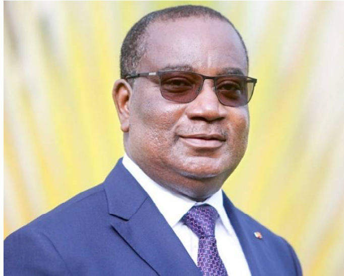
Komi Sélom Klassou, Premier Ministre

On se rappelle que la Cour avait déjà autorisé une première prorogation de quarante-cinq (45)