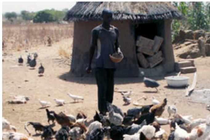
Un éleveur dans les Savanes

Et en juillet 2020, 50 plans d'affaires ont été décaissés par les institutions financières partenaires, pour