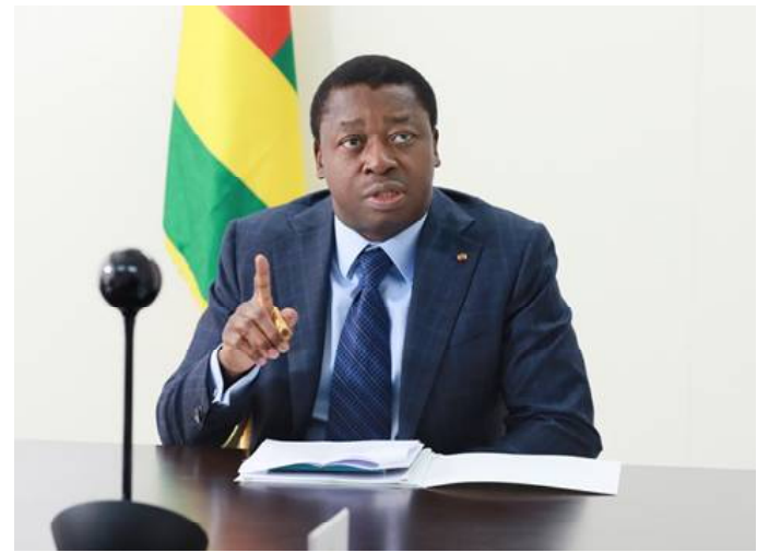
Le Président Faure Gnassingbé

Gestion du secteur public et institutions . En 2018, neuf pays ont amélioré leur note globale pour le groupe de la gouvernance. Plus particulièrement, cinq pays fragiles (la République centrafricaine, la Côte d'Ivoire, l'Érythrée, la Gambie et le Togo ) ont vu leurs notes globales en matière de gouvernance augmenter. Cette évolution est encourageante car, pour sortir de la fragilité, il faudrait renforcer les politiques et les institutions de gouvernance. Cependant, les améliorations semblaient modestes, soit une augmentation de 0,1 point par rapport à la note de 2017.