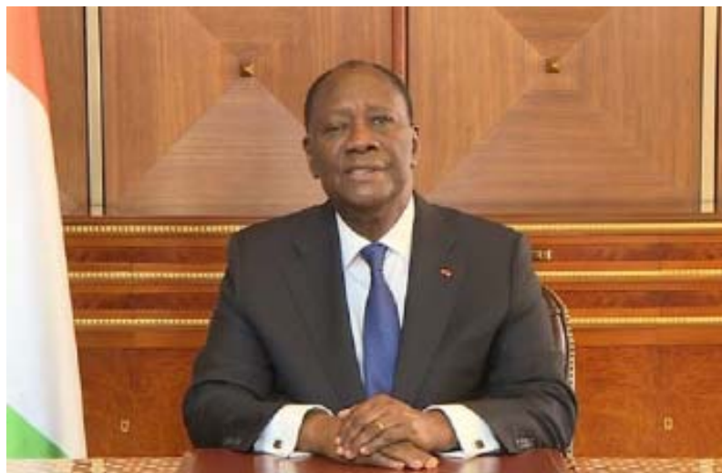
Alassane Dramane Ouattara

Aux États-Unis, considérés comme la première démocratie du