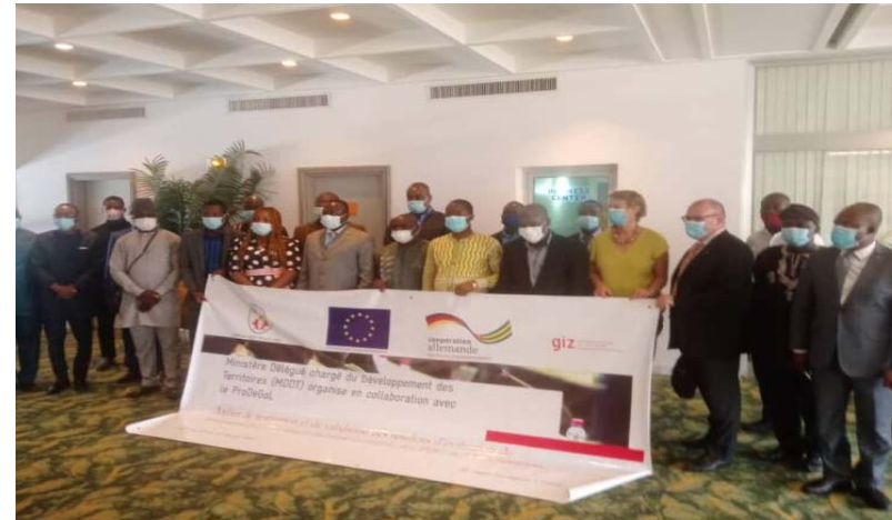
Photo de famille

Durant deux jours, cette rencontre a regroupé les directeurs généraux venus du ministère de l'aménagement du territoire, de la décentralisation et des collectivités locales, les représentants de l'Ecole Nationale d'Administration (ENA), de l'Université de Kara, les directions régionales de la planification, les communes (Zio 1 ; Kloti 1 ; Ogou 1 ; Tchoudjo 1 ; Kozah 1 et Tône 1) ainsi que les partenaires techniques et financiers (Union européenne, Coopération allemande, PNUD et OIF).