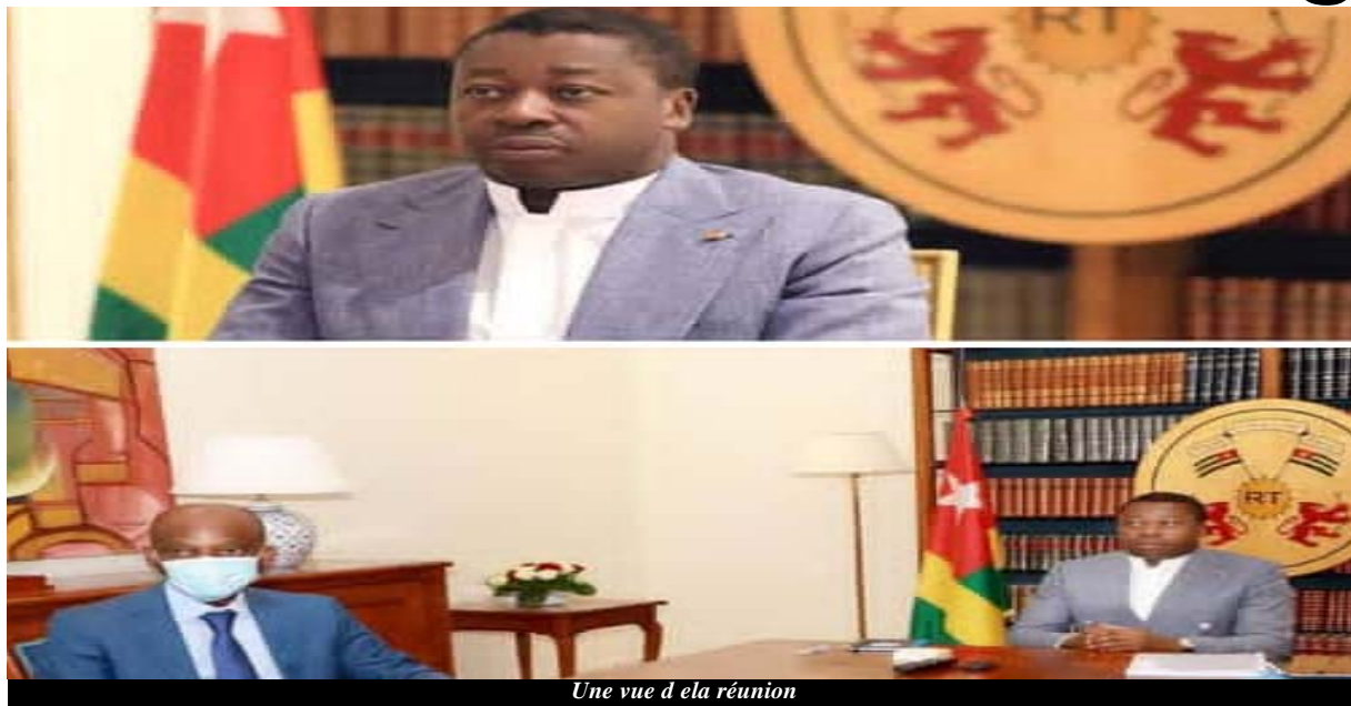
Une vue de la réunion

Faure Gnassingbé a pris part à cette rencontre par vidéoconférence. Le Président de la République et ses pairs ont eu l'honneur de lancer officiellement le thème de cette année 2021 consacré "aux arts, à la culture et au patrimoine du continent". Cette 34e session de la Conférence