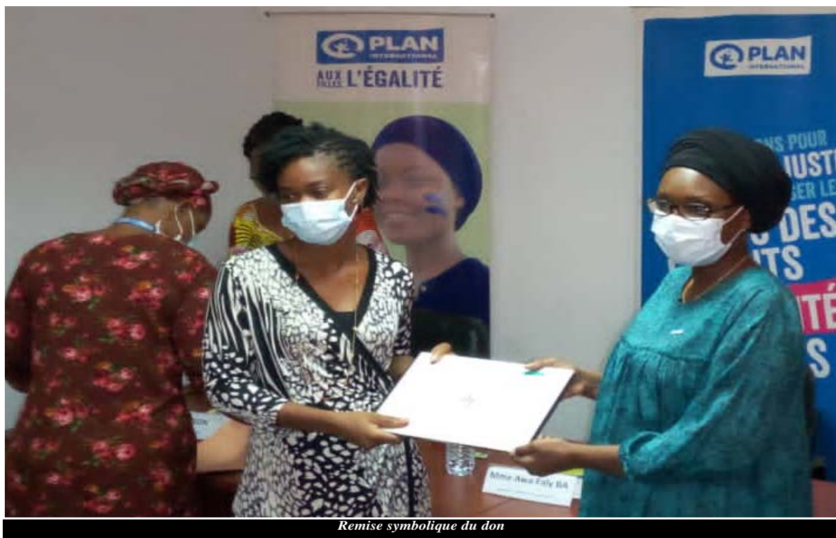
Remise symbolique du don