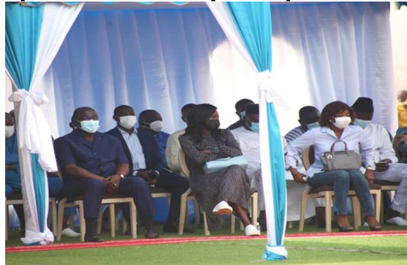
Une vue de l'assistance