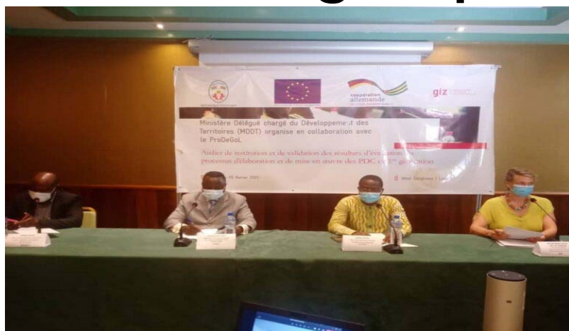
Les officiels lors de la rencontre

Le jeudi 04 février dernier, il a été organisé à Lomé un atelier de validation du rapport d'évaluation sur l'élaboration et la mise en œuvre des Plans de Développement Communaux (PDC). Cet atelier vise une actualisation du "Guide d'élaboration d'un Plan de développement à l'usage des collectivités territoriales".