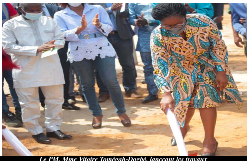
Le PM, Mme Vitoire Tomégah-Dogbé, lançant les travaux

La politique des grands travaux prônée par le Chef de l'Etat Faure Gnassingbé continue avec la réhabilitation de certaines routes du pays. C'est dans cet élan et au regard des engagements pris par le gouvernement que Mme le Premier ministre, Victoire Tomégah-Dogbé a officiellement lancé le samedi 6 février