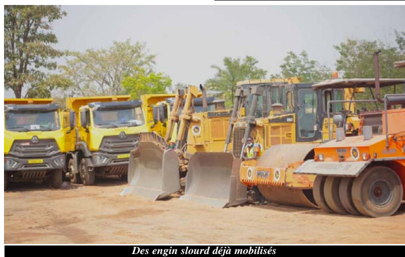
Des engin slourd déjà mobilisés

dernier, à Sagbadaï dans la Région Centrale, les travaux de réhabilitation de la route Sokodé-Bassar, longue de 75 km sur la Route Nationale 17.