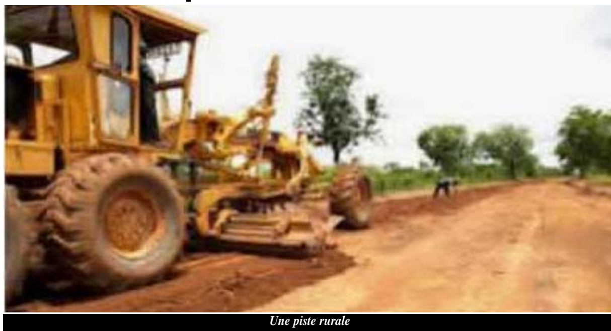
Une piste rurale

mois après la période propice à l'exécution de ces travaux, certaines entreprises traînent à démarrer. Le communiqué signé du ministre du désenclavement et des pistes rurales, Tchédé-Issa précise que, 4 mois après le début de la période favorable pour les travaux, le Gouvernement est au regret de constater que certaines entreprises titulaires des marchés n'ont toujours mobilisé sur le terrain le matériel et le personnel minimal requis, accusant ainsi des retards préjudiciables aux