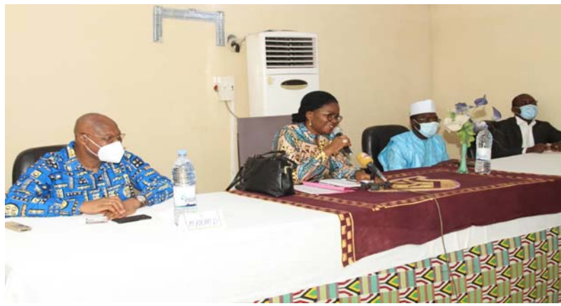
Les officiels lors de la rencontre

Mme le Premier Ministre Victoire Tomégah-Dogbé était dans la région centrale dans le cadre du lancement de la route Sokodé-Bassar. Faisant une pierre deux coups, Mme le PM a poursuivi sa visite par une rencontre à Sokodé avec des femmes des unités de coopérative des femmes transformatrices de graines de néré en moutarde venues des cinq préfectures