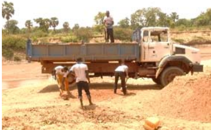
Sable, principal pourvoyeur des sites clandestins