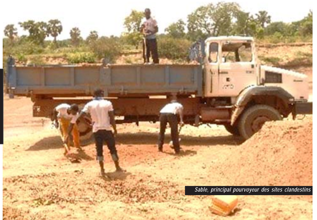
Sable, principal pourvoyeur des sites clandestins

"Le Togo exporte aussi de l'or produit au Togo. N'y aurait-il pas une possibilité d'accompagner les acteurs à mieux reconnaître les gîtes primaires et à les exploiter de façon organisée?" s'est demandé le consultant