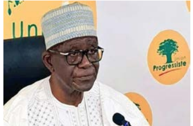
Amoussou Bruno, président de l'Union progressiste