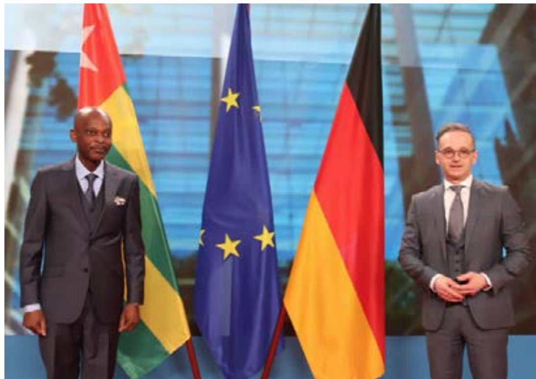
Professeur Robert Dussey (à droite) et son homologue allemand Heiko Maas

Le ministre togolais des Affaires étrangères, de l'Intégration africaine et des Togolais de l'extérieur, le professeur Robert Dussey, a entamé une visite de travail en Allemagne cette semaine. Le chef de la diplomatie togolaise a eu plusieurs séances les unes plus intéressantes que les autres. L'Allemagne et le Togo veulent redynamiser leur coopération en opérant des réformes.