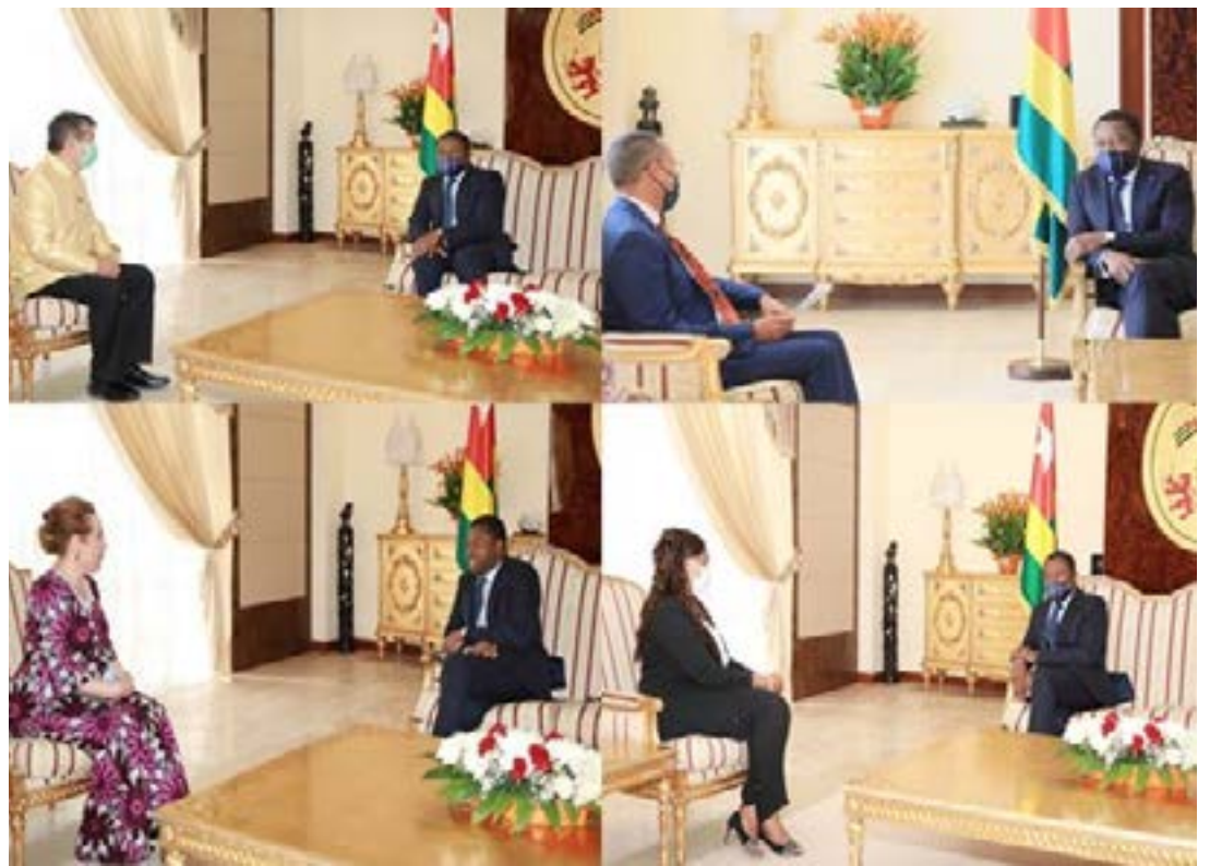
Vue de quelques diplomates en discussion avec Faure Gnassingbé