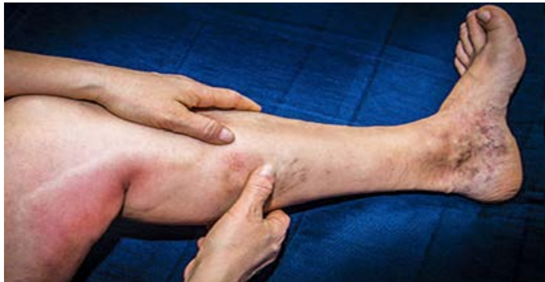
Une jambe atteinte de thromboses

Dans un contexte de Covid-19 où le vaccin Astra Zeneca se retrouve au centre d'une polémique liée à la formation de thromboses, il est nécessaire de se tourner vers les spécialistes pour comprendre tous les contours de l'affaire. Astra Zeneca est-il à la base de la formation de caillots de sang chez certaines personnes ? Le nombre de cas enregistrés dans certains pays suffit-il pour aboutir à une telle conclusion ? Et puis, qu'est-ce qu'une thrombose ?