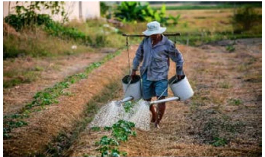
Un paysan usant de la méthode traditionnelle

Voici cinq techniques adaptées pour mieux pratiquer l'agriculture et la diversifier pour de meilleurs résultats.