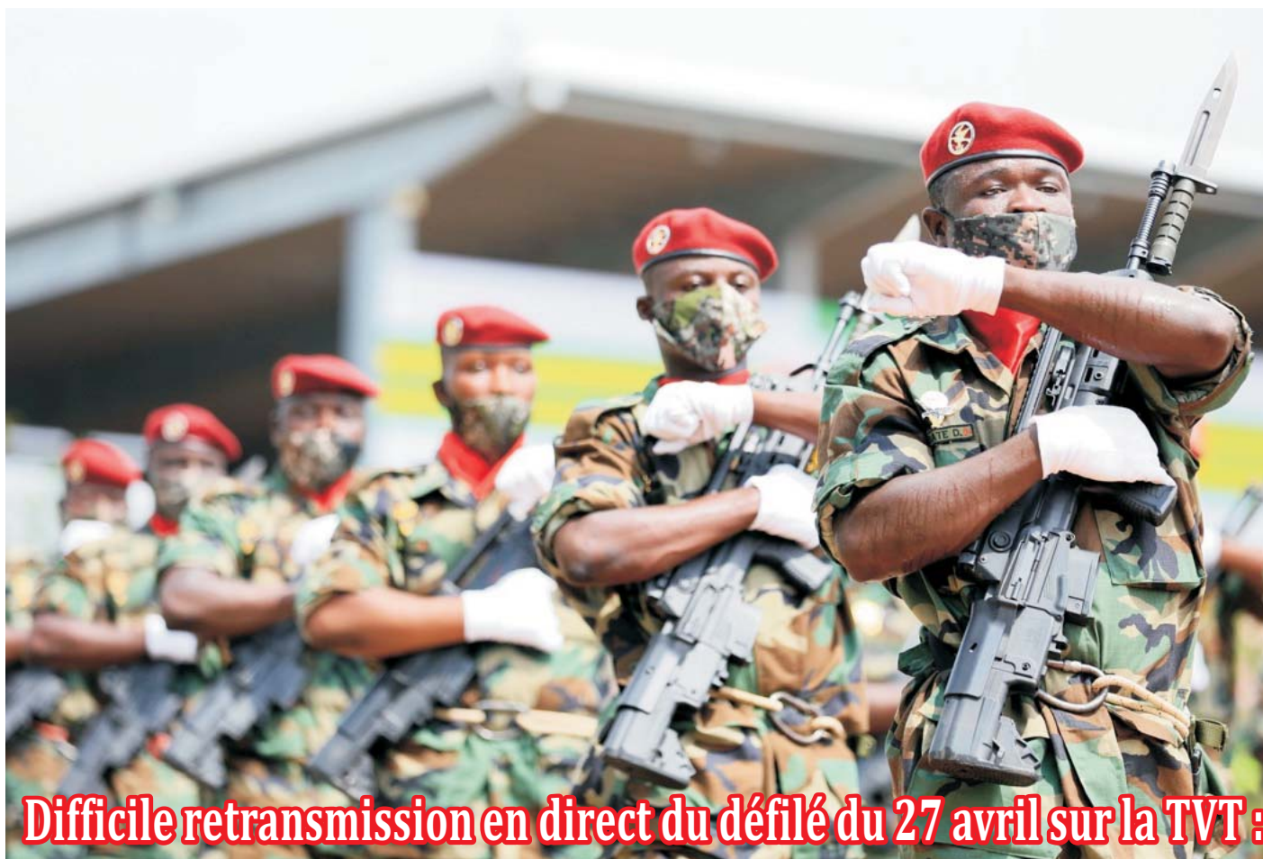
Difficile retransmission en direct du défilé du 27 avril sur la TVT :