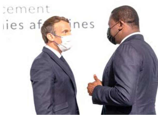
Faure Gnassingbé (à droite) en discussion avec Emmanuel Macron, à Paris

En dehors des DTS, il est aussi question de mobiliser des moyens à travers des plans d'aide bilatéraux et multilatéraux. Plusieurs organisations économiques internationales y sont favorables. Il s'agit de la Banque Africaine de Développement, de la Société Financière Internationale du groupe de la Banque mon-