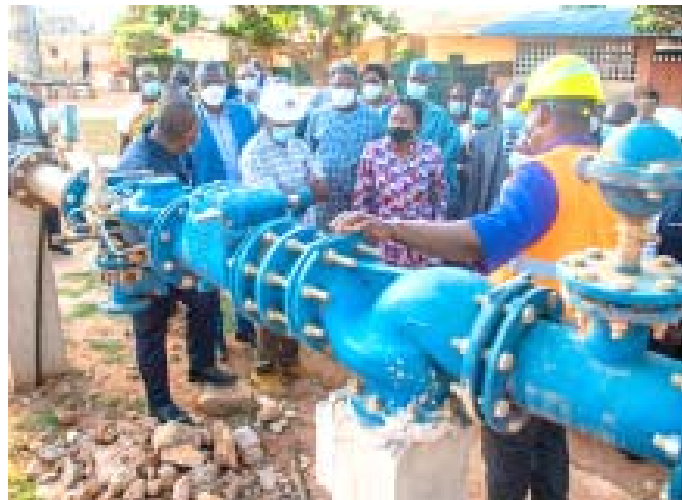
Victoire Tomégah-Dogbé suivant les explications sur le chantier

On était vers la fin mars 2021 et un message officiel du ministère de l'Eau et de l'hydraulique villageoise indiquait que les travaux de construction et de réhabilitation de trois châteaux d'eau à Lomé, démarrés au cours du second semestre 2020, devraient être achevés fin avril 2021. Parlant d'un état d'avancement satisfaisant. Ce mercredi 19 mai 2021, le Premier ministre, Mme Victoire Tomégah-Dogbé, était sur les chantiers pour, dit-on, s'enquérir de l'état d'avancement des travaux de ces ouvrages vitaux. Elle a trouvé des prestataires en pleins travaux sur les trois ouvrages. La délégation gouvernementale a successivement visité le nouveau château d'eau modulaire de Kodjoviakopé (ou Boka Nyékonakpoè), d'une capacité de 500 m 3 extensible à 1000 m 3 ; l'ancien château de Bè en cours de réhabilitation, avec un forage déjà réalisé et dont le raccordement est en cours avec le château, d'une capacité de 3000 m 3 et un débit de 216 m 3 /h ; et le nouveau château d'eau modulaire construit au sein de l'école primaire publique d'Adjougba à Agoè, d'une capacité de 500 m 3 extensible à 1000 m 3 , déjà opérationnel mais dont des raccordements supplémentaires sont en cours