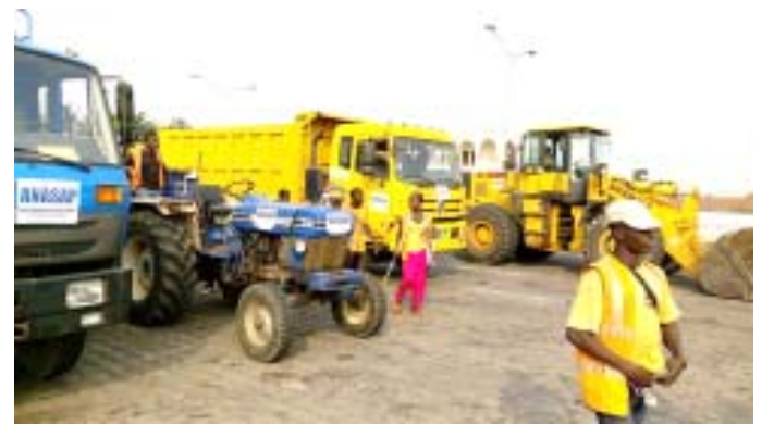
Le matériel roulant de l'ANASAP va aider à transporter les ordures, avec l'argent reçu

Les sommes perçues par le district autonome du Grand Lomé servent à la prise en charge du fonctionnement du Centre d'entretien technique d'Aképe et du transport des ordures des com-