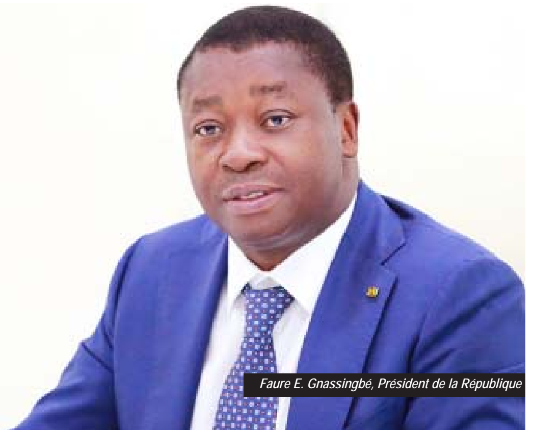
Faure E. Gnassingbé, Président de la République

Selon Faure Gnassingbé «cette initiative portée par Emmanuel Macron permettra de poser les bases de la croissance et de renforcer la résilience des économies africaines».