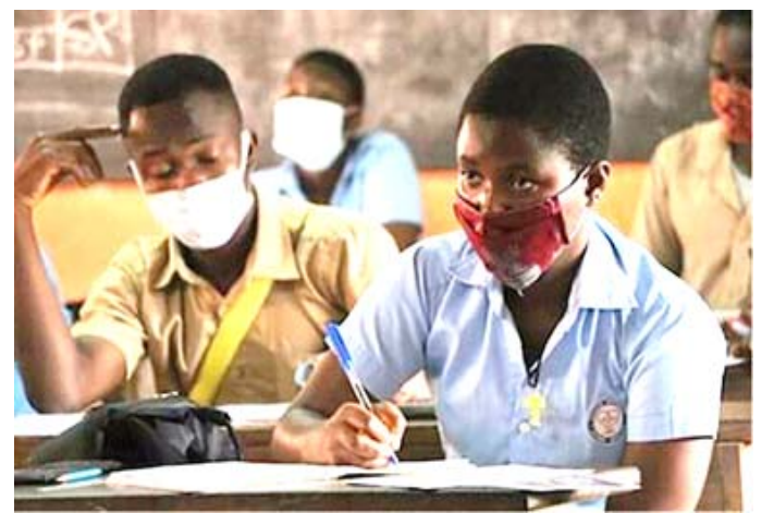
Des élèves à l'examen écrit.

Depuis le 11 mai dernier, une décision interministérielle, encore du même trio, fixe le calendrier of-