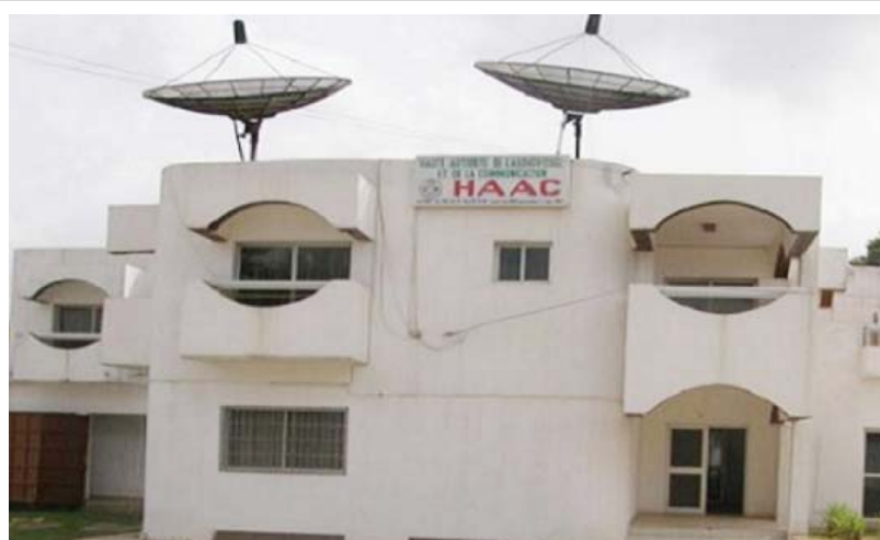
Le siège de la HAAC à Lomé

Il est vrai que de tous ceux qui ambitionnent de faire partie de la nouvelle