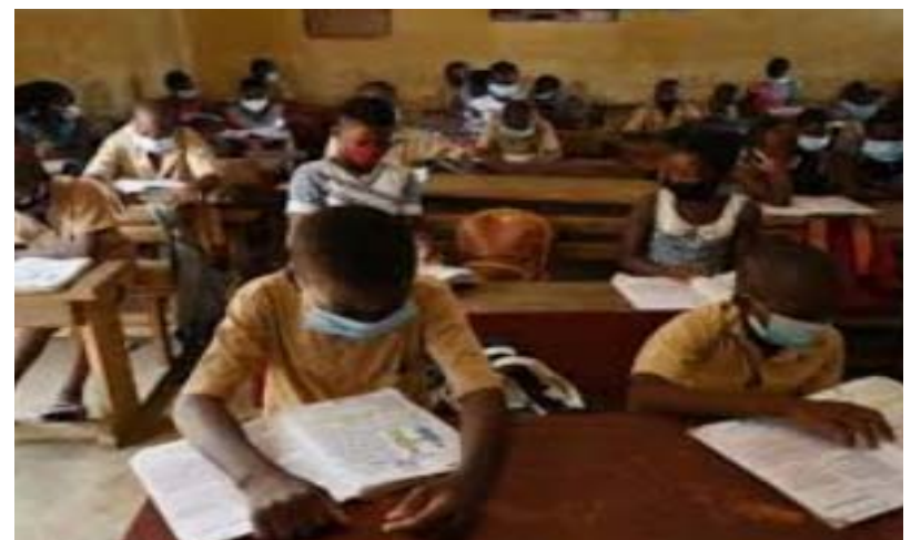
Des élèves en classe

En effet il a été remarqué des cas récurrents