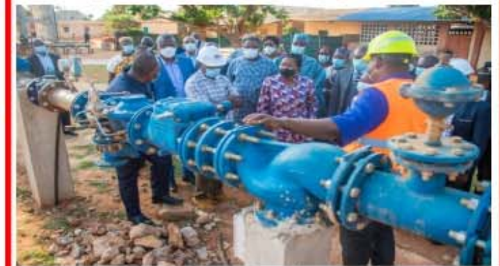
La délégation du PM Dogbé sur un chantier.