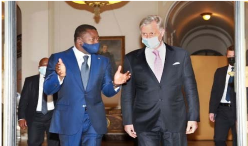
Le Président Faure Gnassingbé (g) échangeant avec le Roi Philippe (dt)

namisé ses relations avec les pays de l'Europe, à la recherche d'opportunités pour ses différents secteurs d'activités. Les missions diplomatiques du Togo font par exemple de