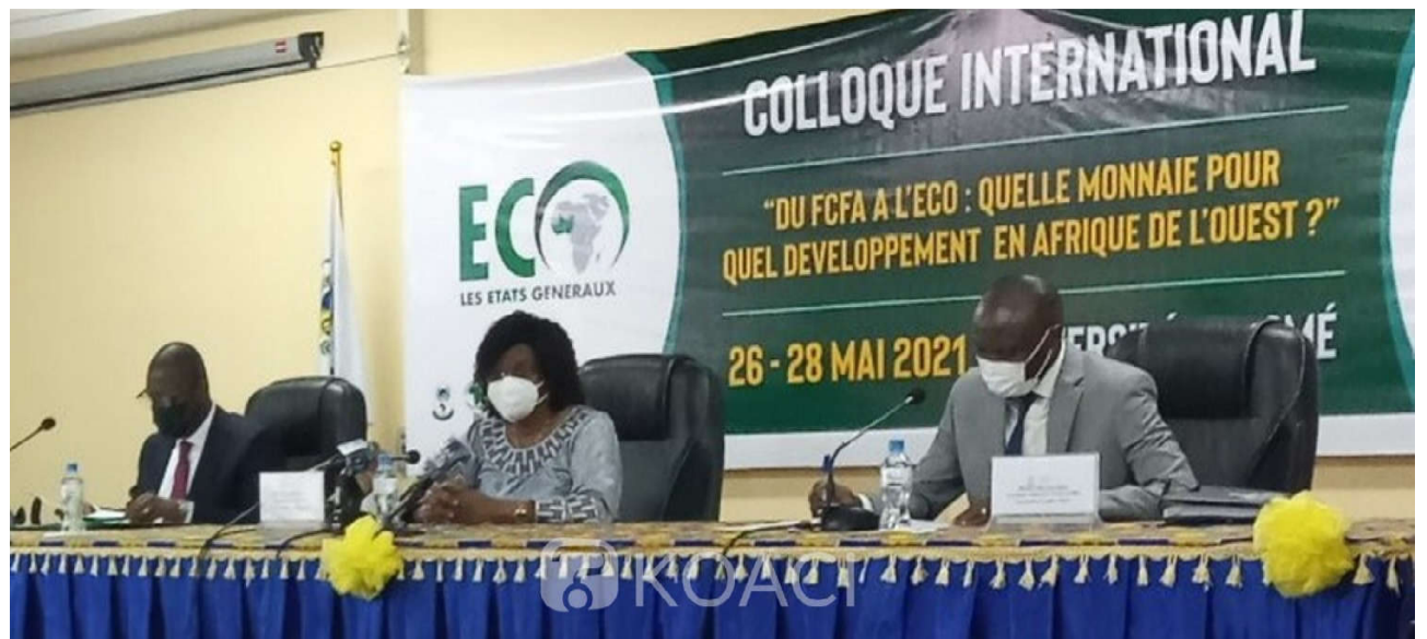
Les panélistes au colloque