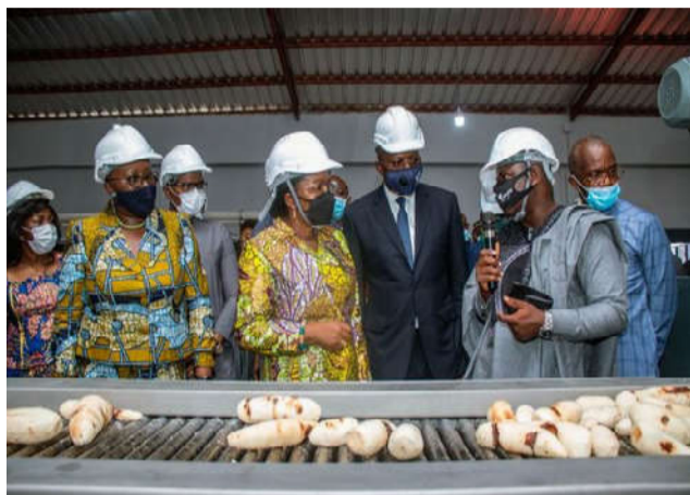
Le PM en visite dans l'usine

Le nouveau complexe industriel jouit d'une capacité de transformation annuelle de 15.000 tonnes soit en moyenne 50 tonnes par jour. Il dispose d'une chaîne de production d'amidon à grande échelle. L'initiative a bénéficié de l'appui financier de la Banque Africaine de Développement (BAD) avec une enveloppe de 1,3 milliards de francs CFA et du Projet d'Appui à l'Employabilité et