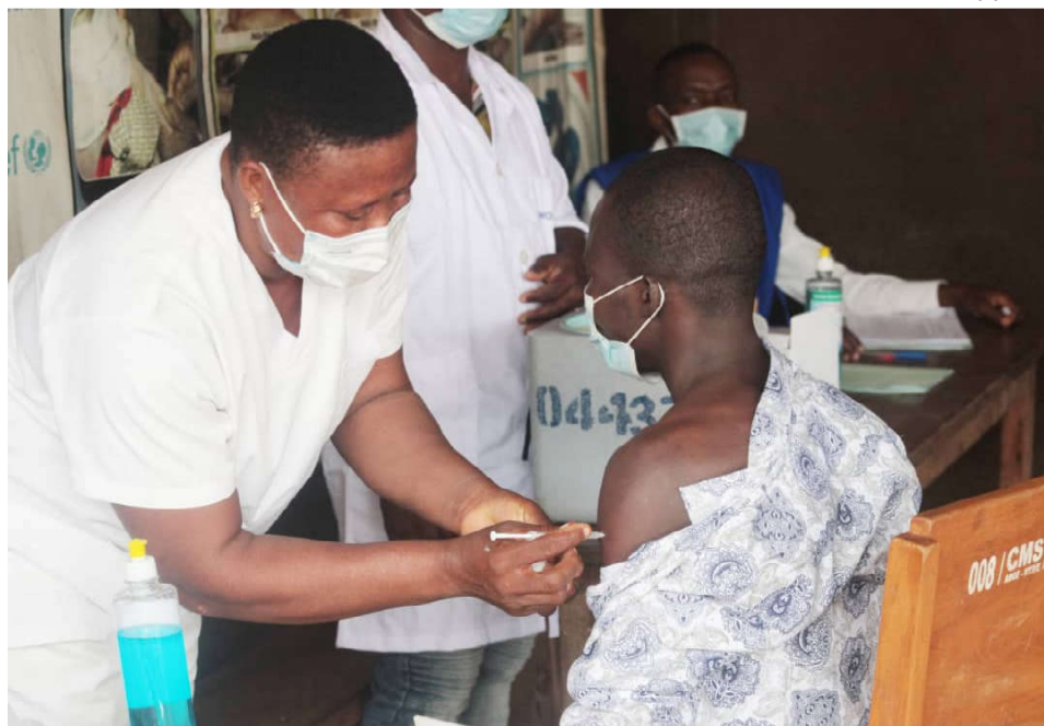
Une personne se faisant vacciner contre le covid-19

Lentement mais sûrement, le Togo tend vers une immunité collective dans le cadre du plan de riposte contre la covid19. En effet, le Gouvernement togolais a lancé depuis la semaine dernière la campagne d'administration de la deuxième dose du vaccin Astra Zéneca aux populations pour les prémunir contre surtout les cas graves de la Covid19. Comme lors de la première phase, cette phase commence par le personnel de la santé qui a reçu sa 2 e dose entre le 19 et 21 mai. Après c'est le tour des personnes âgées de 50 ans et plus dans le Grand Lomé, avant de s'étendre enfin à toutes les personnes de 30 ans et plusieurs l'ensemble du territoire national. Pour limiter les effets indésirables, il est conseillé à ceux qui ont pris la première dose