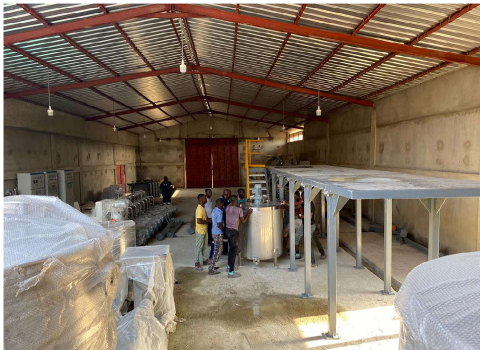
Une vue de l'intérieur de l'usine

Toute différence est positive et source d'enrichissement social et non de division. Togolais du Nord au Sud, de l'Est à l'Ouest, tous, nous devons nous accepter.