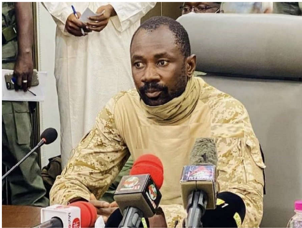
Assimi Goita, le chef de la junte militaire

Au Mali, le Président de la transition Bah N'Daw et le Premier ministre Moctar Ouane ont rendu leur démission au lendemain de leur arrestation par la junte militaire lundi 24 mai dernier. Un deuxième coup d'Etat en neuf mois, après celui perpétré en août 2020 mettant donc en difficulté le processus de transition en cours depuis la chute de l'ex-président IBK. A Bamako, la situation reste incertaine et tendue.